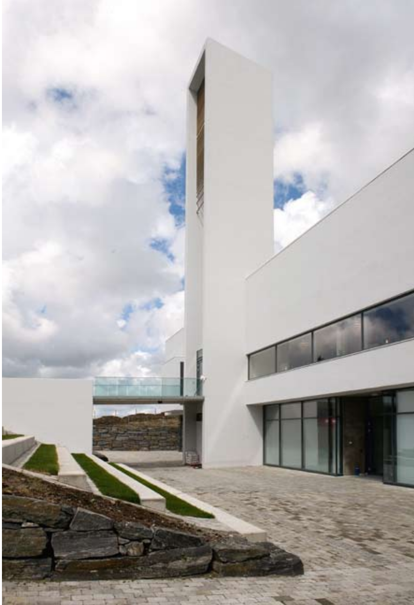
Uteområdet er utformet som et aktivitetslandskap, og store deler av året kan uteområdet benyttes til ulike arrangementer.