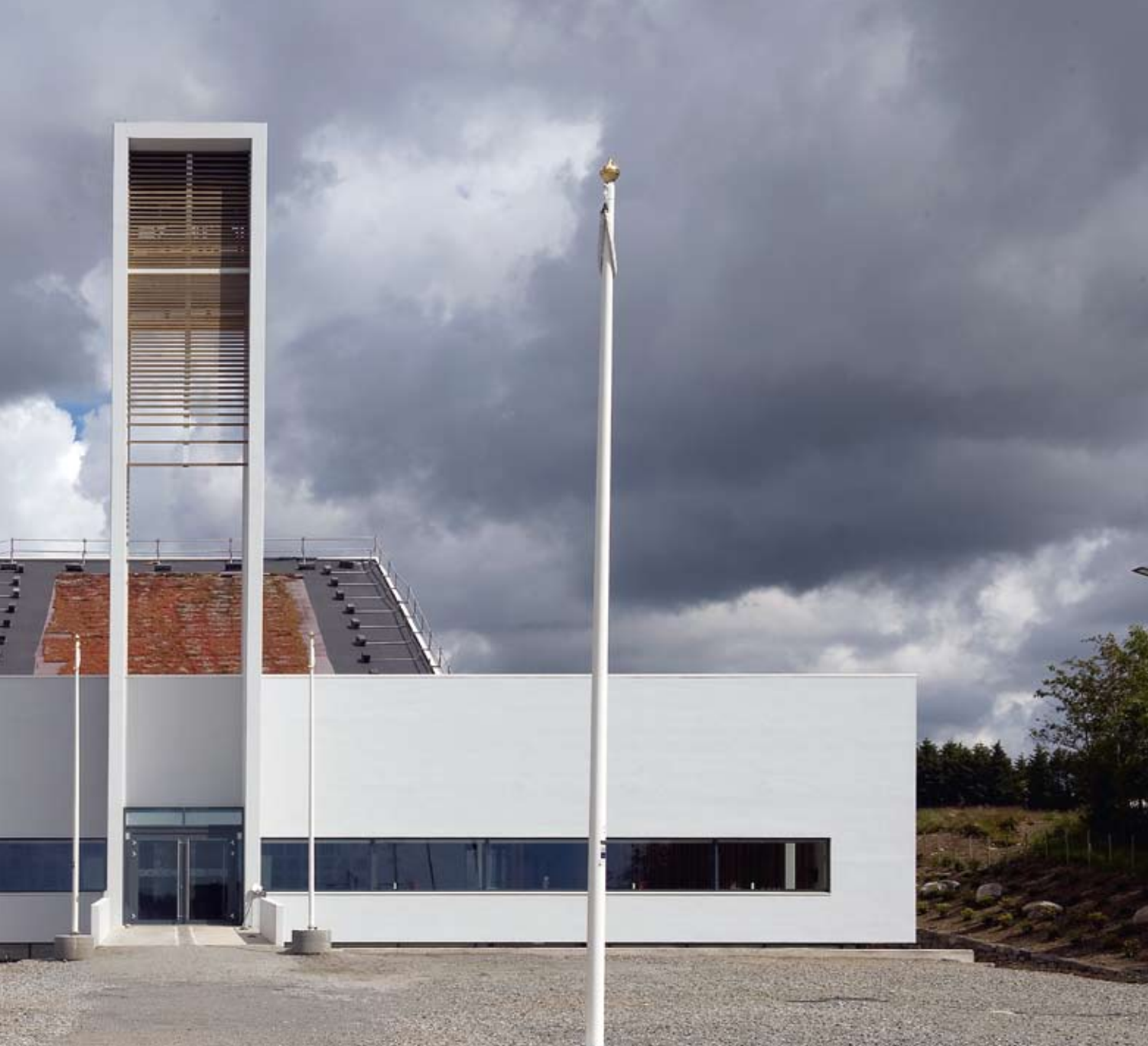
Fra vest. En stram akse leder folk inn i kirken. Som i gamle kirker går en gjennom tårnet på vei inn.