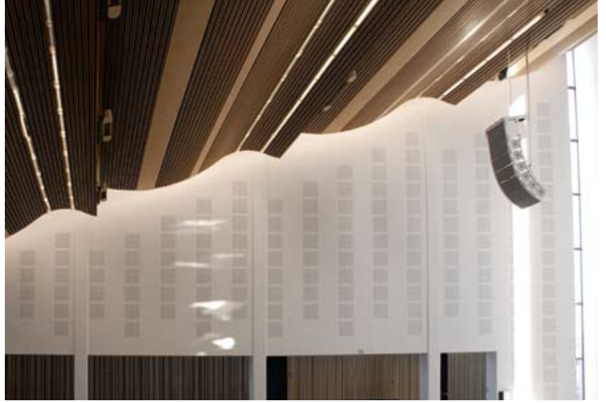
Gulvets stramhet står i kontrast til den bølgende himlingen. Man kommer helt nær den ved adkomsten, men så stiger den dramatisk oppover.