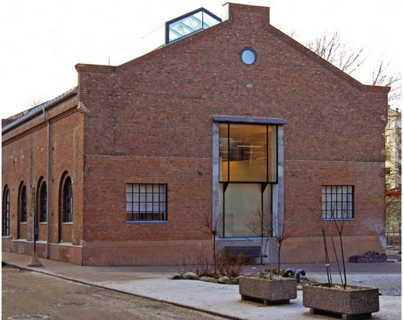
Den gamle linoljefabrikken

Bygningen ligger på den gamle fabrikktomta til Lilleborg fabrikker i Oslo.