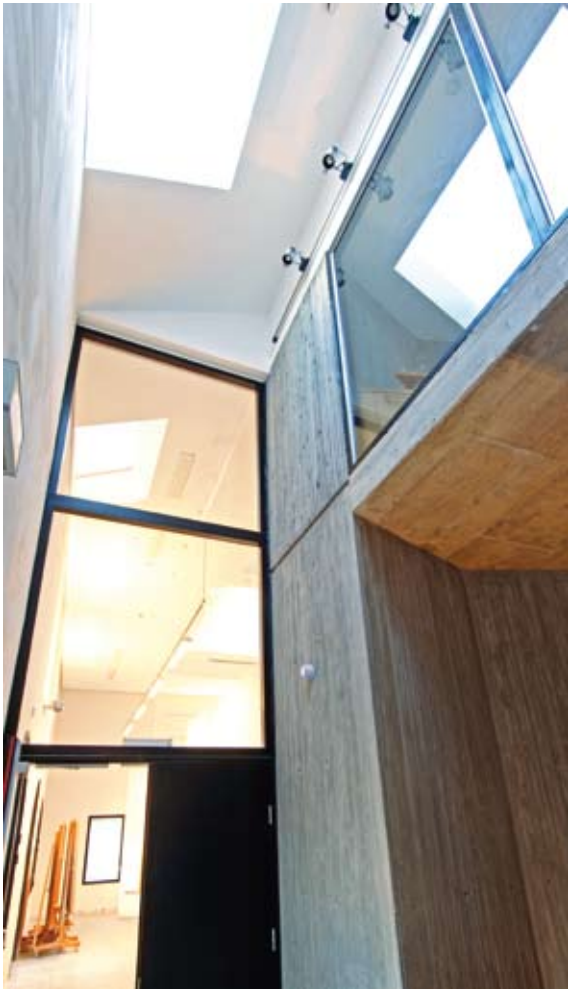
Sentralt i bygget en betongkjerne inneholdene trapp og våtrom