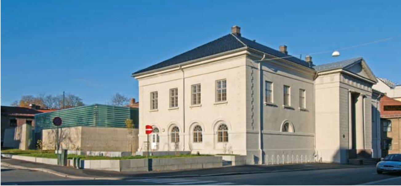
Arkitekturmuseet sett fra sydøst. Den nye paviljongen skal inneholde skiftende utstillinger, mens hovedinngang, vandrehall og øvrige publikumsfasiliteter er lagt til Groschbygningen