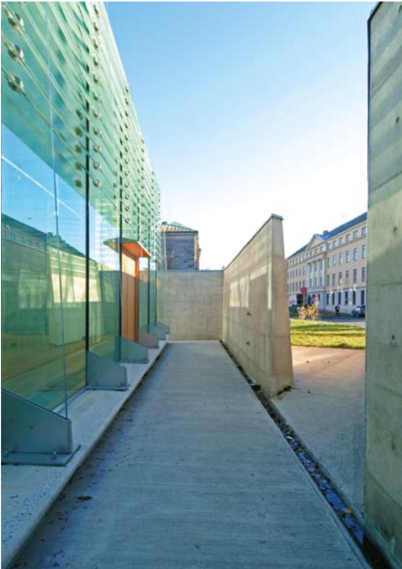
Paviljongen omkranses av utenforliggende murer som samspiller med Akeshusfestning, utvider rommet og fremstår som et rolig bakteppe for utstillingene

Det nye Arkitekturmuseet har overtatt Norges Banks eldste filial og Riksarkivets Magasin på Bankplassen 3 i Oslo. Arkitekt Sverre Fehn AS er arkitekt både for rehabiliteringen av den gamle bygningsmassen og for den nye utstillingspaviljongen som er reist i parken mot sydvest. Offisiell åpning av de nye lokalene er planlagt i mars 2008 med en stor utstilling viet Sverre Fehn og hans arbeider.