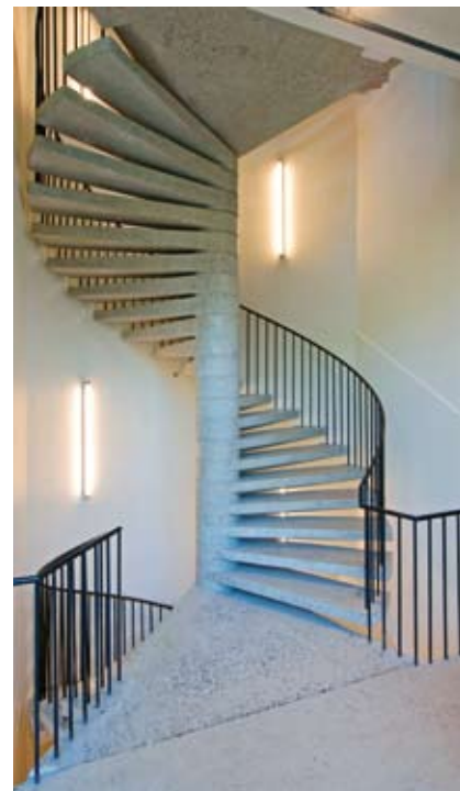
Prefabrikkert trapp i Magasinbygningen støpt i lys betong