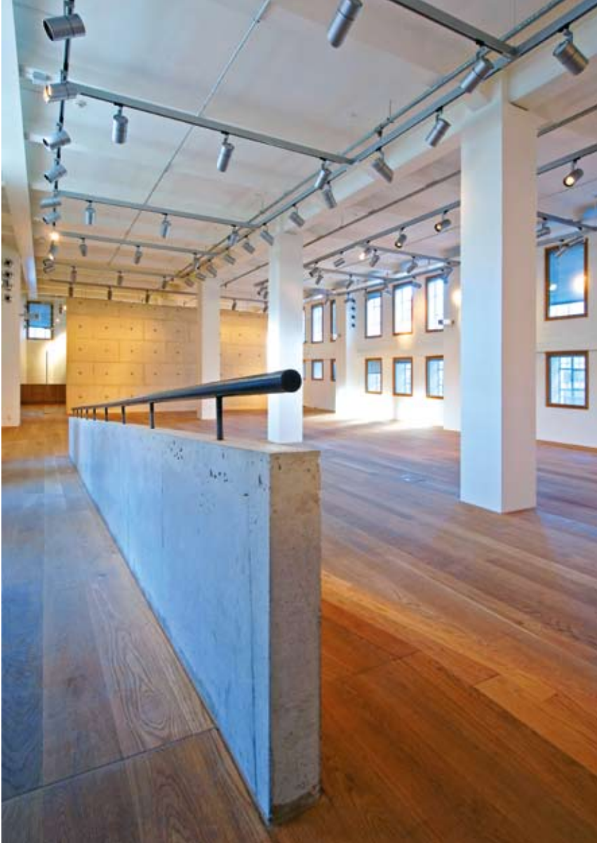
1. etasje i Magasinbygningen hvor museets permanente utstilling skal presenteres Støpt utstillingsvegg i Magasinbygningen