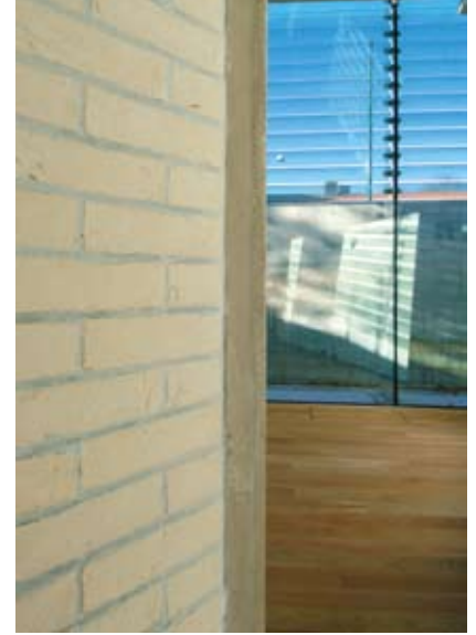
Fra paviljongens entré – pulikumsadkomsten fra Groschbygningen

Mot syd er det adkomst til parken med uteservering i sommerhalvåret. Handikap- og personalinngang samt varelevering er fra Nedre Slottsgate, hvor det er etablert adkomst uten nivåforskjeller.