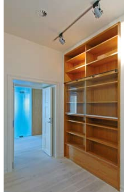
2. etasje i Groschbygningen rommer administrative lokaler