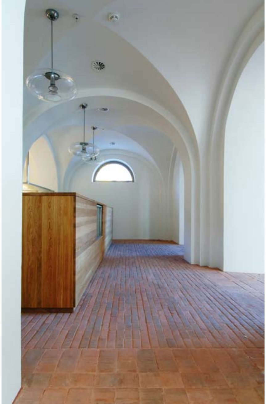
Groschbygningens opprinnelige karakter er tydeliggjort ved at bygningsstrukturen er avdekket og lesbar i et spennende samspill med nye elementer og romkonstellasjoner

Paviljongen er i plasstøpt lys betong (hvit sement med lyst tilslag). Fasadene er av glass, gulvene av eik. ■■■