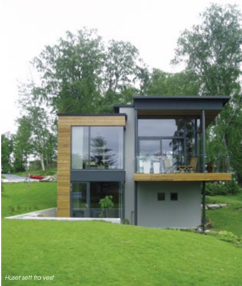
Huset sett fra vest

Tomten på drøye 1650 m 2 er fradelt fra eiendommen Klevstuen med bygningsmasse fra slutten av 1800-tallet.