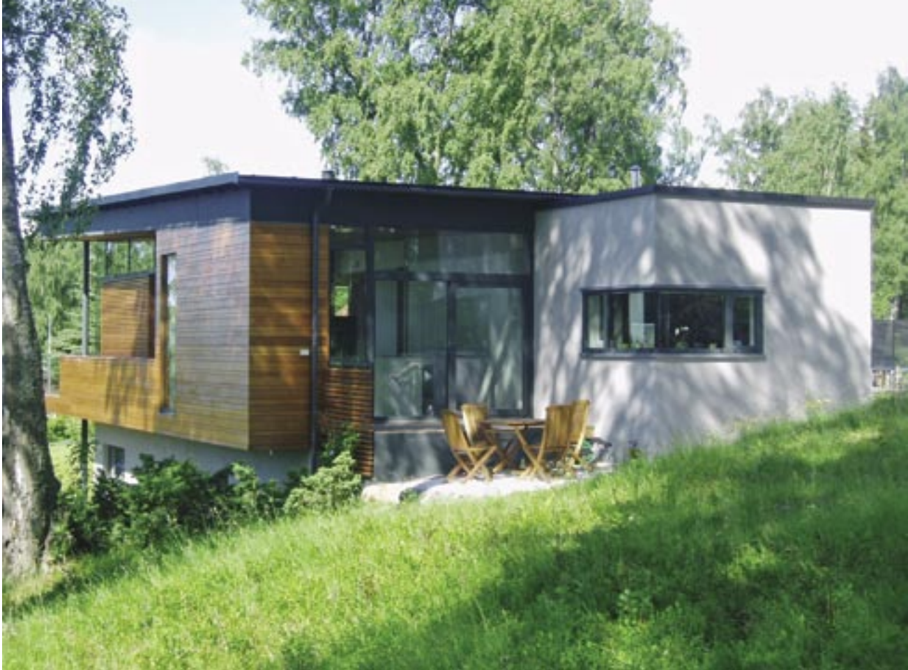
Fra sydøst; frokostplassen