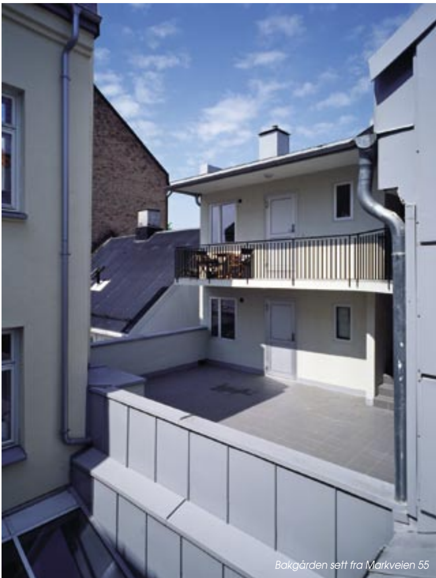
Bakgården sett fra Markveien 55

Tomten/eksisterende bygg var regulert til forretning i 1. etg. og bolig i 2. og 3. etg.