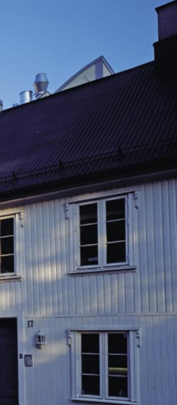
Fasade mot Stolmakergata