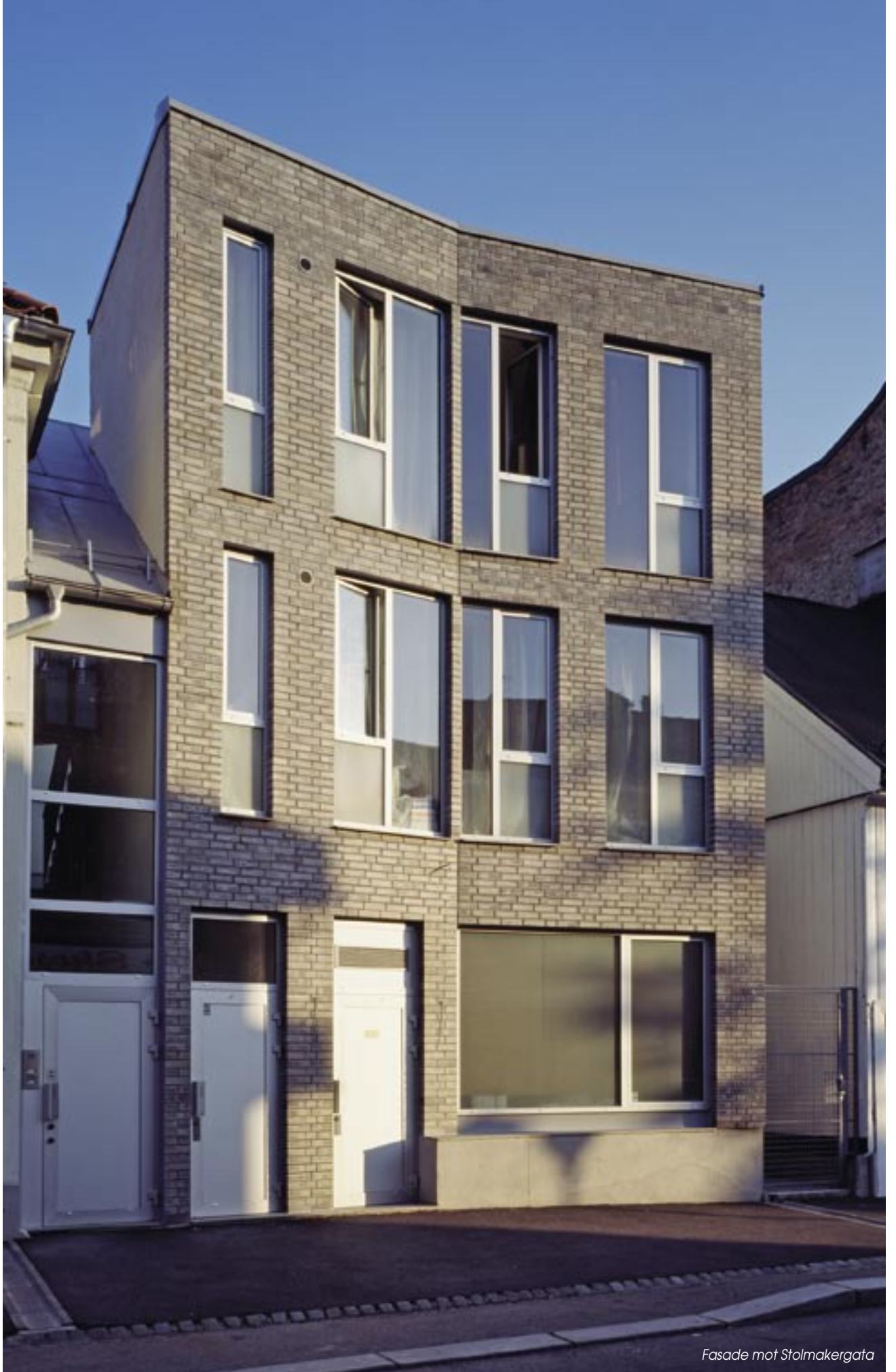
Fasade mot Stelmakergata