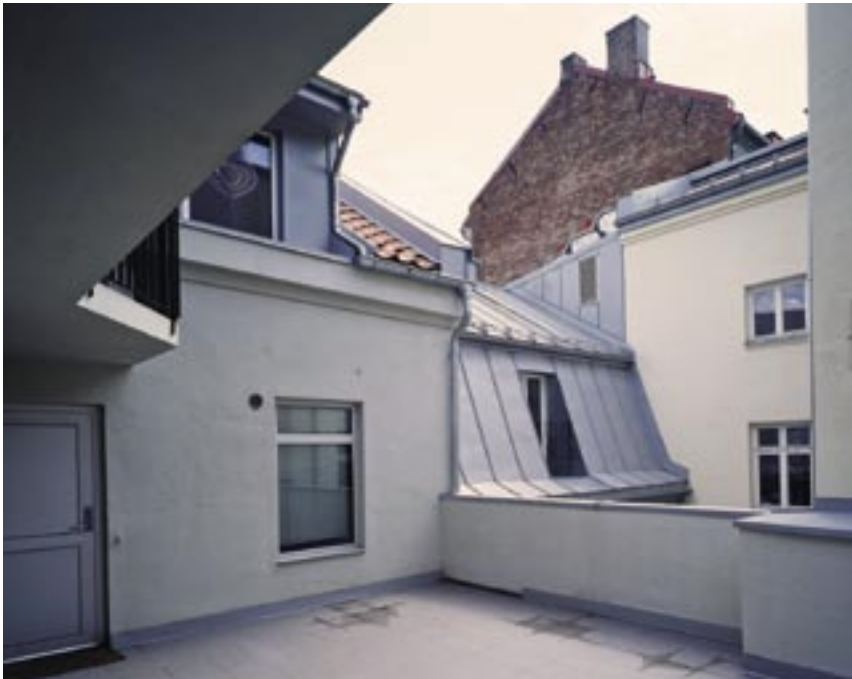
Utsikt mot Markveien 55