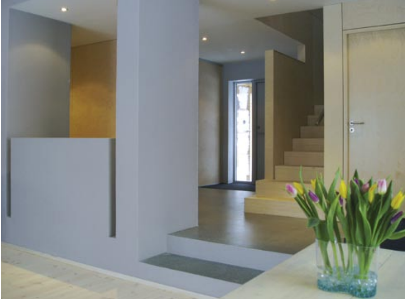
Overgangen mellom mur- og trevolum