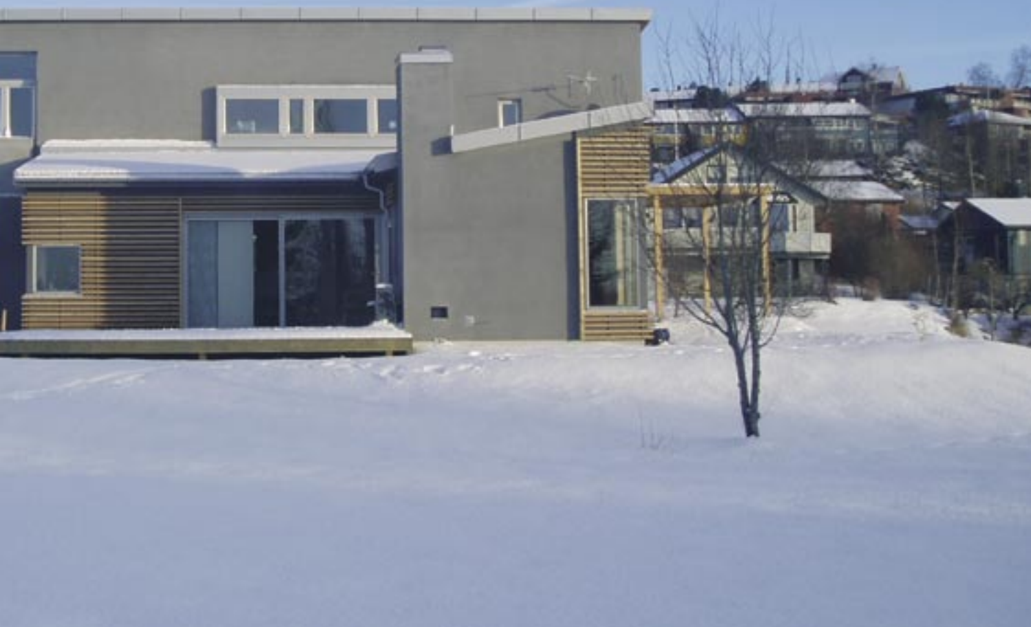
Huset sett fra sørvest