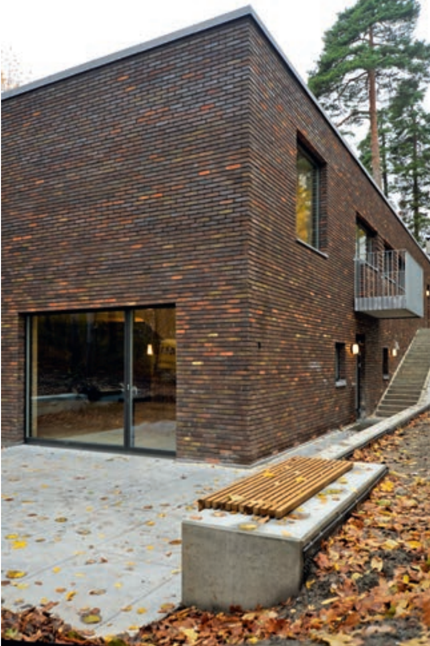
Sett fra nord-øst. Terrassen har utgang fra oppholdsrom i underetasjen