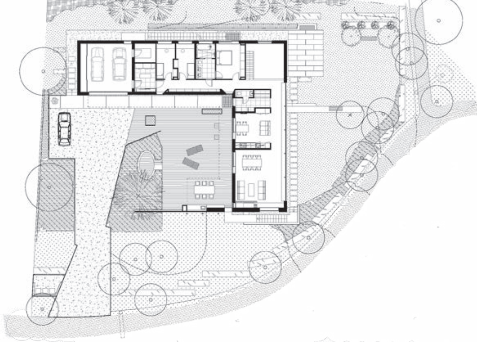
Plan 1. etasje