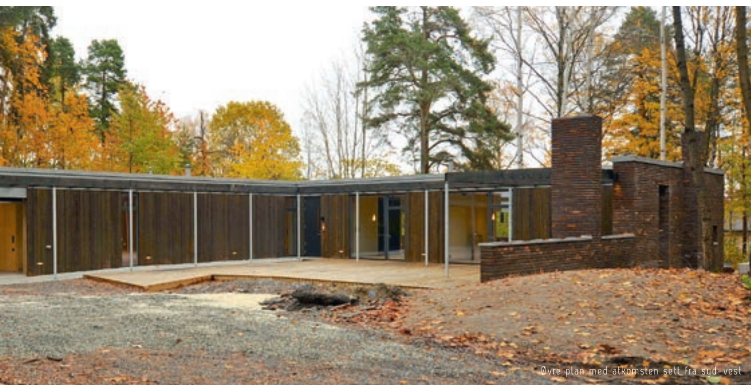
Øvre plan med atkomsten sett fra syd-vest