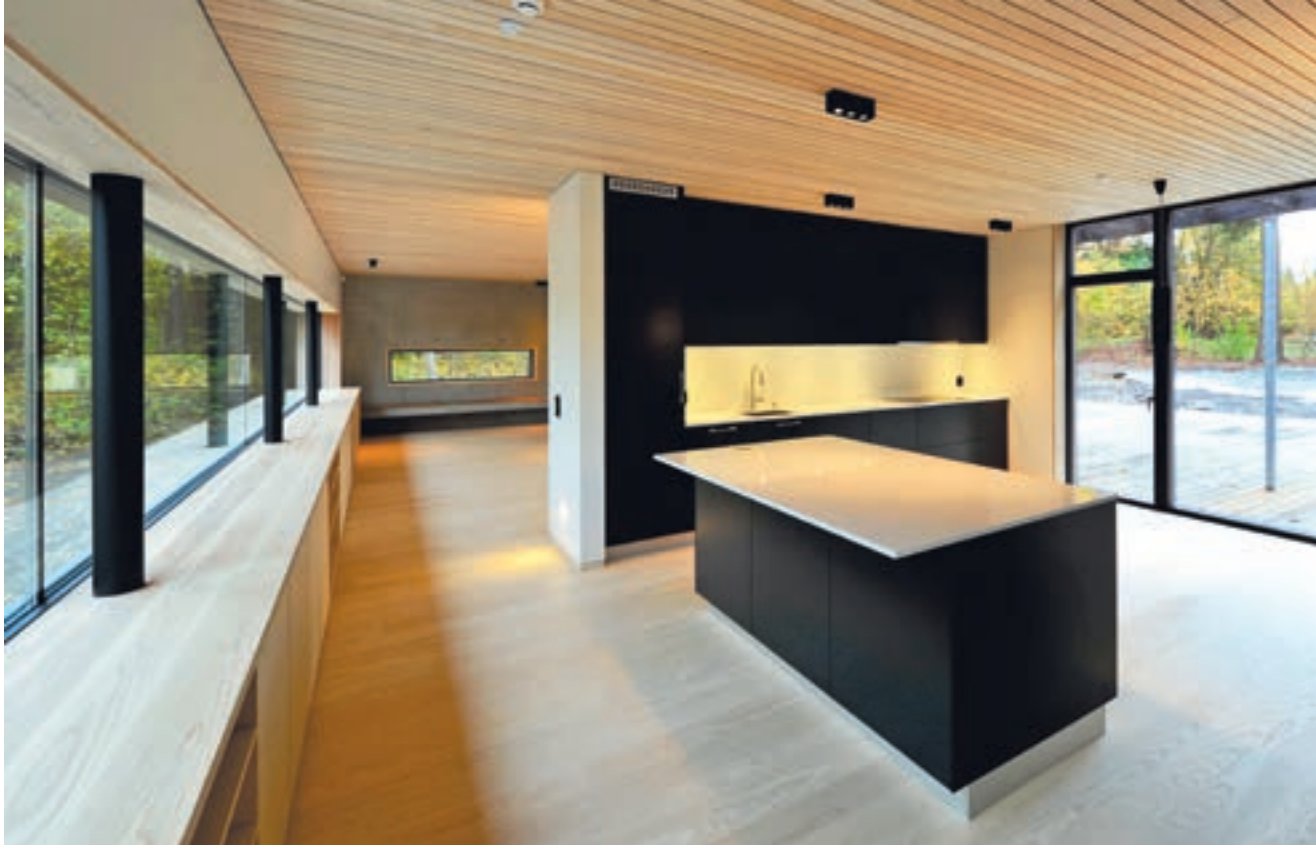
Hovedoppholdsrom og kjøkken ligger i en gjennomlyst, nord/sørgående fløy