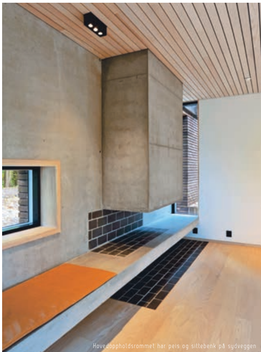
Hovedoppholdsrommet har peis og sittebenk på sydveggen

På sørsiden finnes en liten uteoppholdsplass med betongdekke som har skårne riss i mønster. Plassen avgrenses av sittepodier med trespiler.