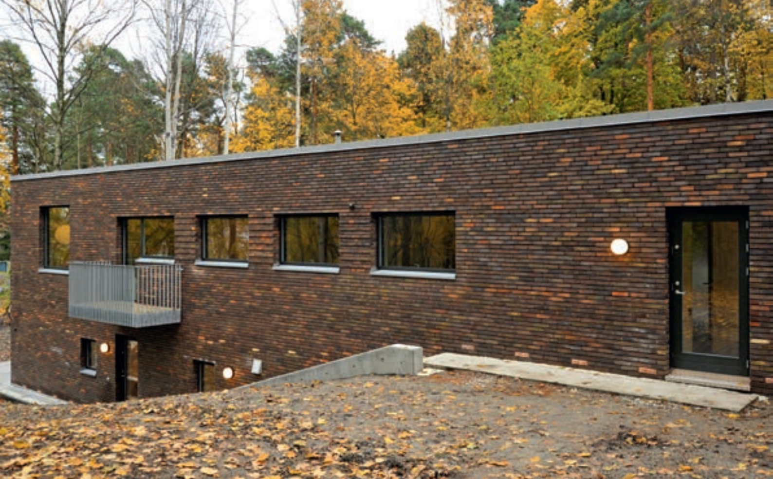
Nordfasaden med dør til garasjen på sydsiden. Hovedsoverommet utgang til balkong