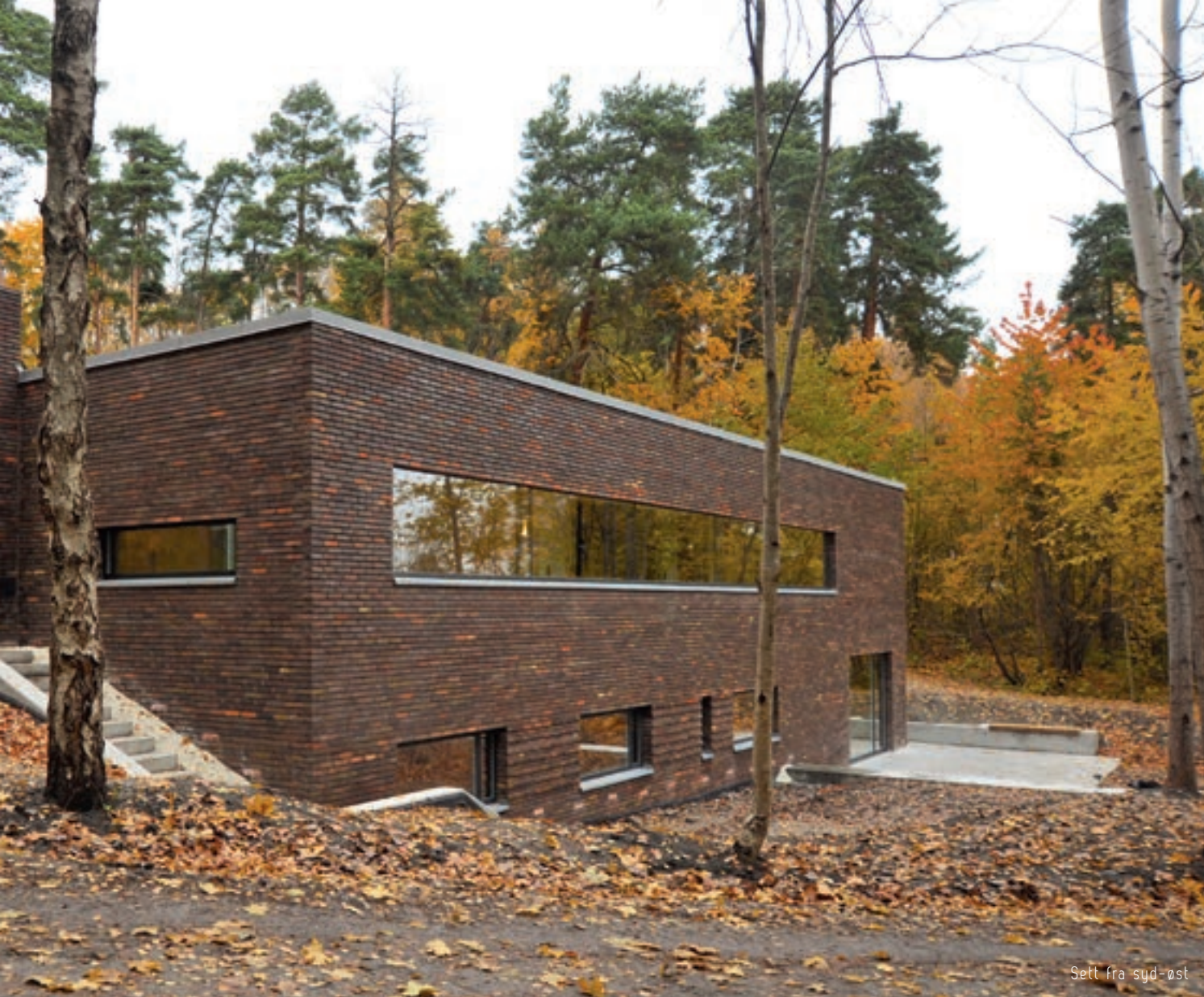
Sett fra syd-øst