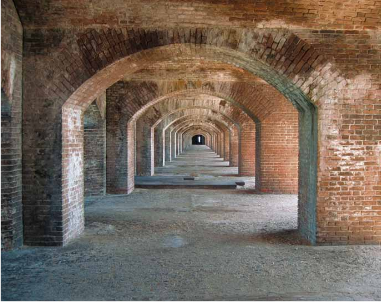
Denne majestetiske buegangen er en av de lengste i sitt slag. Fortet har over 2.000 murte buer

Kruttmagasinet ble aldri ferdigstilt. Kruttet ble oppbevart under tak, men med den høye luftfuktigheten var det vanskelig å holde det helt tørt