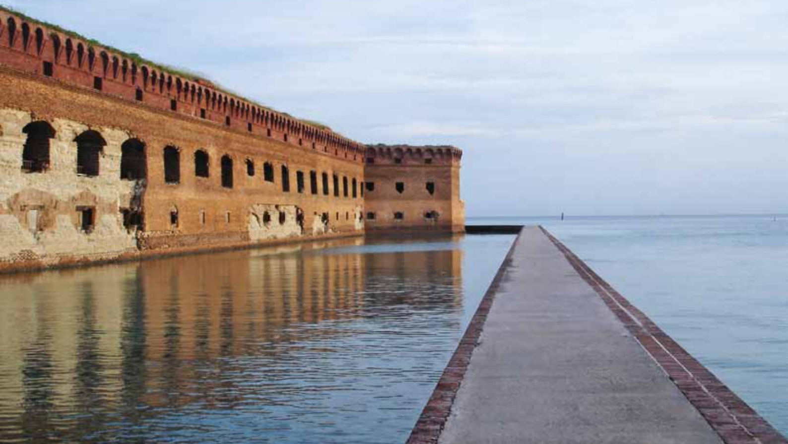
Armeringskorrosjon i kombinasjon med forbigående orkaner har gjort stor skade på de ytre murene i årenes løp. Bare i 2005 ble Garden Key rammet av hele tre orkaner.

De ulike teglfargene bærer tydelig bud om at teglleverandøren ble byttet ut underveis.