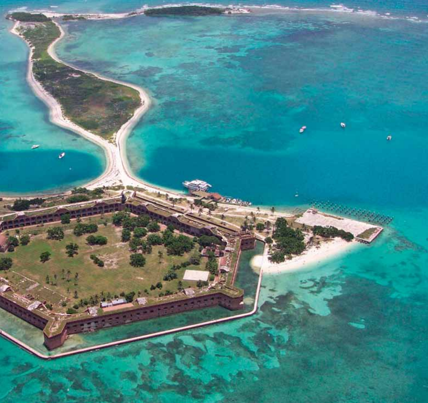
Befestningen har en hexagonal plan, med kortere vegger på to sider som tilpasning til øyas ovale form. Øya ligger på sandgrunn, og høyeste punkt er kun én meter over havet.

Disse syv små øyene – Dry Tortugas – er fabelaktig vakre. De ble oppdaget av europeerne for 500 år siden, men med unntak av fortet er de så å si uberørt av menneskelig aktivitet. Øygruppen er et ornitologisk paradys, et hekke- og rugeområde for tusenvis av sjøfugl og for store havskilpadder. Mengder av fargerike fiskeslag og koraller holder til i havet. Dry Tortugas fikk første del av navnet sitt fordi øyene mangler drikkevann. Tortugas er den spanske betegnelsen på hav-