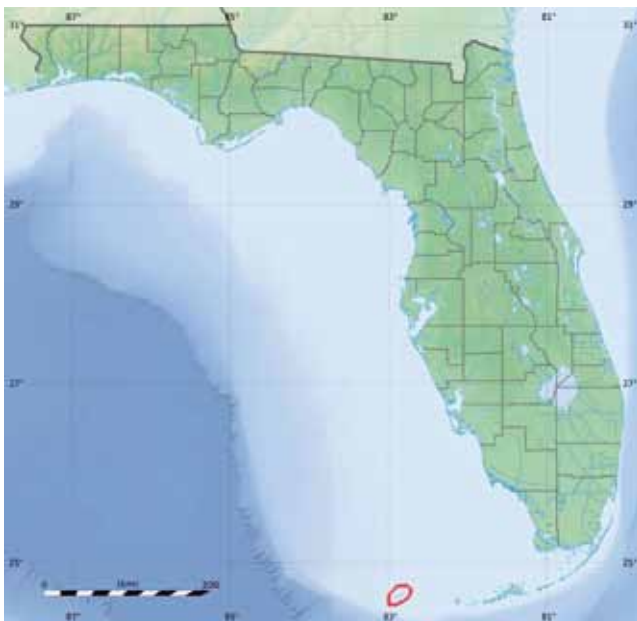
Øygruppen Dry Tortugas ligger avsidesliggende til – 110 km vest for Key West, Florida – den sørligste byen i USA