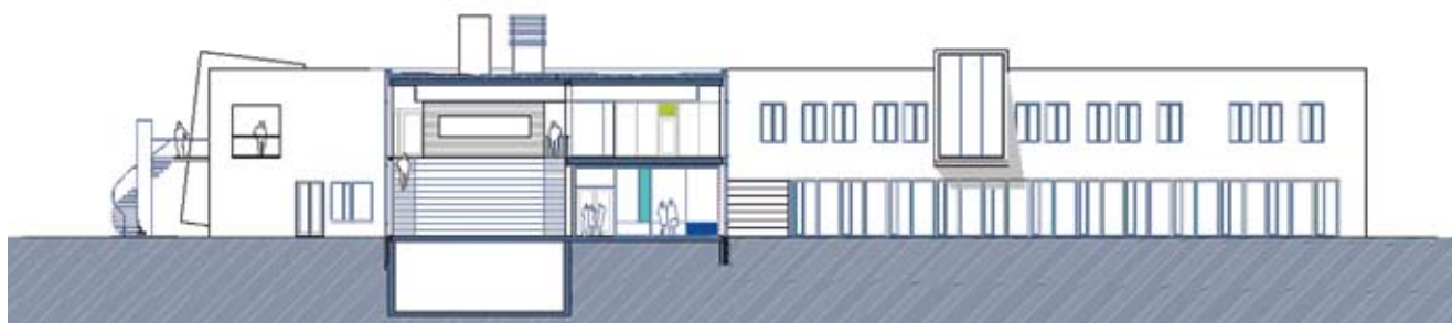
Snitt -fasade nord