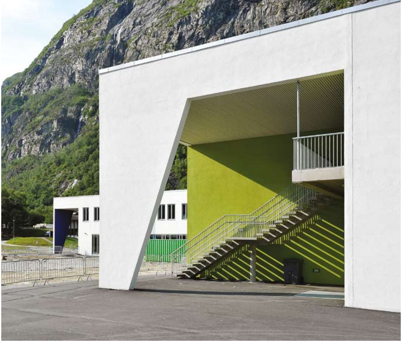
Ungdomsskolen sett fra syd