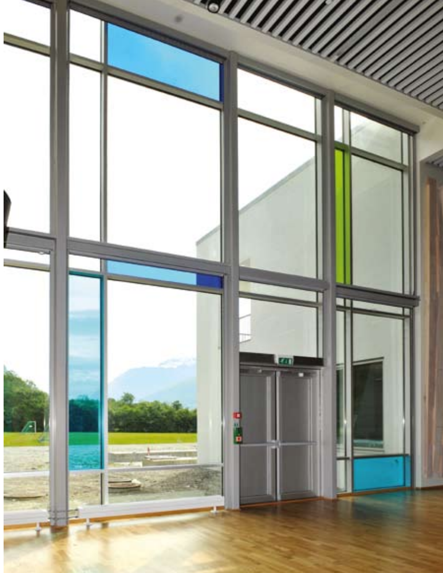
Utsikt oppover Sunndalen fra vestibyle