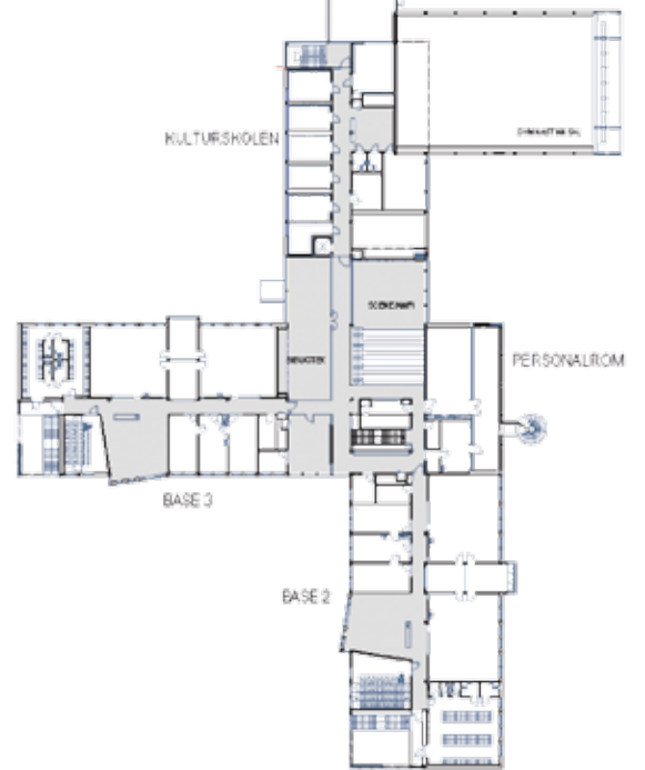
Plan 2. etasje

Skråstilte glassflater åpner mot himmelen og lyset