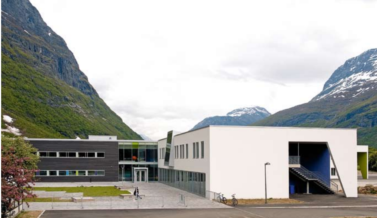
Kulturtorget sett fra vest