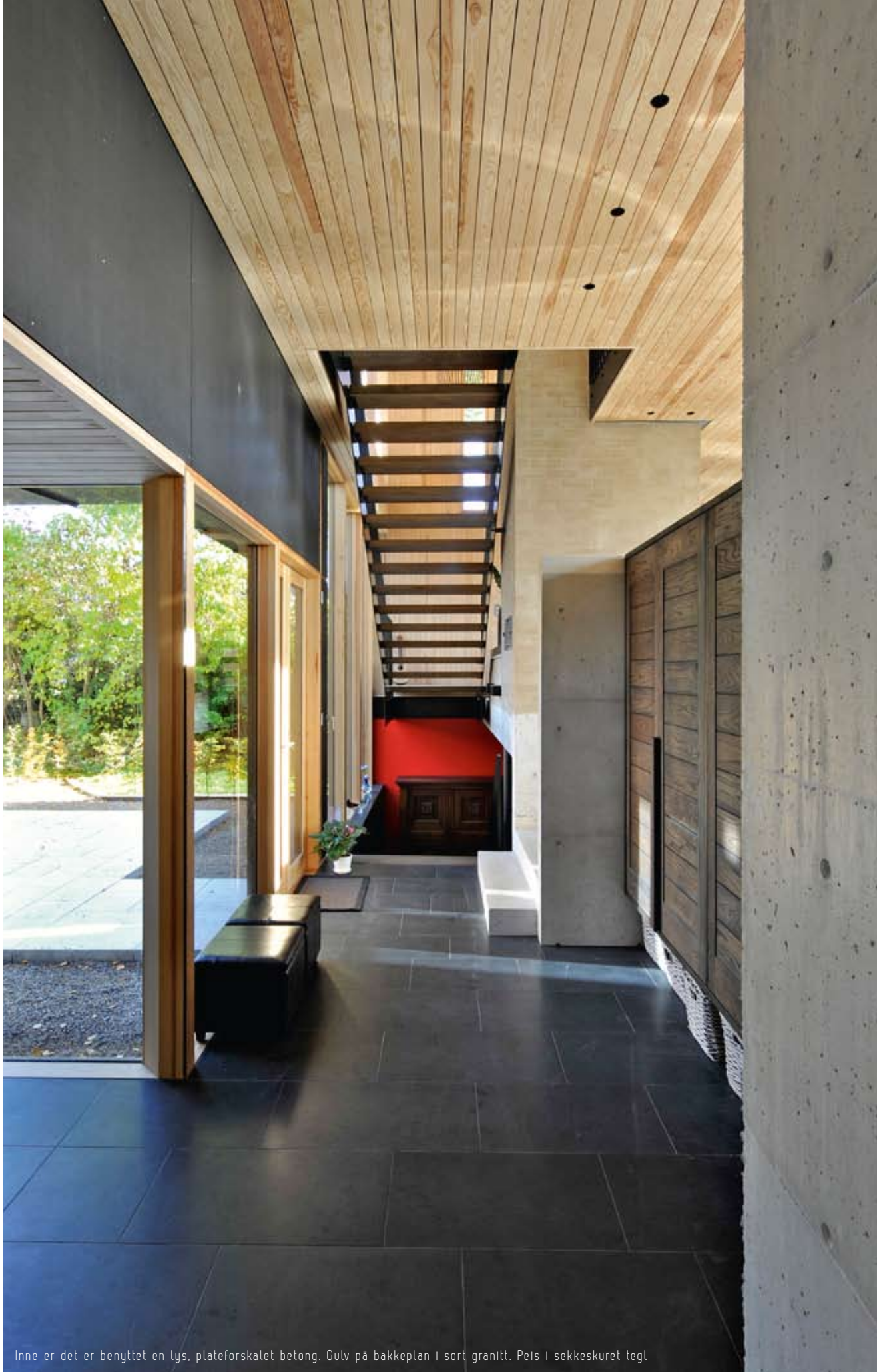
Inne er det er benyttet en lys, plateforskalet betong. Gulv på bakkeplan i sort granitt. Peis i sekkeskuret tegl