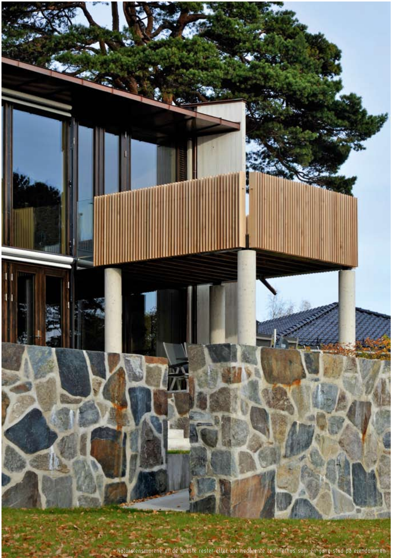
Naturstensmurene er de eneste rester etter det nedbrente tømmerhus som en gang stod på eiendommen