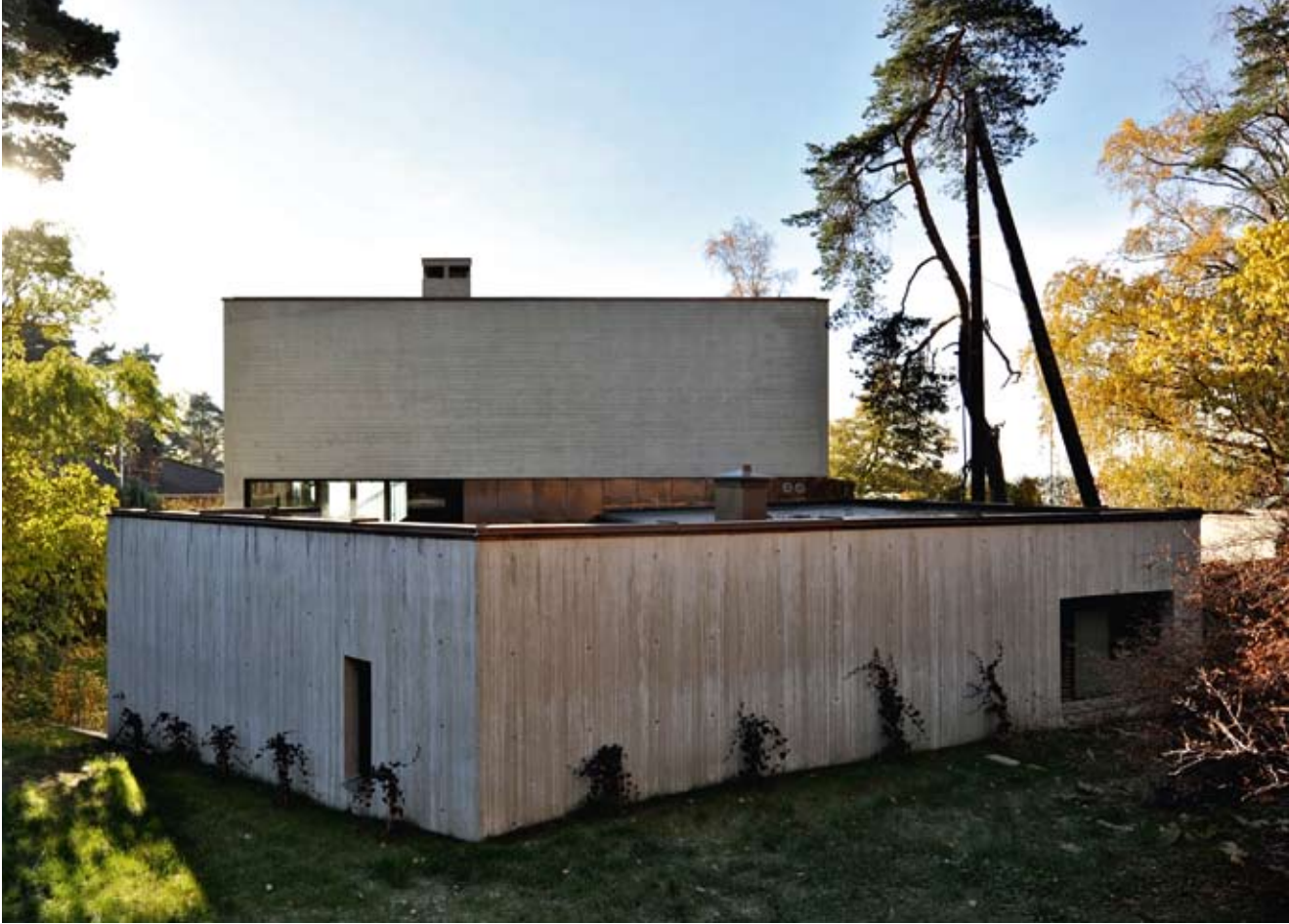
Den énetasjes soveromsfløyen ligger som en beskyttende klave og danner et intimt atrium