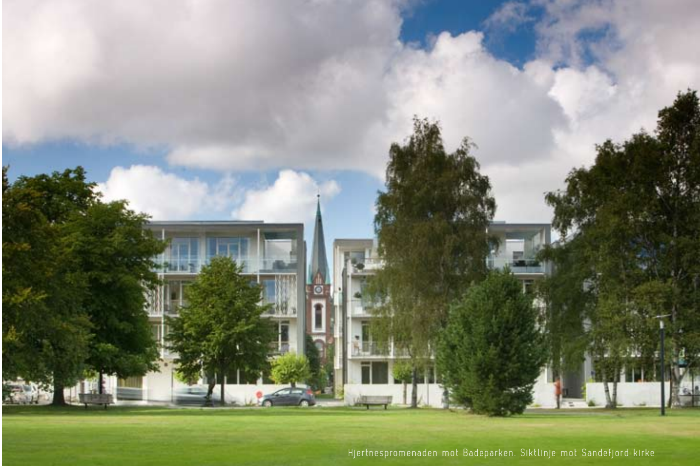
Hjertnespromenaden mot Badeparken. Siktlinje mot Sandefjord kirke