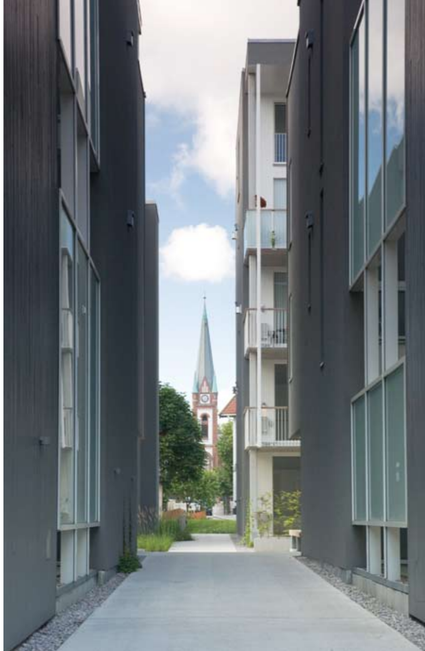
Atrier gir leilighetene lys fra tre sider

Reguleringen tillot høyder tilsvarende fire etasjer med en tilbaketrukket femte etasje. På grunn av innpassing til eldre bebyggelse var det et bevisst ønske å ikke utnytte maksimal høyde, men begrense nye bygg til fire etasjer. For ikke å miste bruksareal, ble den dype tomten utnyttet til dyp bebyggelse med relativt stort fotavtrykk. Åpne passasjer mellom husene opprettholder viktige siktlinjer og den gamle byens 'smelt og smug.' Kirkeaksen ligger i en av disse ganglinjene.