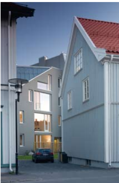
Tilpasning mot eksisterende bebyggelse

linjer, plasstøpt betong og elvesingel langs fasadene. På de vertikale, tette veggene er det variert med klatrevegetasjon. Utformingen spiller opp mot det store parkrommet, med sine grønne plenarealer, flotte trær og mye luft.