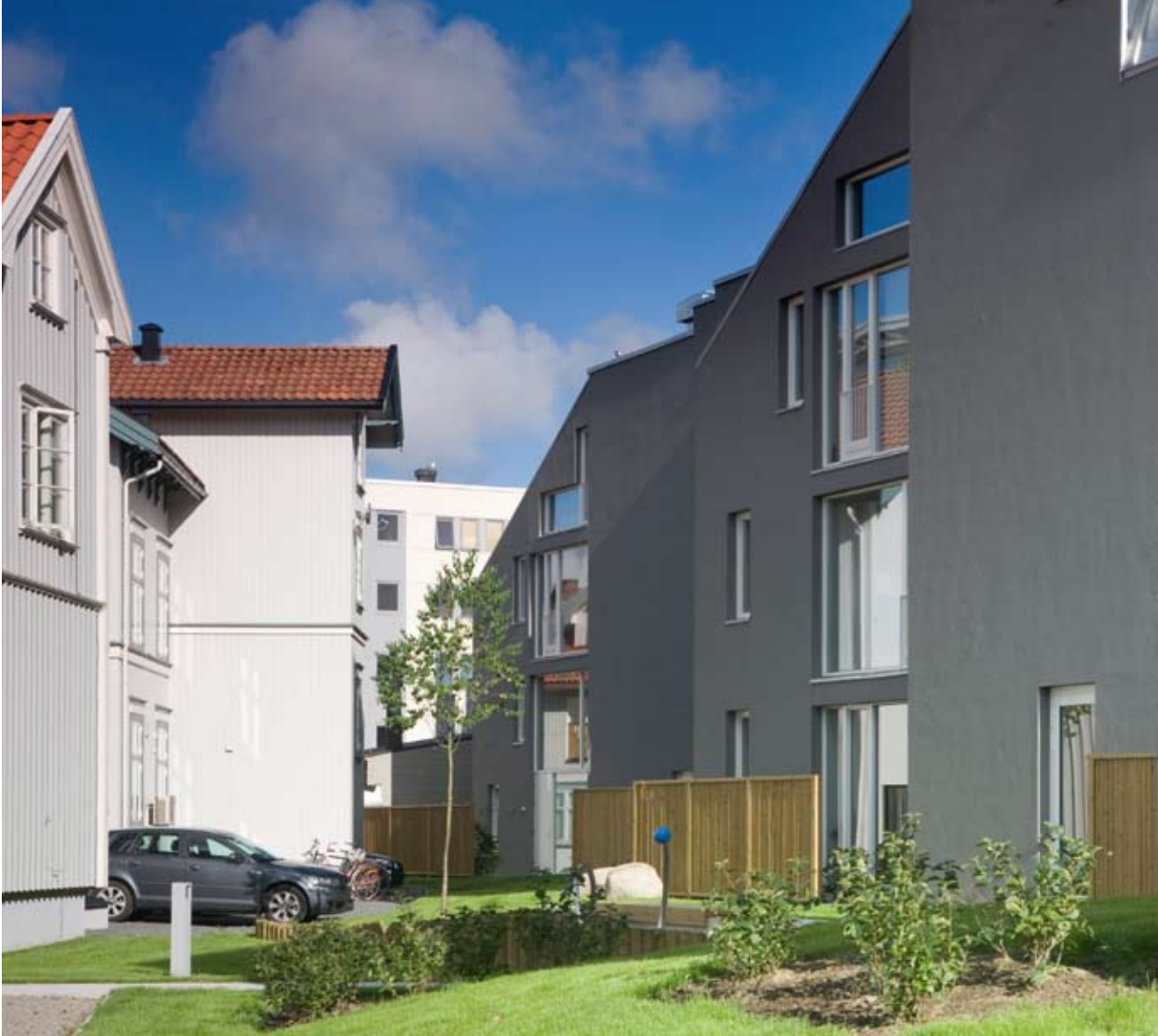
Nytt møter gammelt