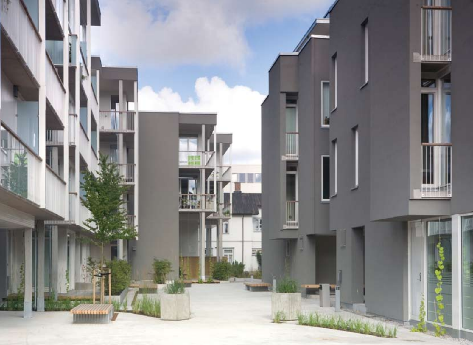
Fra det sentrale uterommet: Dekket er i lys, plasstøpt betong med 'revner' beplantet med pryddgras, tuntre og benk