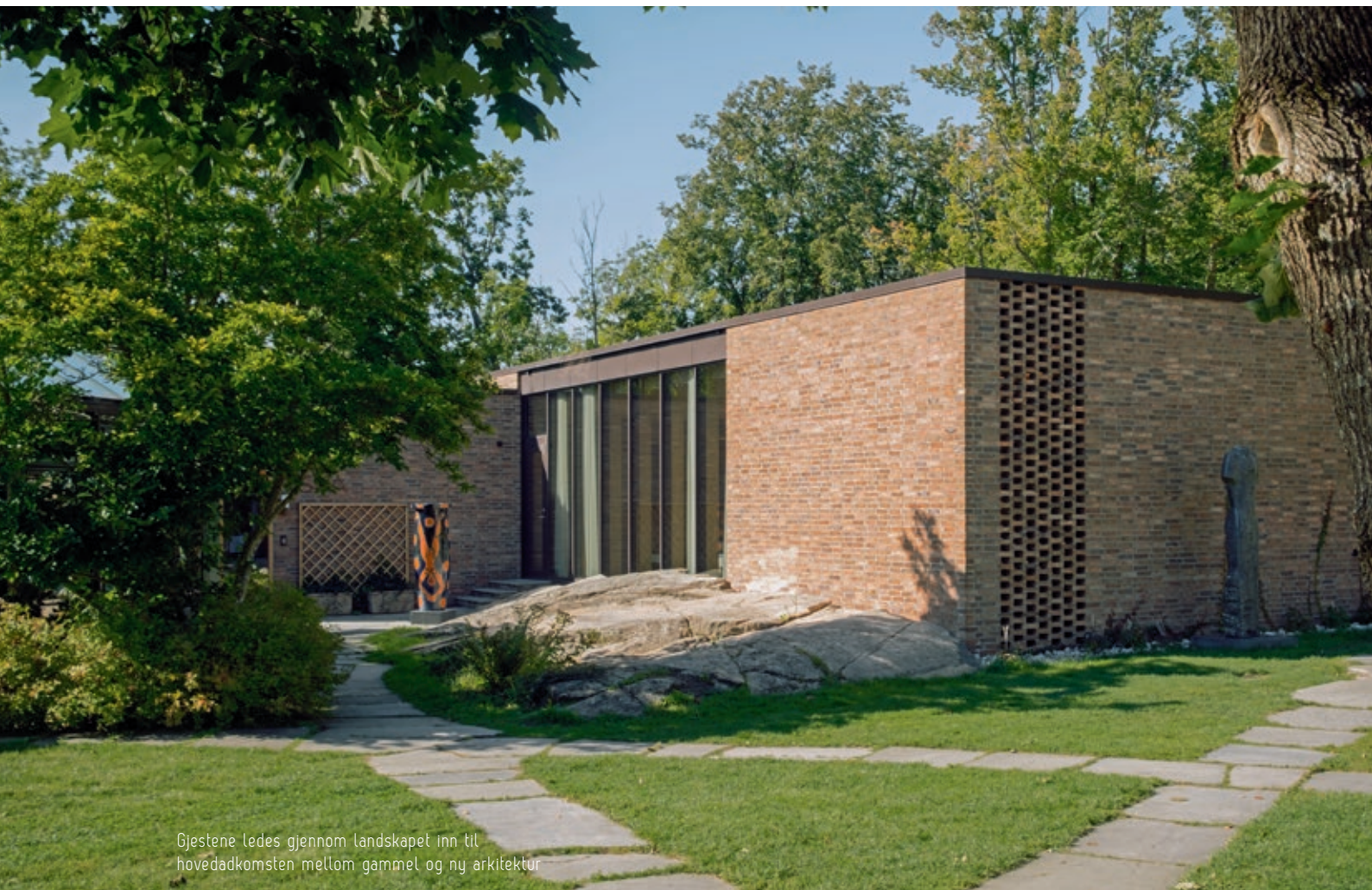
Gjestene ledes gjennom landskapet inn til hovedadkomsten mellom gammel og ny arkitektur