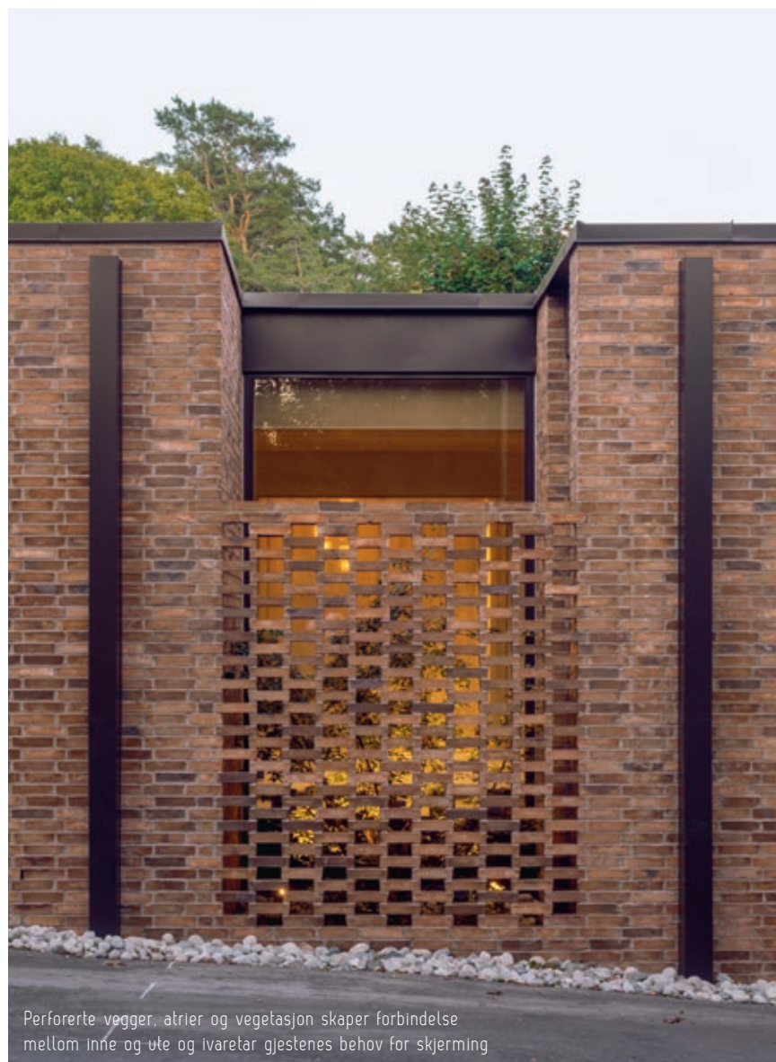
Perforerte vegger, atrier og vegetasjon skaper forbindelse mellom inne og ute og ivaretar gjestenes behov for skjerming

teglsteinens størrelse gir de besøkende opplevelse av karakter og skala som springer direkte ut fra materialets iboende egenskaper og dimensjoner.