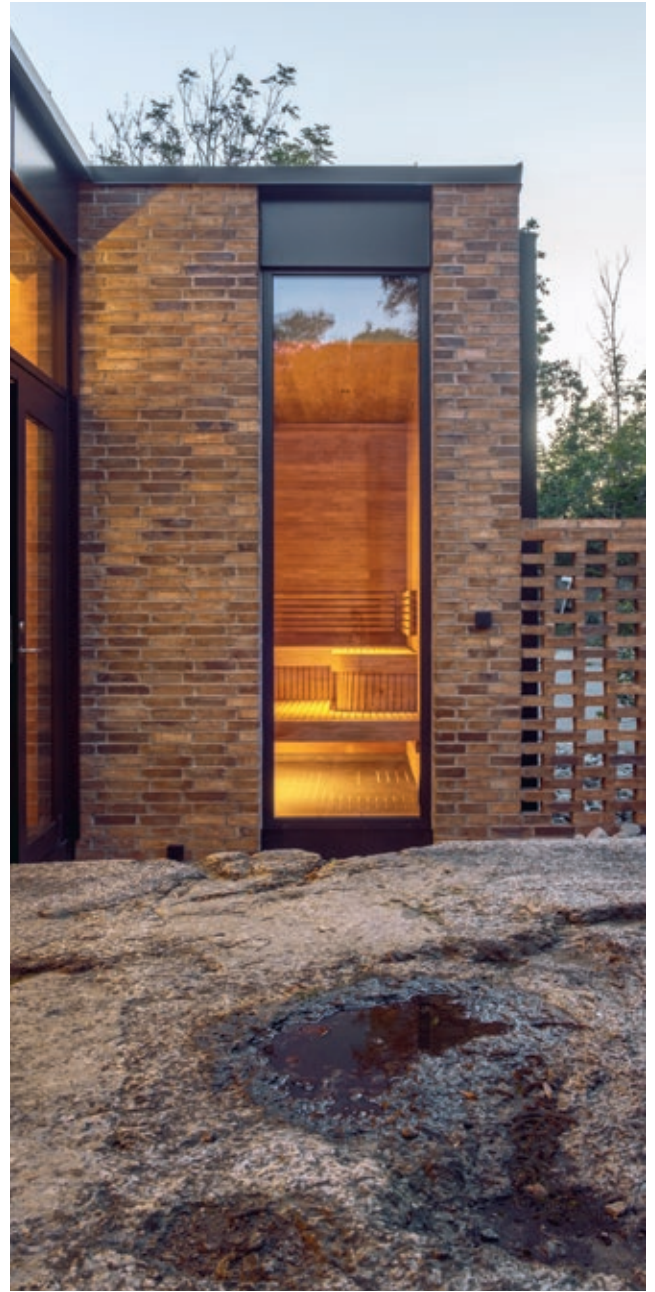
Forblendingen er murt i kvartsteinsforband med gjennomfarget murmørtel

skygge. Vi har forsøkt å skape en balanse med uterommene hvor begge er like viktige i den romlige komposisjonen.