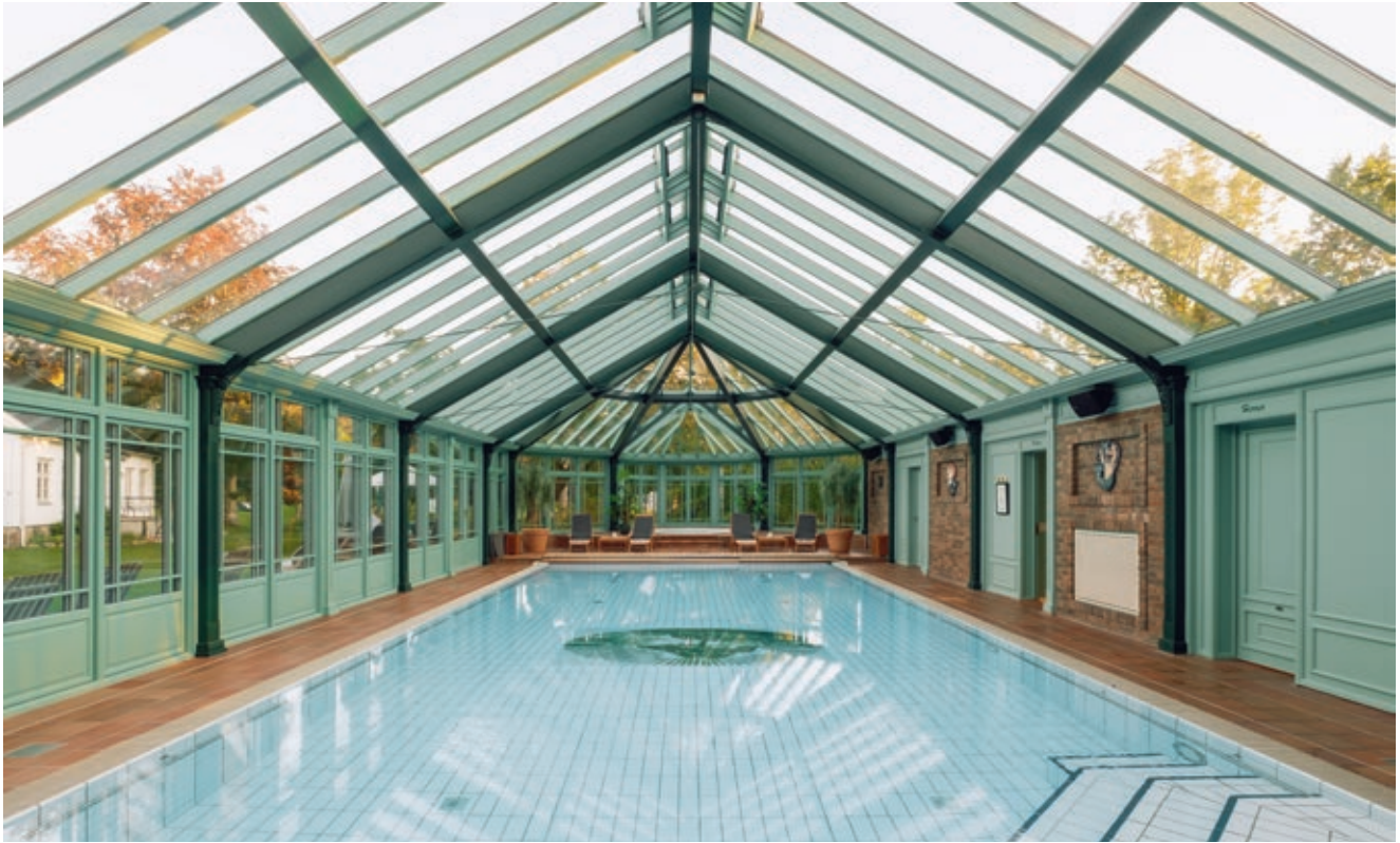
Eksisterende bassengbygning i engelsk vinterhagestil