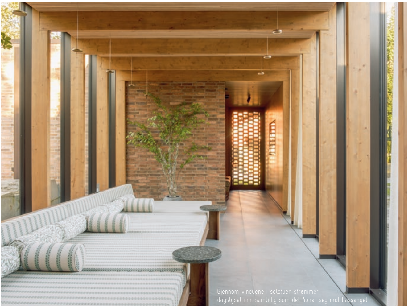
Gjennom vinduene i solstuen strømmer dagslyset inn, samtidig som det åpner seg mot bassenget