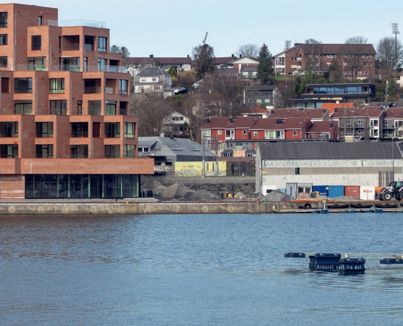
Ankeret sett fra øst

Tekst: Gary Bates/Spacegroup