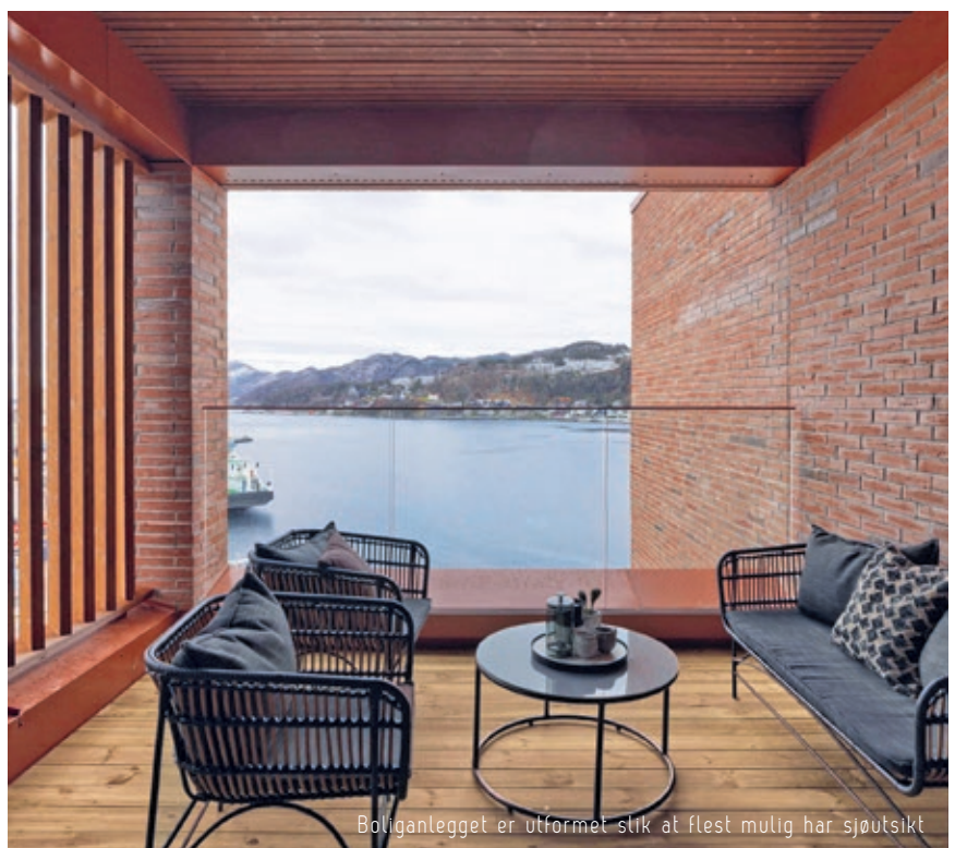
Boliganlegget er utformet slik at flest mulig har sjøutsikt

Kvartalet er utformet som et 'komplett' nabolag med boliger, næringslokaler, service og kontorlokaler, og med egen bussholdeplass i Jernbaneveien. Utformingen sørger for at flest mulig får sjøutsikt. Byggehøydene er nøye tilpasset for å unngå skygger fra nabobygningene og sikre mest mulig sol på utearealene.