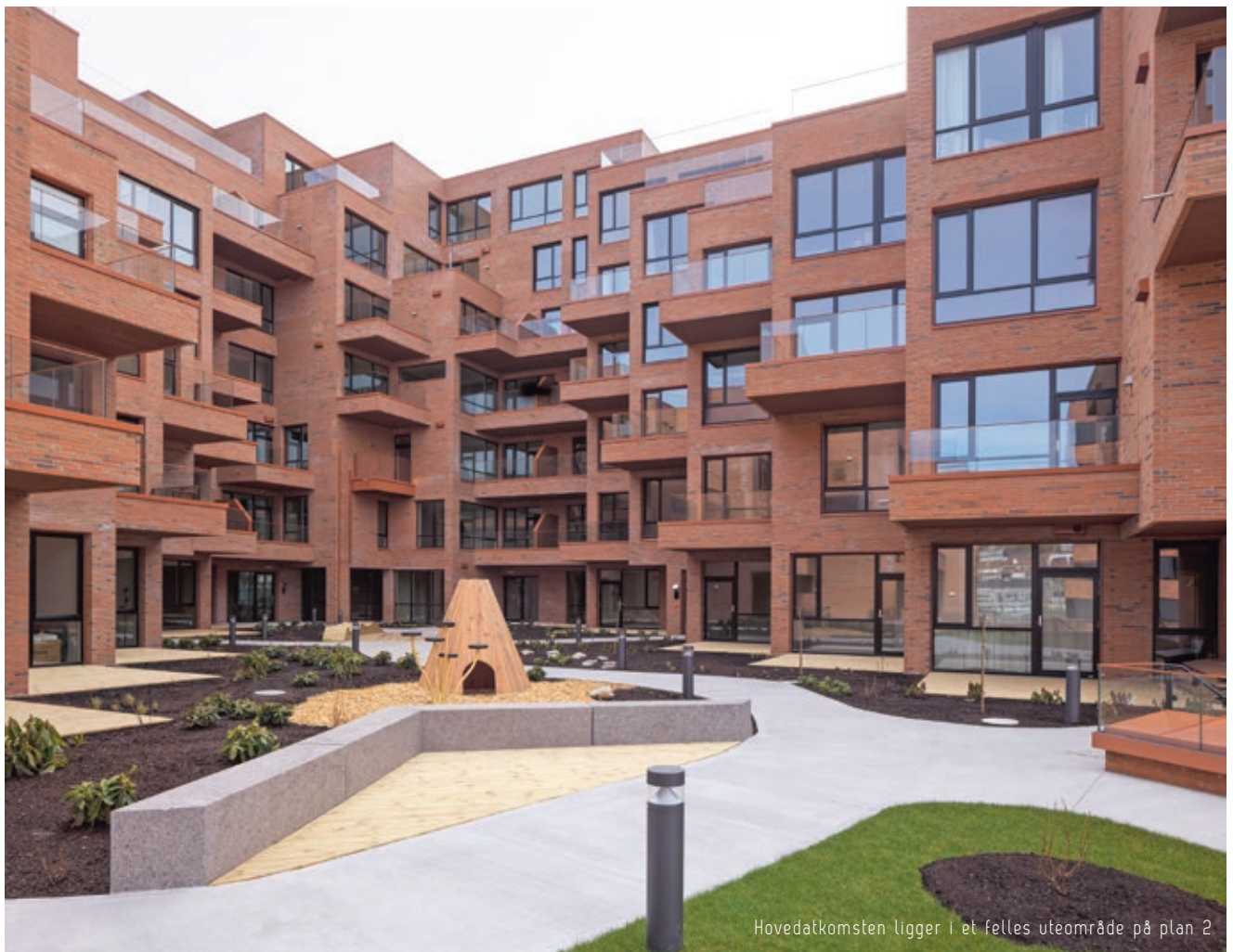
Hovedatkomsten ligger i et felles uteområde på plan 2

Havneparken er en helt ny bydel i Sandnes. Ankeret, det nye kvartalet på brygga, byr på storlagen utsikt mot sjøen og gangavstand til sentrum.