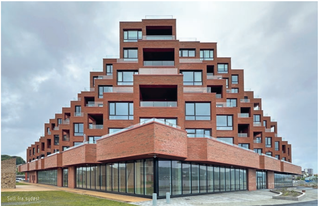
Sett fra sydøst

Alle de 71 boenhetene er forskjellige, og varierer i størrelse fra 37 til 196 m 2 . Arkitekturen er basert på at flest mulig leiligheter skal få både panoramautsikt og uteplass mot sjøen, og med lys som filtreres inn på skjermede verandaer og altaner mot sørvest. Dette er løst ved at leilighetene er orientert ca. 45 grader i forhold til nord-sør-aksen og ved nedtrapping av bygningen i alle fire retninger.