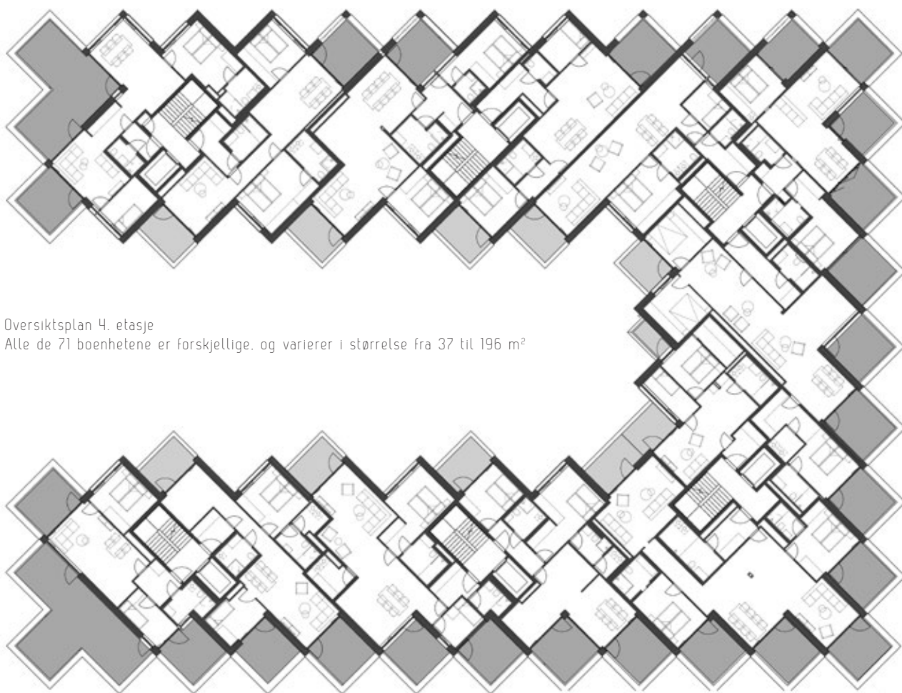
Oversiktsplan 4. etasje Alle de 71 boenhetene er forskjellige, og varierer i størrelse fra 37 til 196 m 2