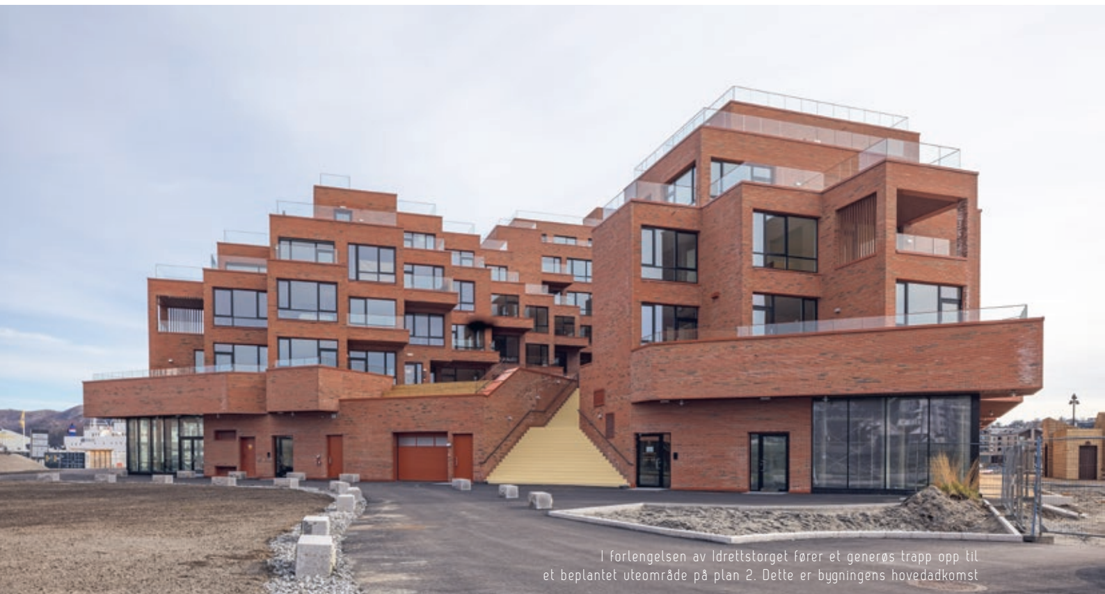
I forlengelsen av Idrettstorget fører et generøs trapp opp til et beplantet uteområde på plan 2. Dette er bygningens hovedadkomst