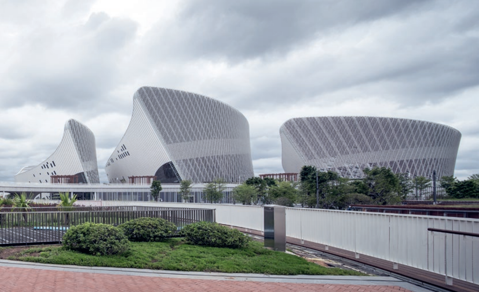
De linseformede keramiske fasadelamellene relaterer seg til formen på bygningskroppene

De fem jasminblomstene – multifunksjonelt teater, opera, konserthus, kunstmuseum og kinosenter – er forbundet med en kulturhall og en stor takterrasse. Takterrassen er tilgjengelig via to ramper fra Jasmine Gardens og fra Central Jasmine Plaza, noe som gir en direkte forbindelse mellom komplekset og bredden av elven Minjiang. På underetasjennivå er det anlagt en promenade langs Liangcuo-elven som forbinder landskapet med interiøret, og som også forbinder kultursenteret med metrostasjonen.