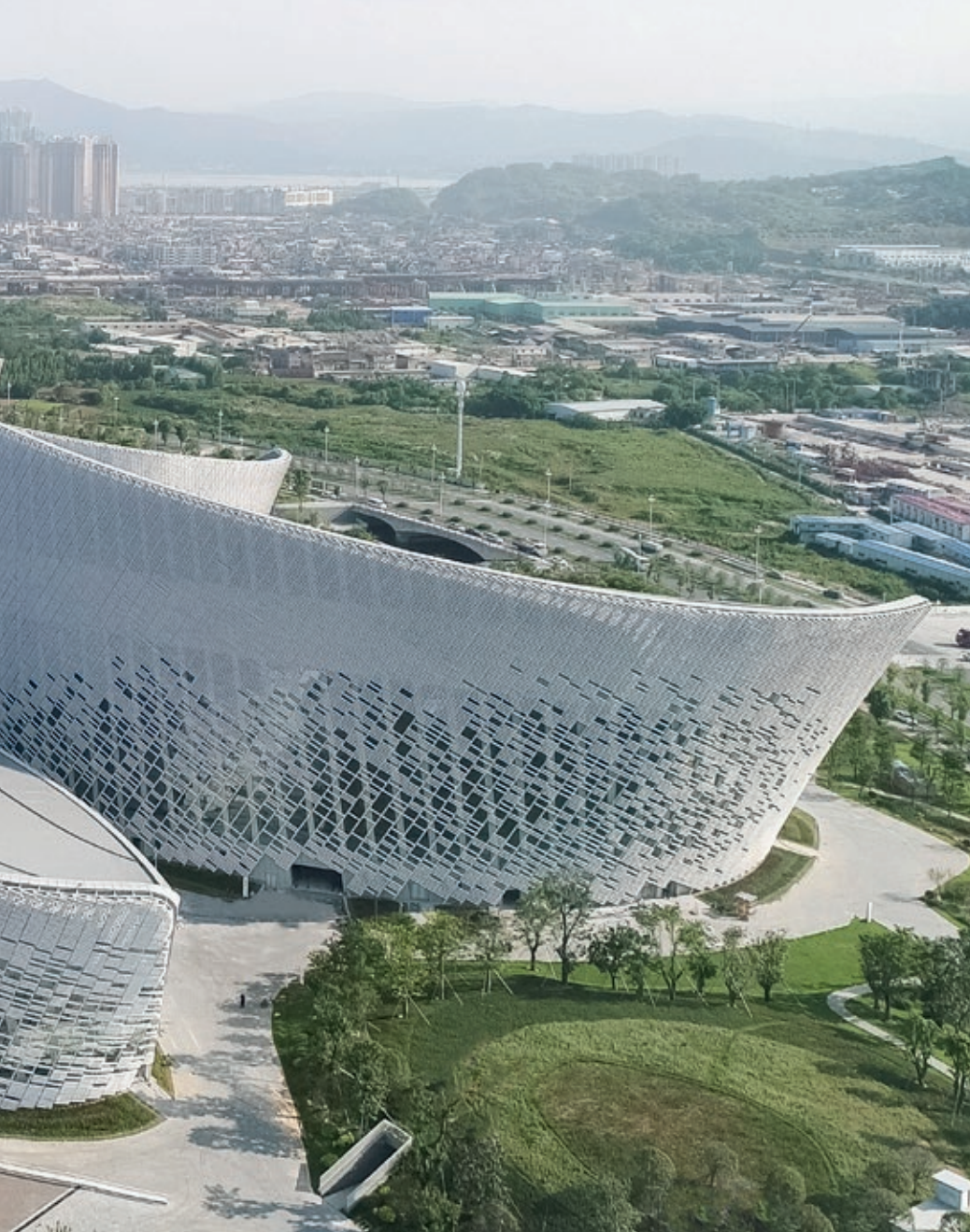
Sett fra nordvest, med Kuipubroen i bakgrunnen