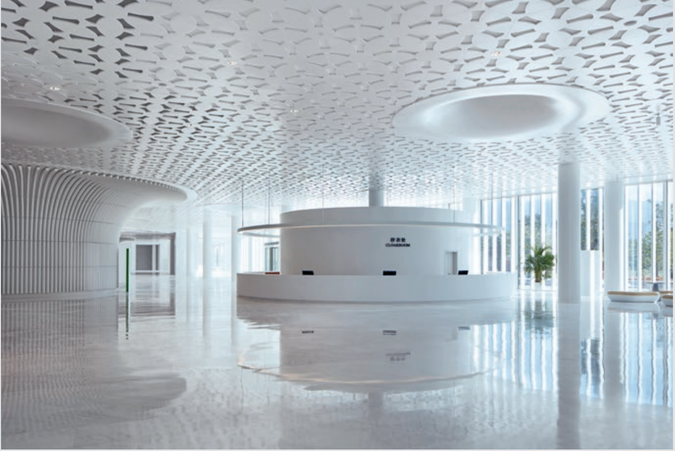
Teater, opera og konserthus har felles foaje