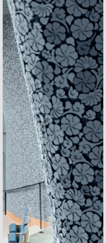
Keramiske paneler med relieff i konsertsalen (til venstre) og med 'blomster' i operaen (høyre) gir en rundere, varmere lyd