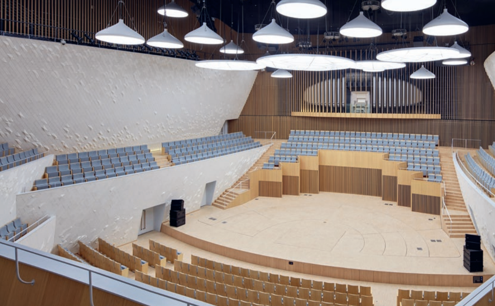
To typer akustiske keramiske paneler: Konsertsalen har mangefasetterte geometriske fliser, mens ornamentale, 8 mm tykke keramiske blomsterfliser i varme gråtoner danser over buede former i operahuset