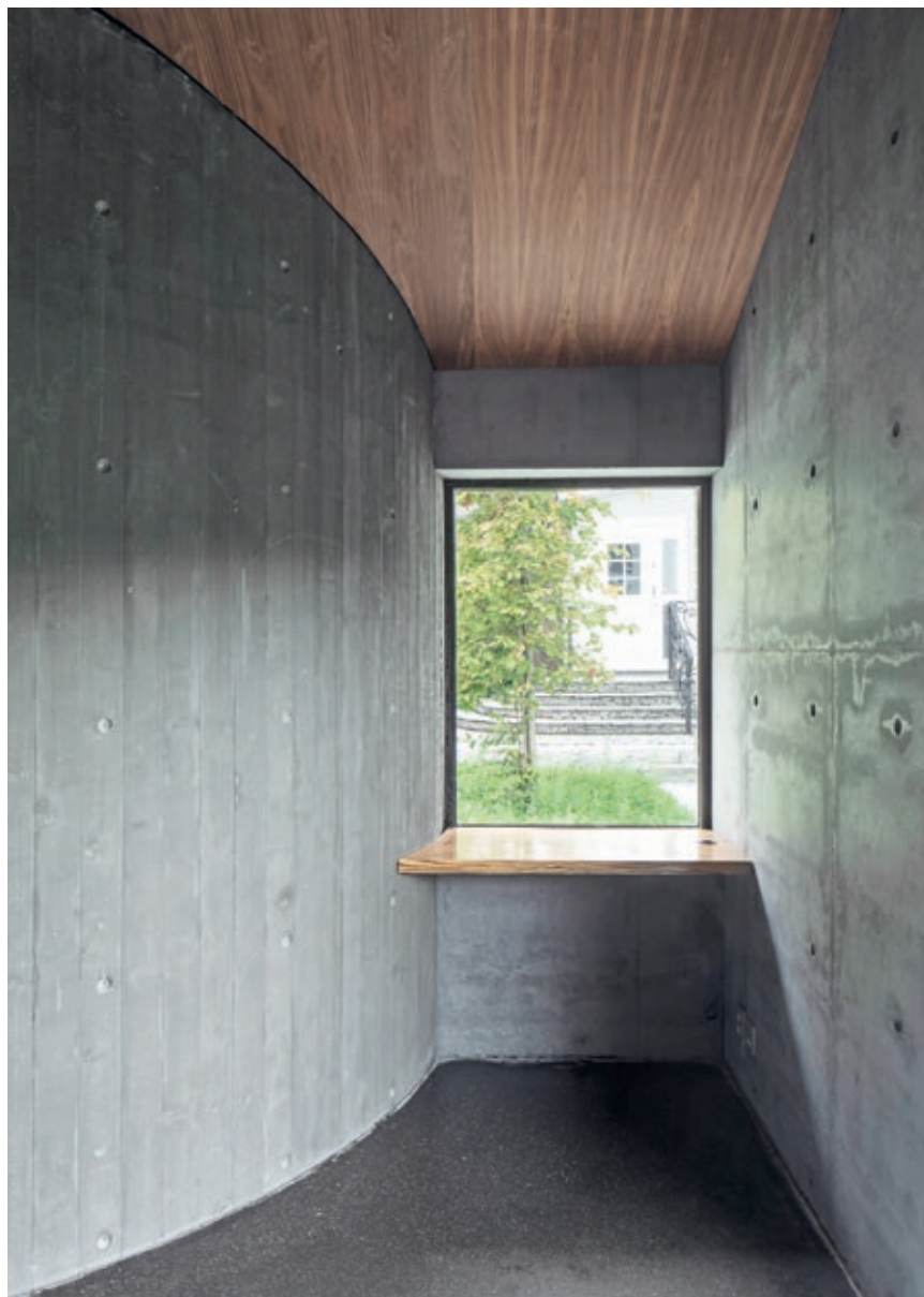
Murt yttervange. plasstøpt innervange. Gulvet er i slipt og polert svart betong

skrivestuen fire meter. Avstanden til hovedhuset ble diktert av brannforskriftene. Hver bygning har to åpninger og en tydelig forskjell på inn- og utside. Ytterveggene har to vanger: innervangen er i plasstøpt, slipt og polert svart betong som avslører det fargerike tilslaget, mens yttervengene er murt i lys teglstein med dype skyggefuger.