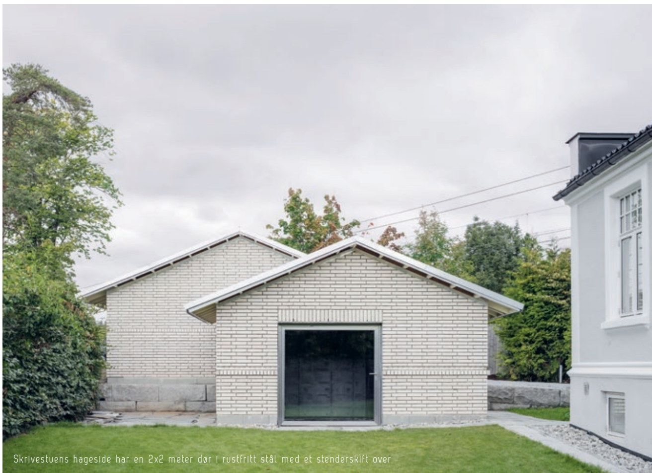
Skrivestuens hageside har en 2x2 meter dør i rustfritt stål med et stenderskift over