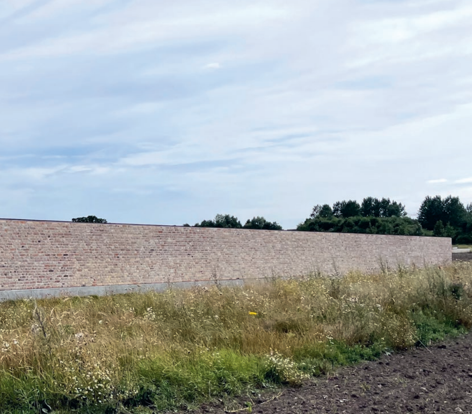
'Hage' sett fra nord