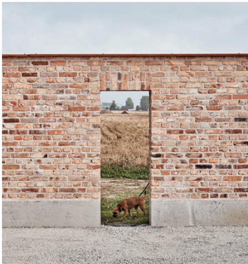
På tre sider er hagen beskyttet av en vegg murt av 48.000 gjenbrukstegl