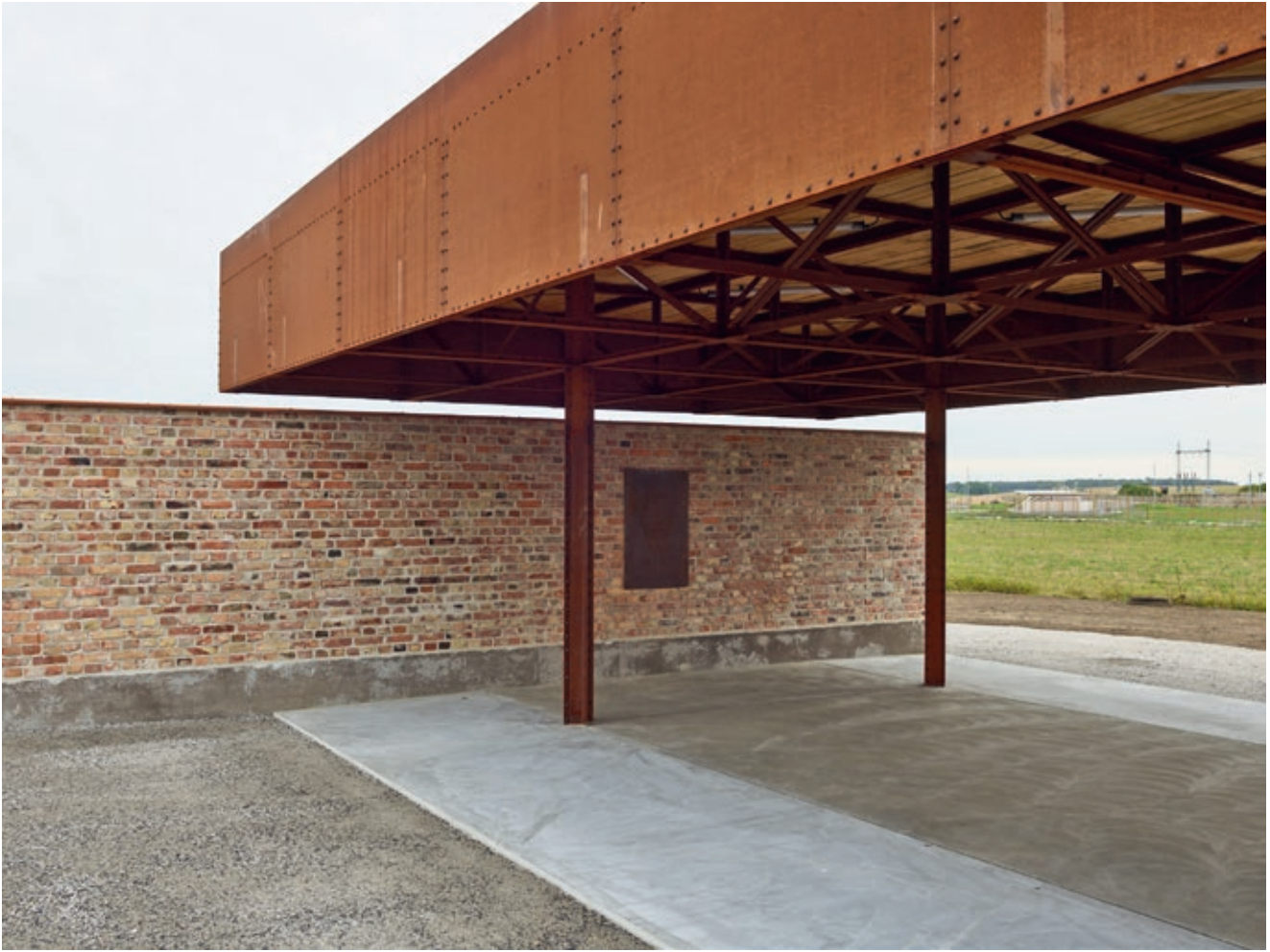
Sammen med et lokalt produksjonsfirma utviklet rådgivende ingeniør et enkelt konstruksjonssystem for baldakinen