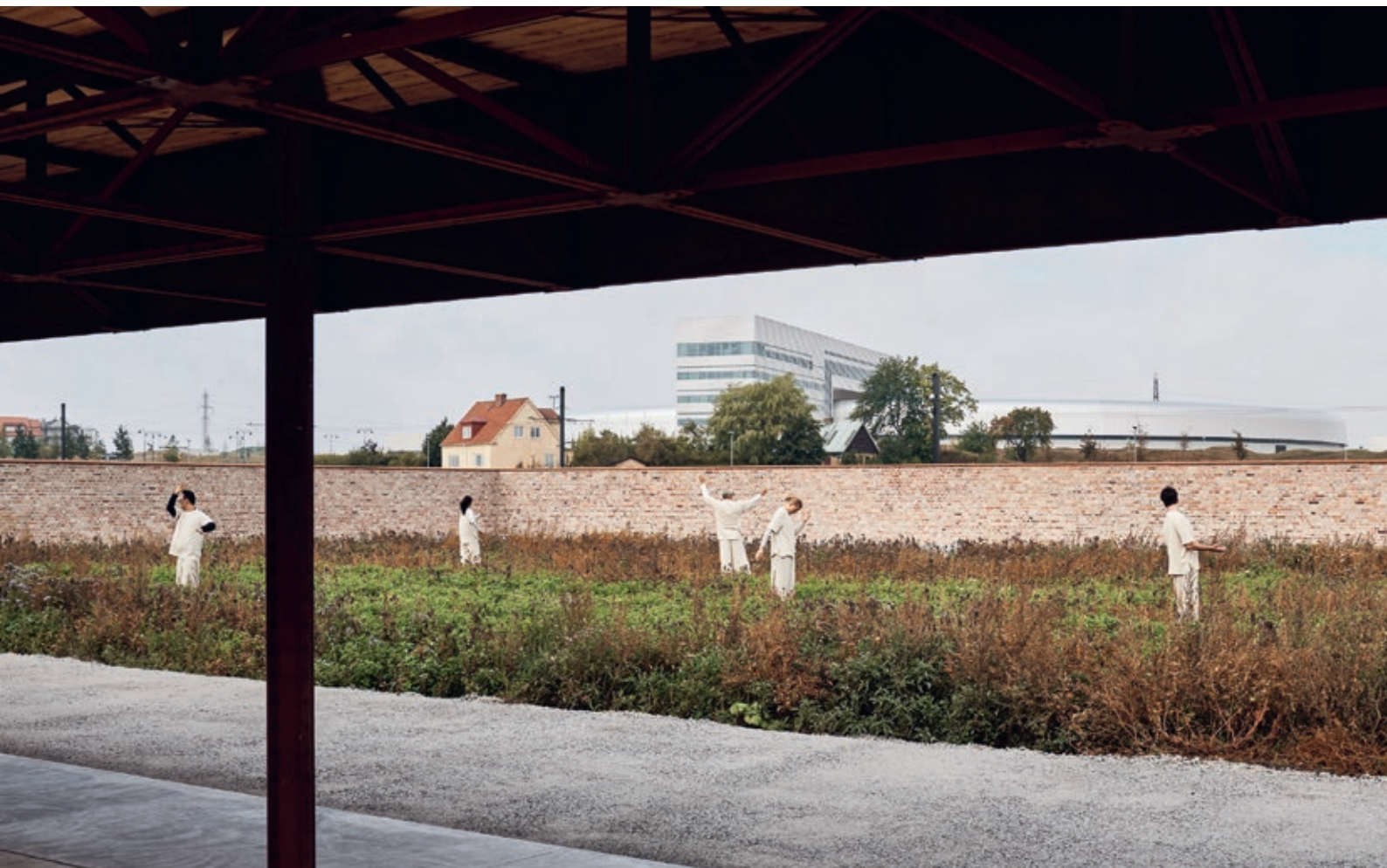
Et meditativt, vakkert byrom med hage i hjertet av et nytt, urbant nabolag