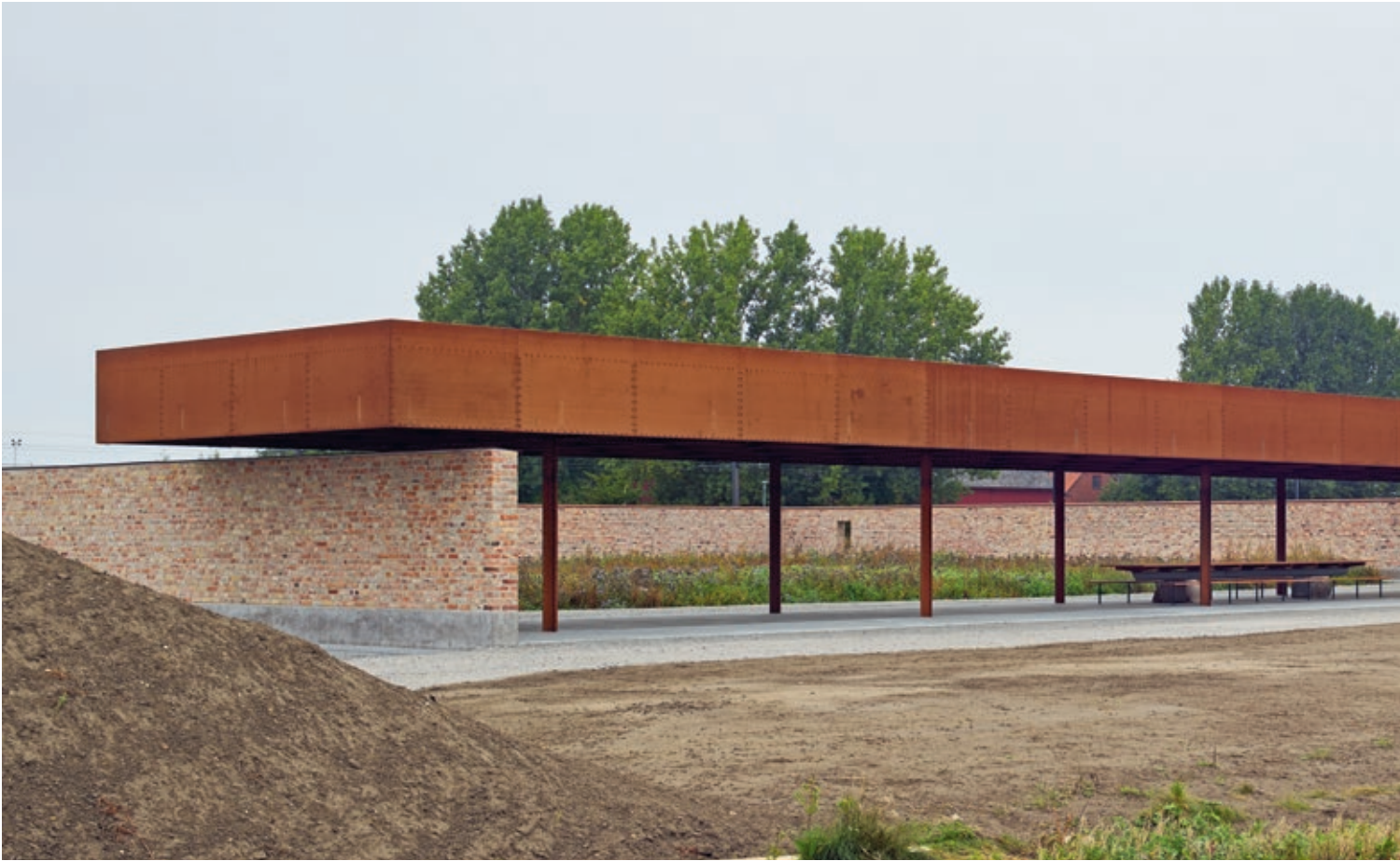
Den åpne siden av innhegningen vender mot sydøst og er beskyttet av en 43,2 x 7,2 meter stor baldakin i cortenstål Under baldakinen står et langt trebord med to benker