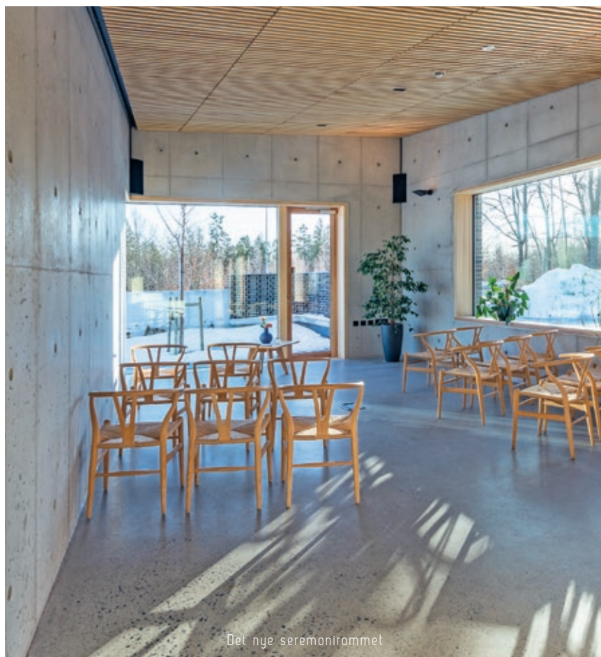
Det nye seremonirommet

Tilbygget inneholder et lite seremonirom for utlevering av urner. Dette rommet skal også benyttes til minnesamvær for pårørende under og etter kremasjon. Den nye delen inneholder også støtte-