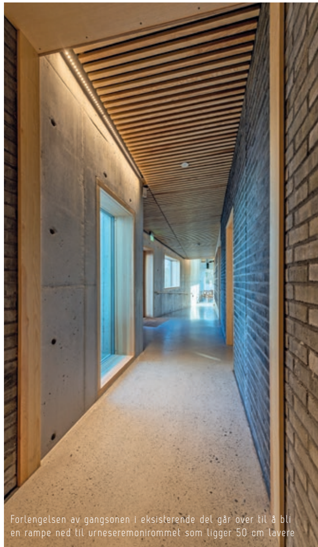
Forlengelsen av gangsonen i eksisterende del går over til å bli en rampe ned til urneseremonirommet som ligger 50 cm lavere