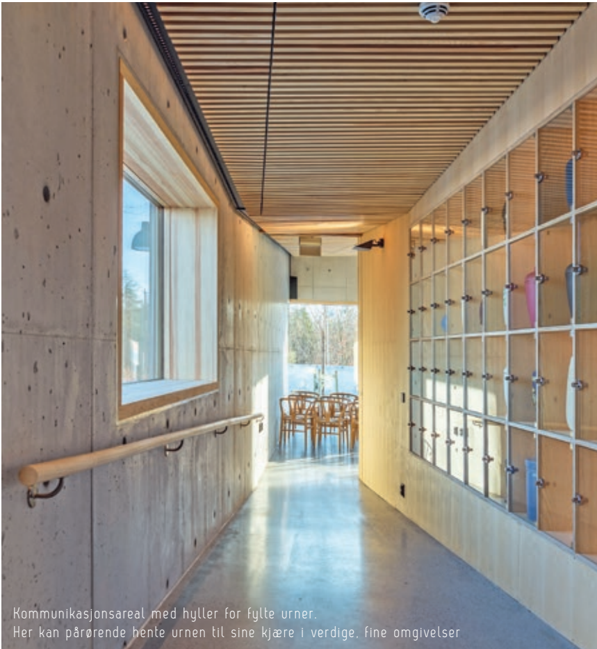
Kommunikasjonsareal med hyller for fylte urner. Her kan pårørende hente urnen til sine kjære i verdige, fine omgivelser