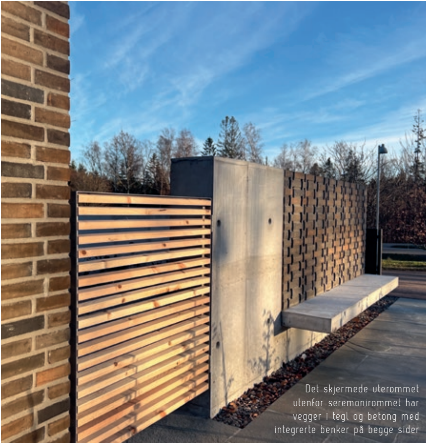
Det skjermede uterommet utenfor seremonirommet har vegger i tegl og betong med integrerte benker på begge sider