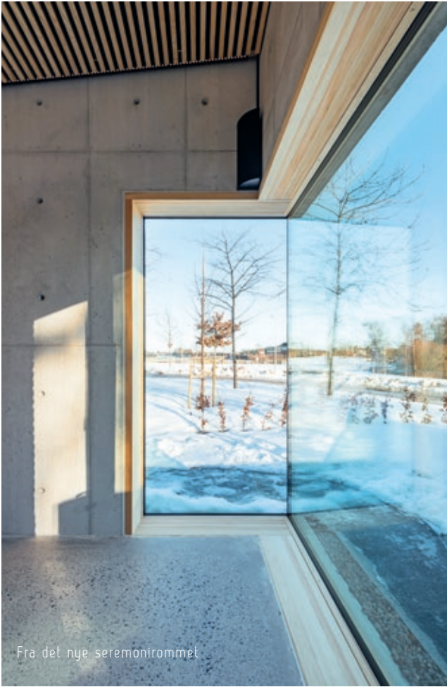
Fra det nye seremonirommet