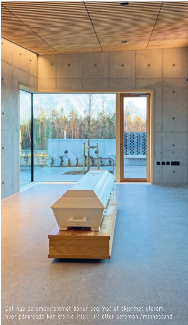
Det nye seremonirommet åpner seg mot et skjermet uterom hvor pårørende kan trekke frisk luft etter seremoni/minnestund