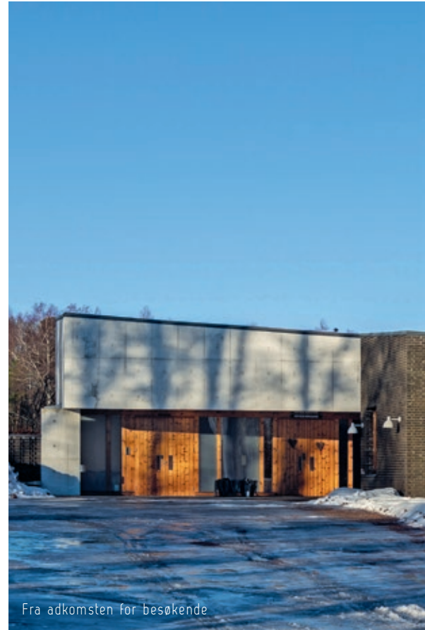
Fra adkomsten for besøkende