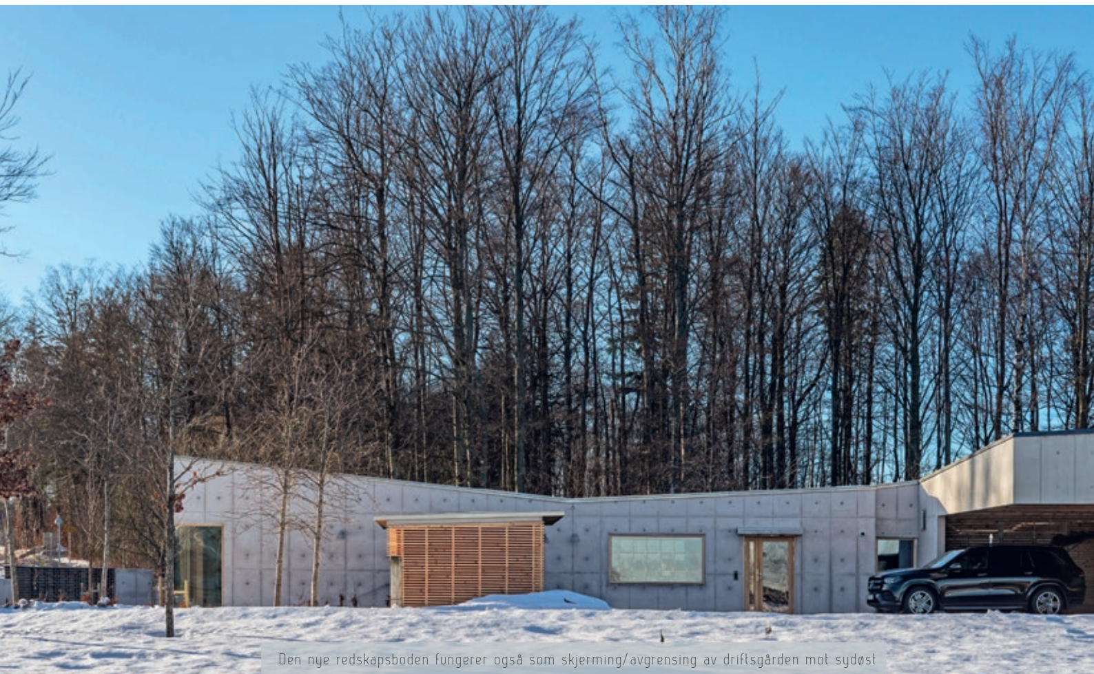
Den nye redskapsboden fungerer også som skjerming/avgrensning av driftsgården mot sydøst