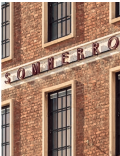
LPO arkitekter. Ill.: LPO arkitekter

Sommerrokvartalet består av to bevaringsverdige bygninger: Sommerrogaten 1 og Inkognitogaten 37. Disse er transformert til et nytt hotell med kulturfunksjoner. I tillegg rommer anlegget 56 nye leiligheter med felles takterrasser, godt skjermet bak hotellet.