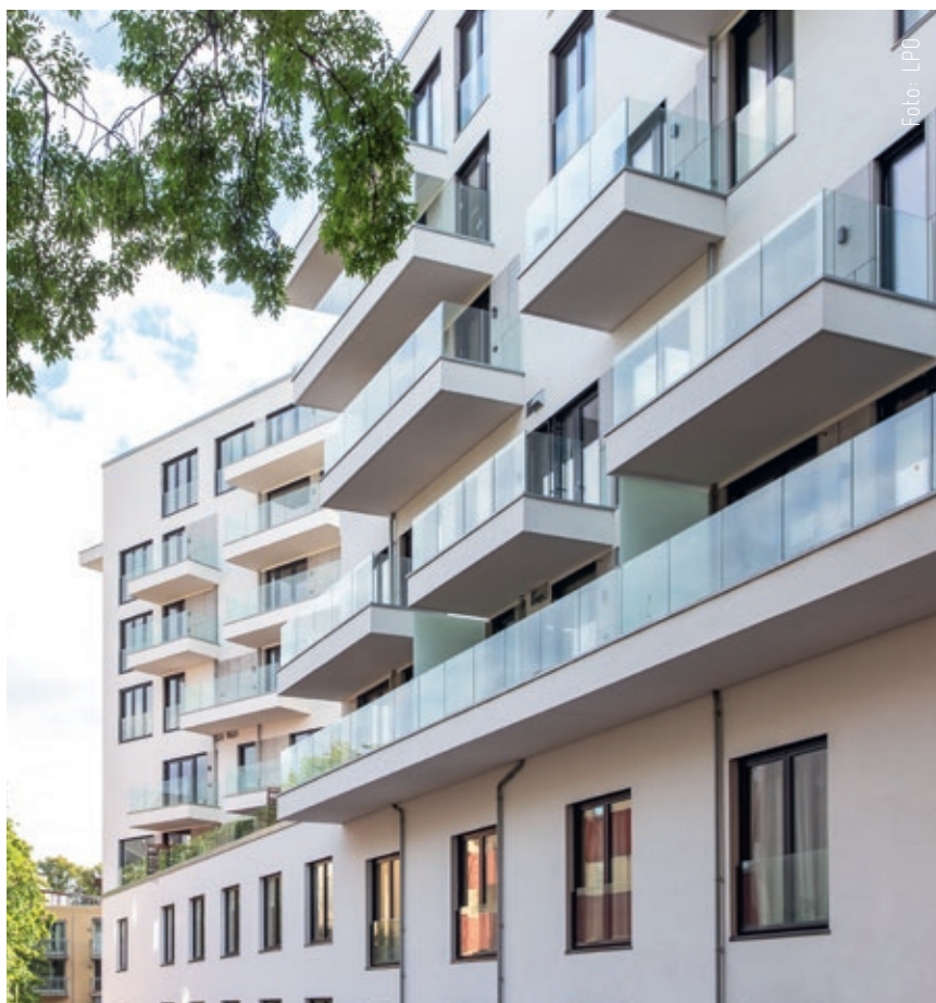
Fasade mot Sommerparken