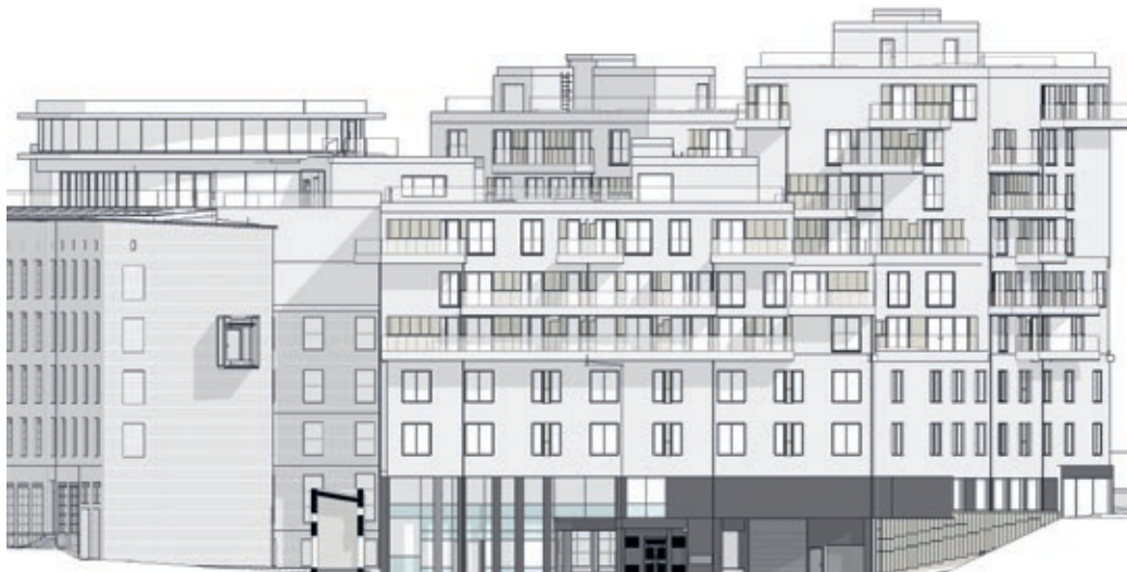
Fasade mot Inkognitogaten