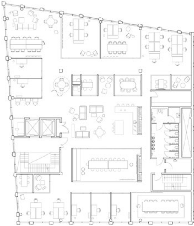
Plan 2. etasje