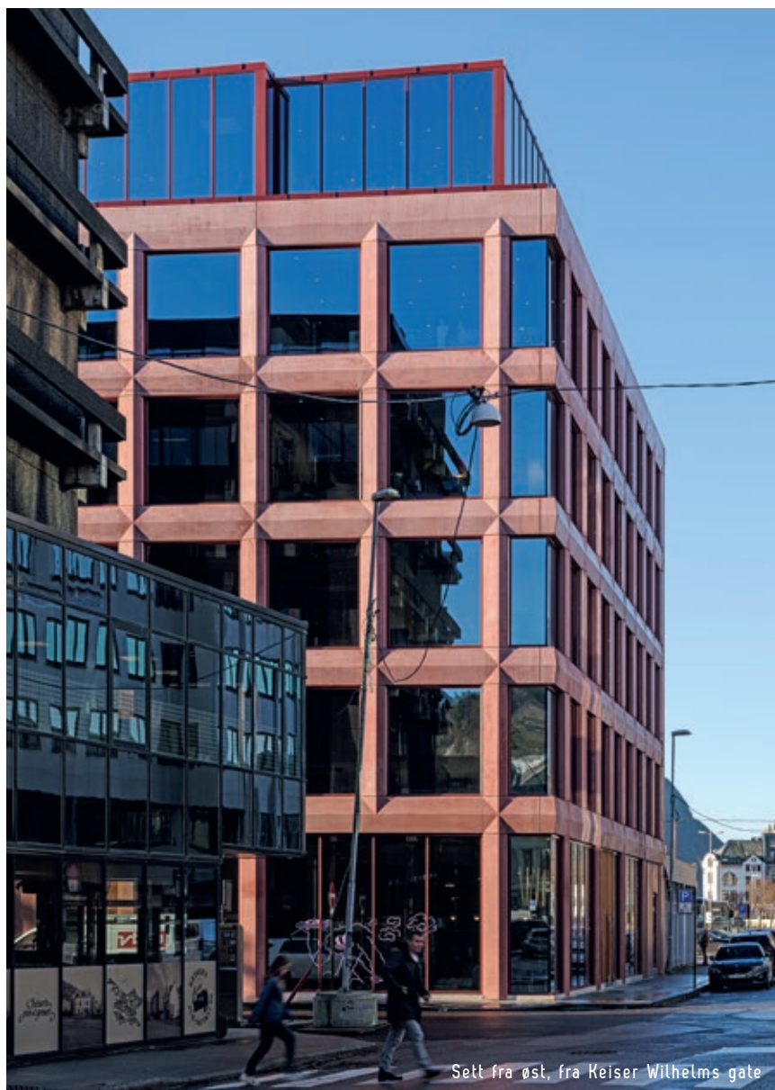
Sett fra øst, fra Keiser Wilhelms gate

len. Ålesunds fargepalett er livlig, og vi ønsket å reflektere dette i utformingen. Ålesundsregionen er også kjent for sin natur, og vi vektla at huset skulle gi en spektakulær opplevelse av området rundt.