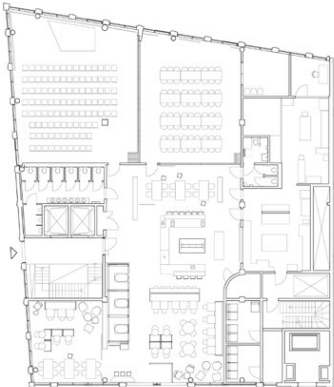
Plan 1. etasje