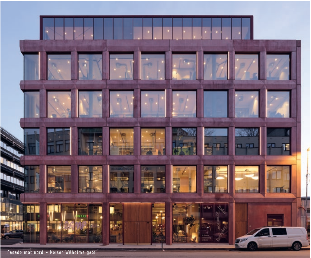
Fasade mot nord - Keiser Wilhelms gate