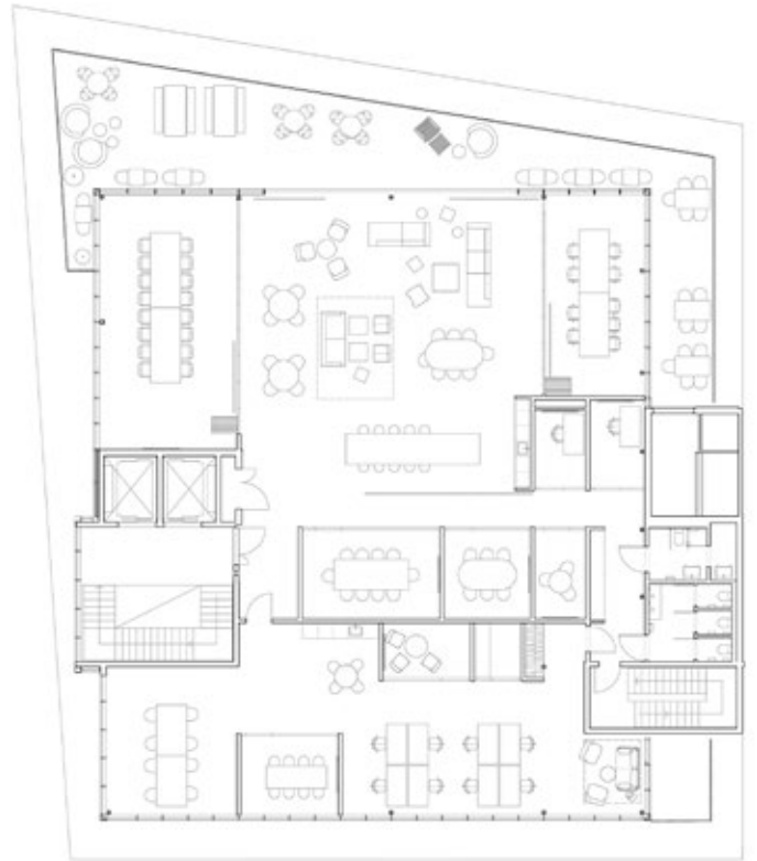
Plan 6. etasje