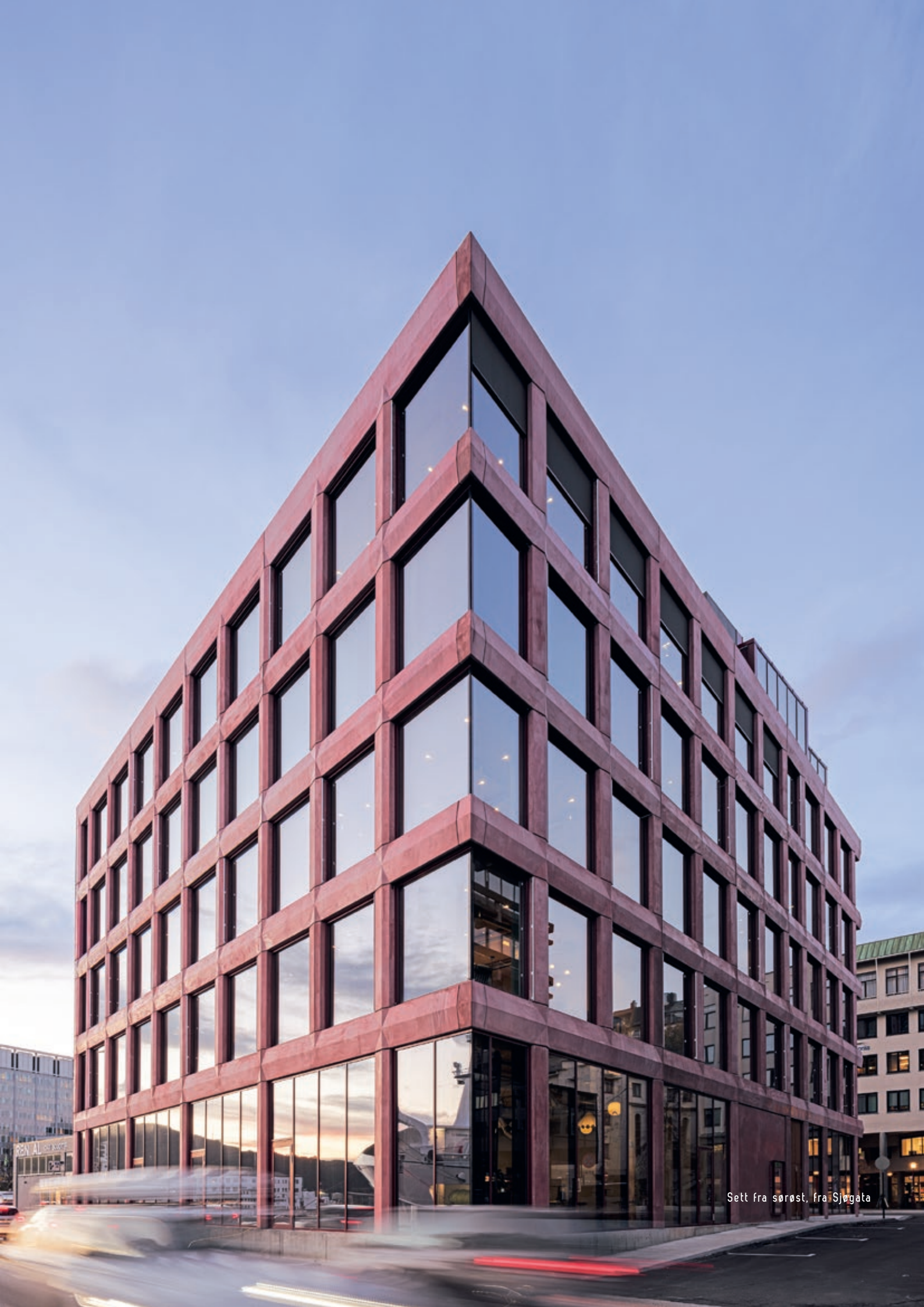
Sett fra sørøst, fra Sjøgata