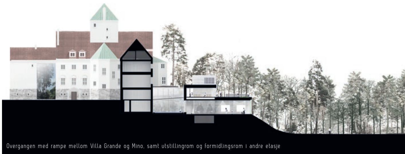
Overgangen med rampe mellom Villa Grande og Mino, samt utstillingrom og formidlingsrom i andre etasje