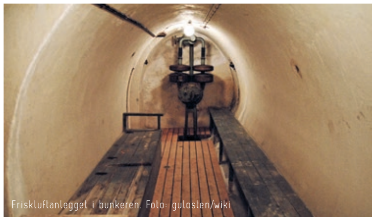
Friskluftenlegget i bunkeren.