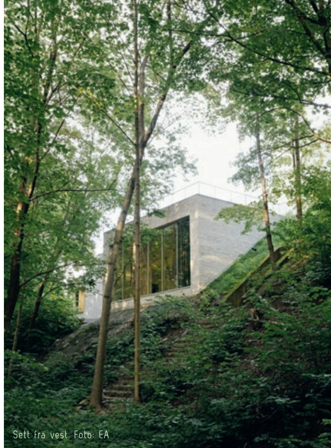
Sett fra vest.