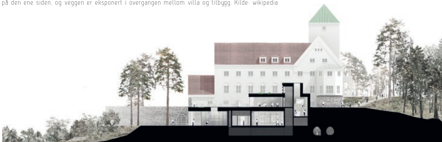
Trapp med overlys og overlys fra taket ned i utstillingsfunksjonene

Quisling fikk bygget en førerbunker under Villa Grande som sto ferdig i 1943. Den ligger under en 4 meter tykk betongkappe og har 2.4 meter tykke betongvegger. De 67 kvadratmetrene inneholder bl.a. kommandosentral med telefon, sykestue, matlager og toalett, samt kjøle- og friskluftenlegg. Den har inngang fra kjelleren og en 'hemmelig' nødutgang på baksiden, mot hagen. Bunkeren er tidligere restaurert og åpnet for publikum. Det er nå skåret vekk mange tonn betong på den ene siden, og veggen er eksponert i overgangen mellom villa og tilbygg. Kilde: wikipedia