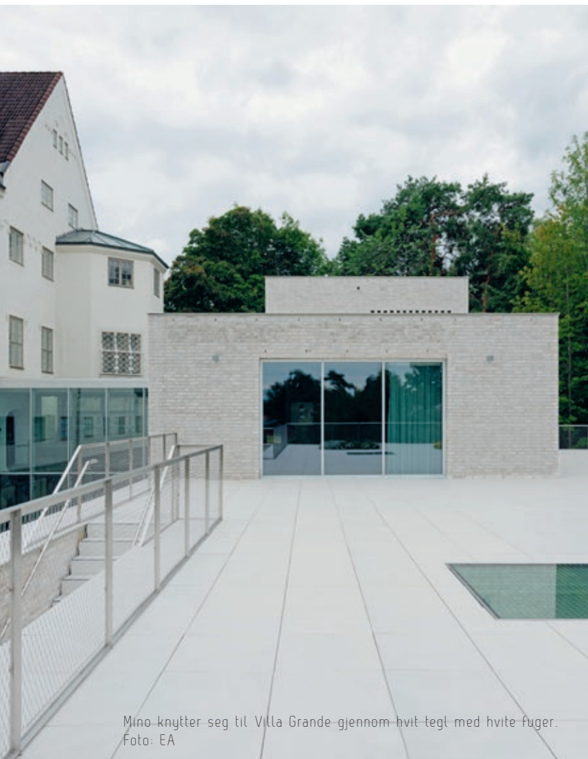
Mino knytter seg til Villa Grande gjennom hvit tegl med hvite fuger.