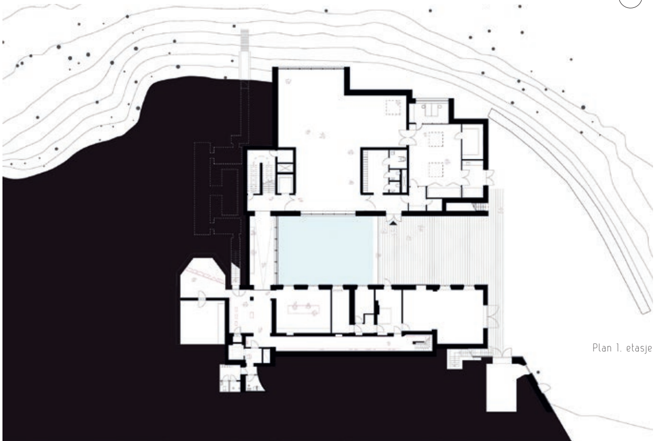
Plan 1. etasje