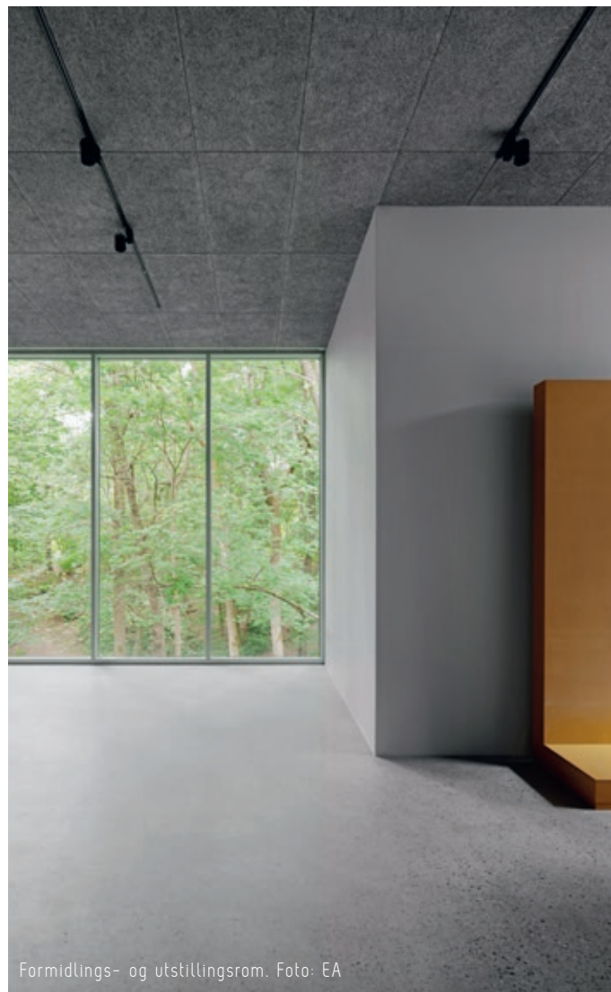
Formidlings- og utstillingsrom.