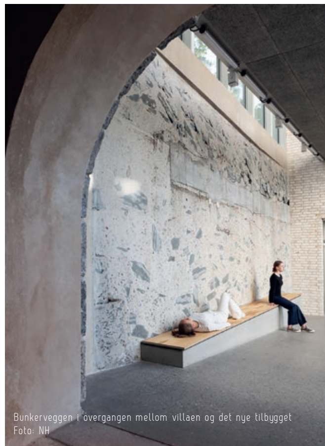
Bunkerveggen i overgangen mellom villaen og det nye tilbygget

Quisling fikk bygget en førerbunker under Villa Grande som sto ferdig i 1943. Den ligger under en 4 meter tykk betongkappe og har 2.4 meter tykke betongvegger. De 67 kvadratmetrene inneholder bl.a. kommandosentral med telefon, sykestue, matlager og toalett, samt kjøle- og friskluftenlegg. Den har inngang fra kjelleren og en 'hemmelig' nødutgang på baksiden, mot hagen. Bunkeren er tidligere restaurert og åpnet for publikum. Det er nå skåret vekk mange tonn betong på den ene siden, og veggen er eksponert i overgangen mellom villa og tilbygg. Kilde: wikipedia