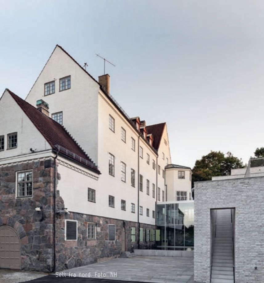
Sett fra nord.