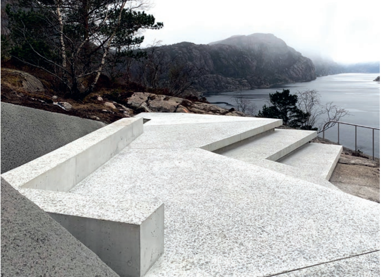
Benk og sittetrinn i grovslipt betong – med utsikt inn mot Lysefjorden