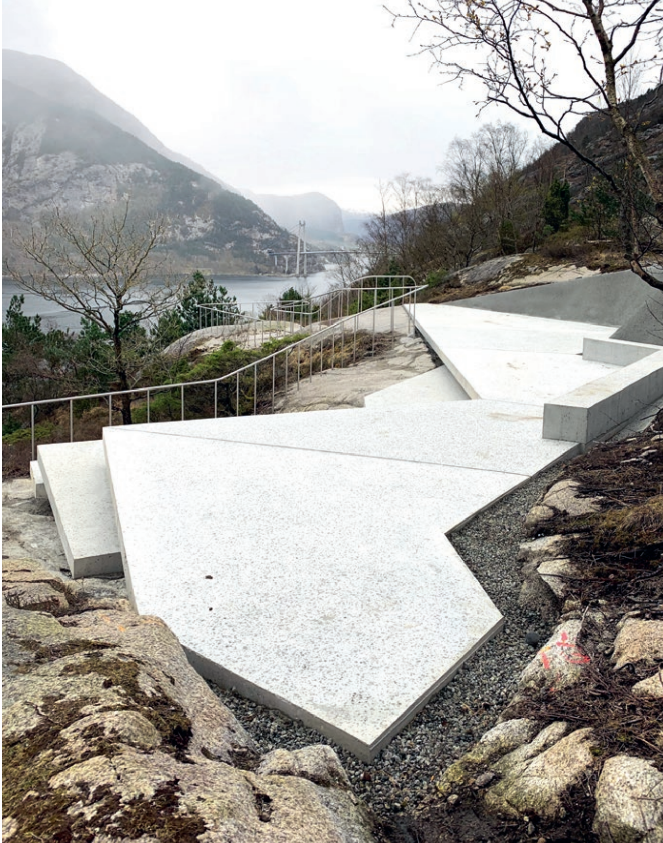
Utsikt ut av Lysefjorden mot Forsand

er stramme flater som er felt inn i landskapet og som også tilgjengelig-gjør svabergene som ligger her, høyt hevet over vannet. En plasstøpt benk og store trinn er etablert for å sitte på. Ut i landskapet svinger det seg en håndløper i syrefast stål, som en kombinert hjelp og avgrensning for de som kan ta seg litt