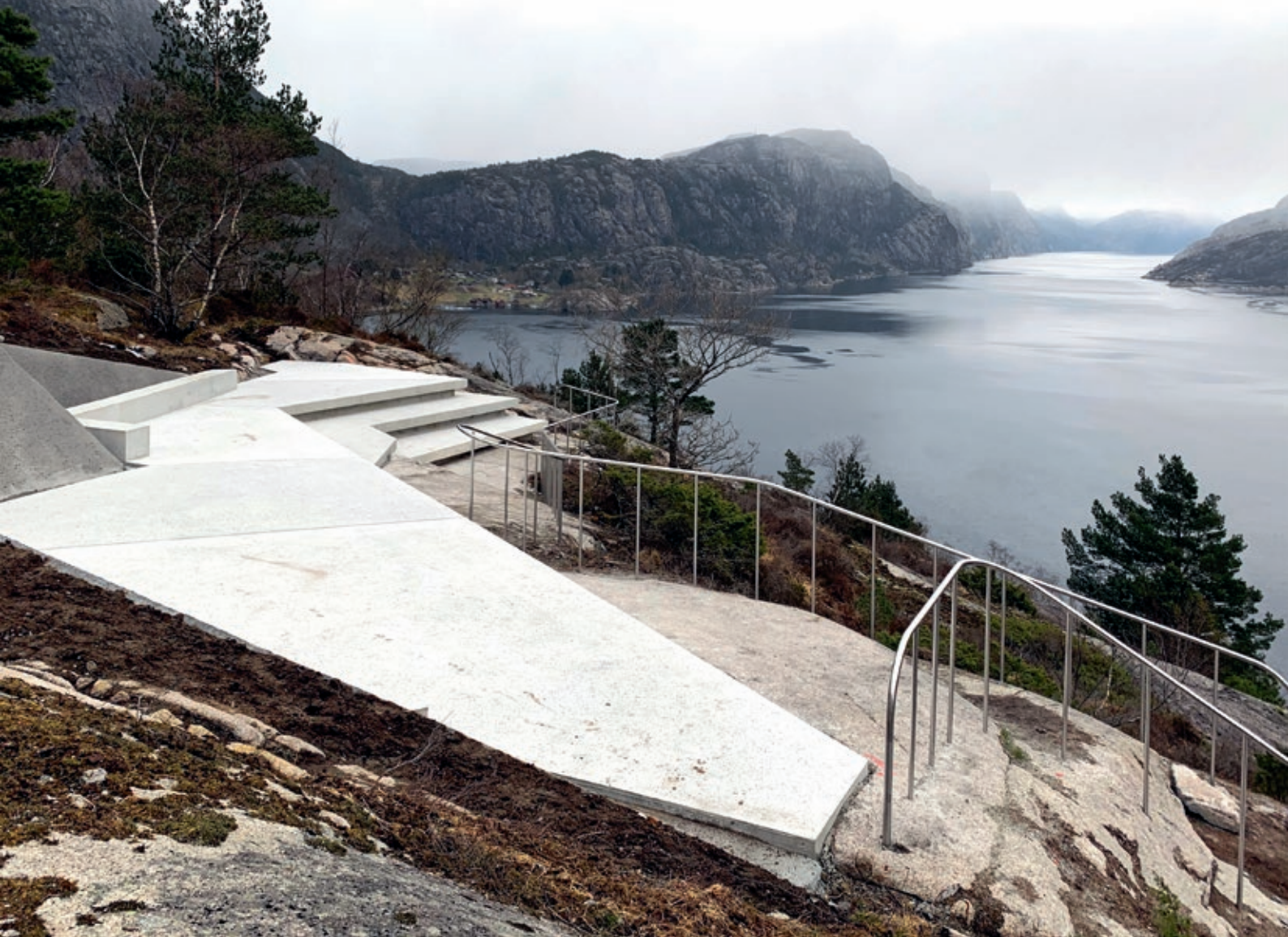
Det lyse betongdekket med lokalt tilslag er innfelt i fjellet

Parkeringsplassene er lagt i en sømboret lomme inn i fjellrabben som skiller veien fra utsikten. Utsiktspunktet synes ikke fra parkeringsplassen, og man ankommer via en skjæring igjennom fjellet. Tanken var at utsikten først er skjult. Skjæringen har triangulerte sider i en origamigeometri og åpner seg når man beveger seg gjennom den, til