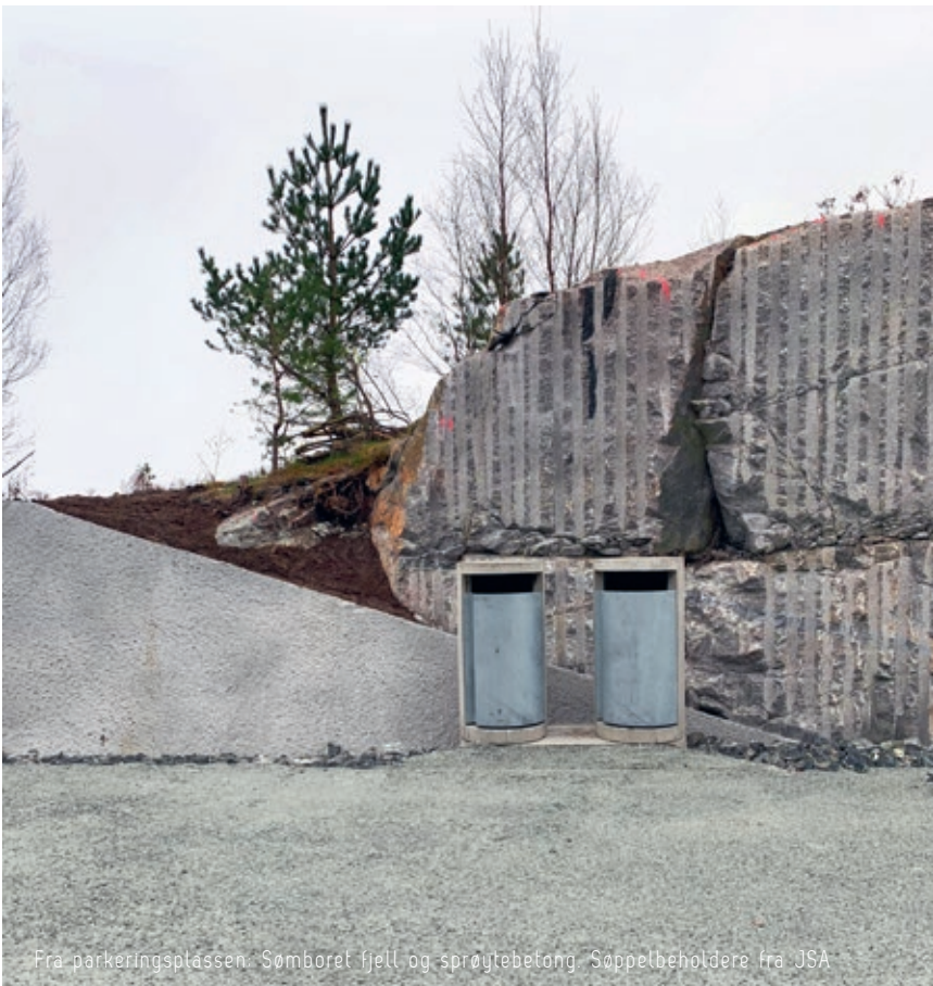
Fra parkeringsplassen: Sømboret fjell og sprøytebetong. Søppelbeholdere fra JSA

Utsiktspunktet Høllesli ligger mellom fergeteiet Oanes og broen til tettstedet Forsand, på vei opp mot utfartsstedet hvor man går til Preikestolen.