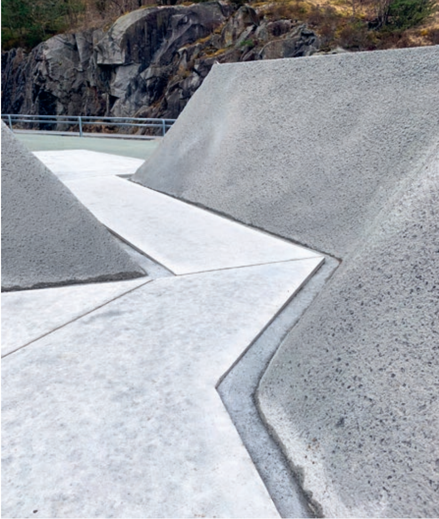
Sett mot veien: En skjæring i sprøytebetong forbinder parkeringsplassen med utsiktspunktet