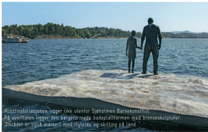
Kunstinstallasjonen ligger like utenfor Sjøholmen Barnekunsthús. På overflaten ligger den bølgeformede badeplattformen med bronseskulpturer. Området er også markert med flytetåu og skilting på land