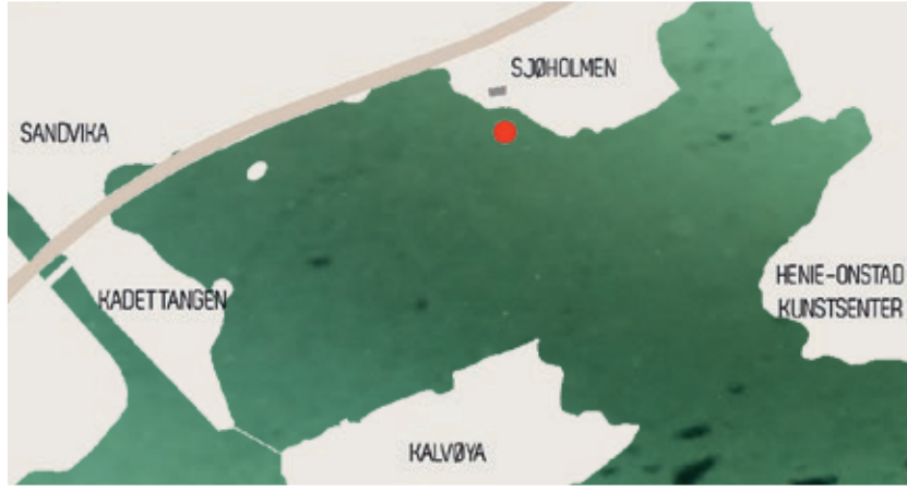
Nexus ligger utenfor Sjøholmen Barnekunsthús, mellom Høvikodden og Sandvika i Bærum