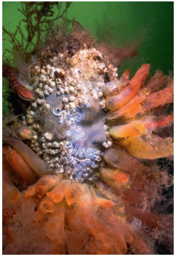
Tubeformet sjøpung, rur og andre 'filterspisere' lever av utfiltrert mikroplankton og bidrar dermed til å bedre vannkvaliteten

Skulpturene er festet til basen på sjøbunnen med en 'navlestreng' i rustfritt stål. De svever som i mors liv og minner oss om at livet på jorden begynte i havet, og at vi fortsatt er avhengige av havet for å overleve.