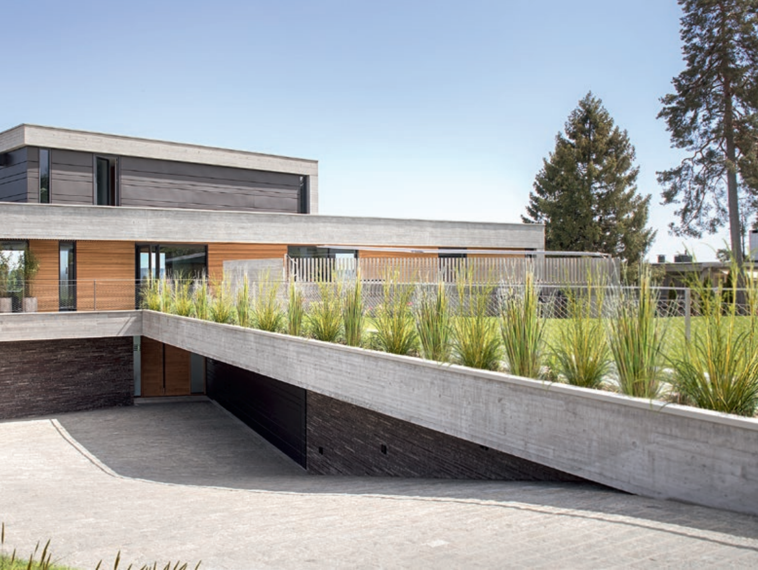
Fra vestsiden: Den nedsenkede garasjen skaper en naturlig adkomstsituasjon