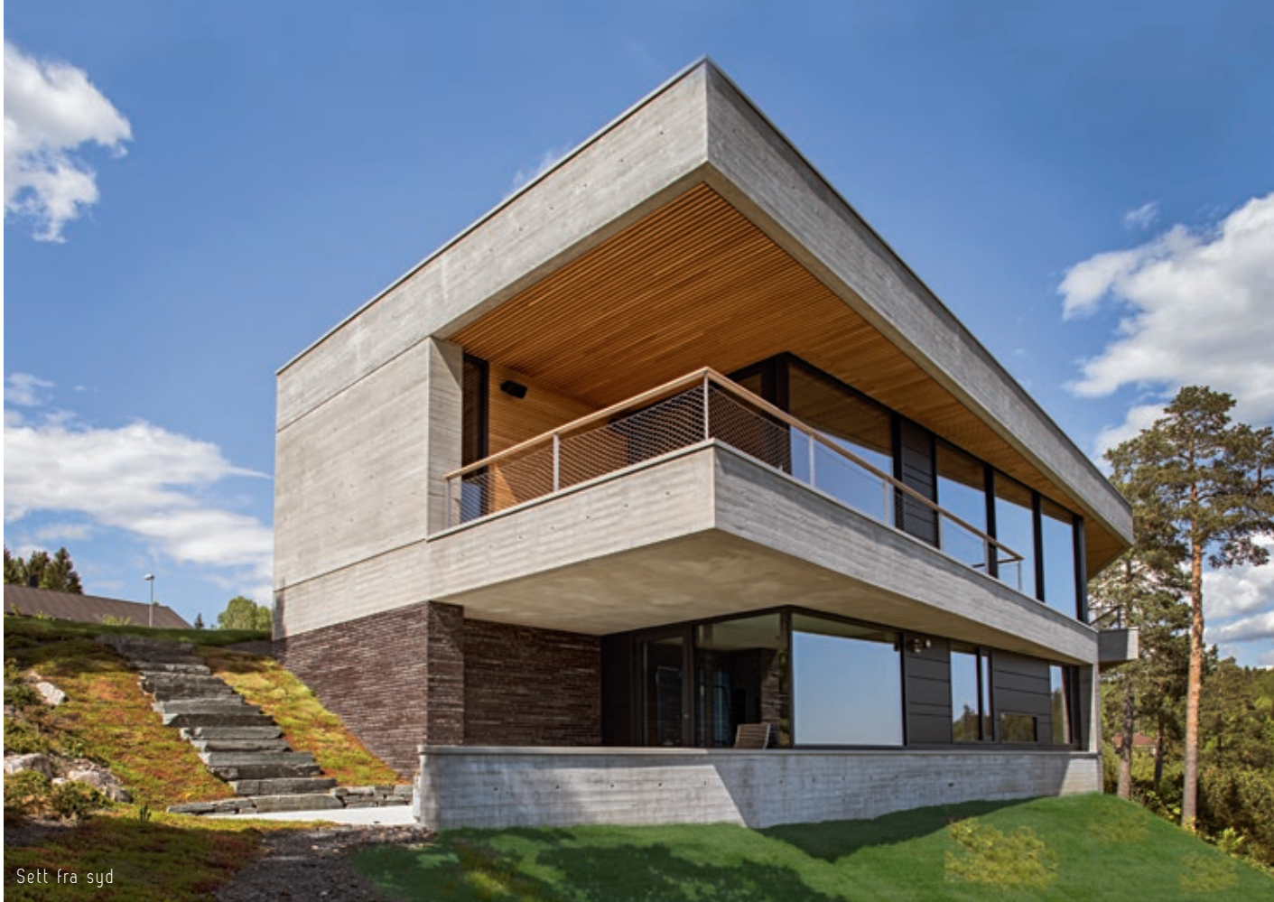
Sett fra syd