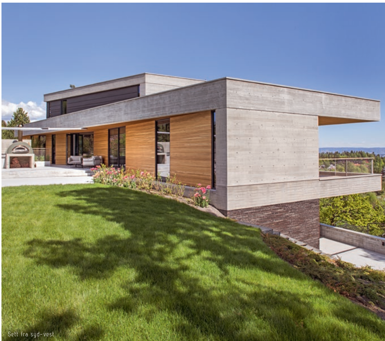
Sett fra syd-vest