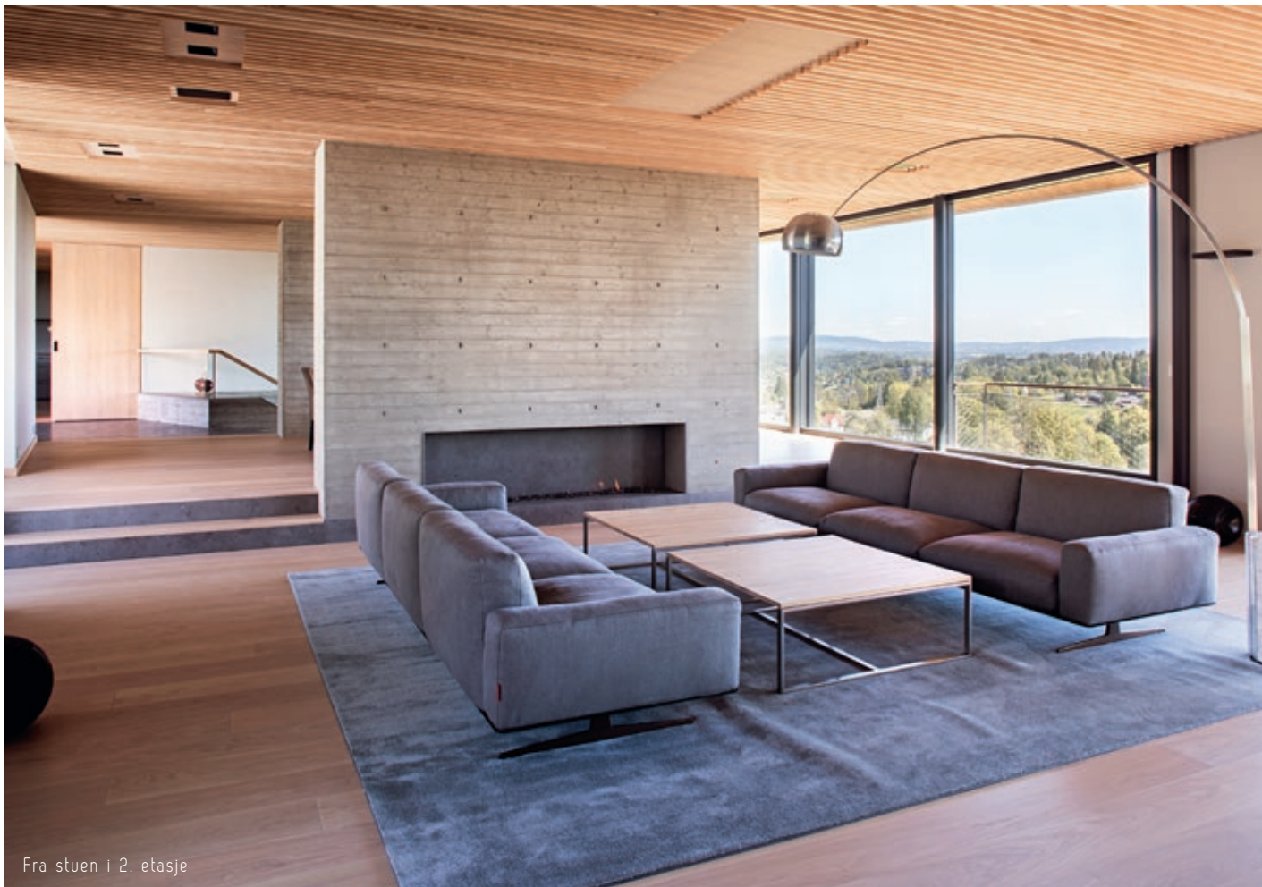
Fra stuen i 2. etasje