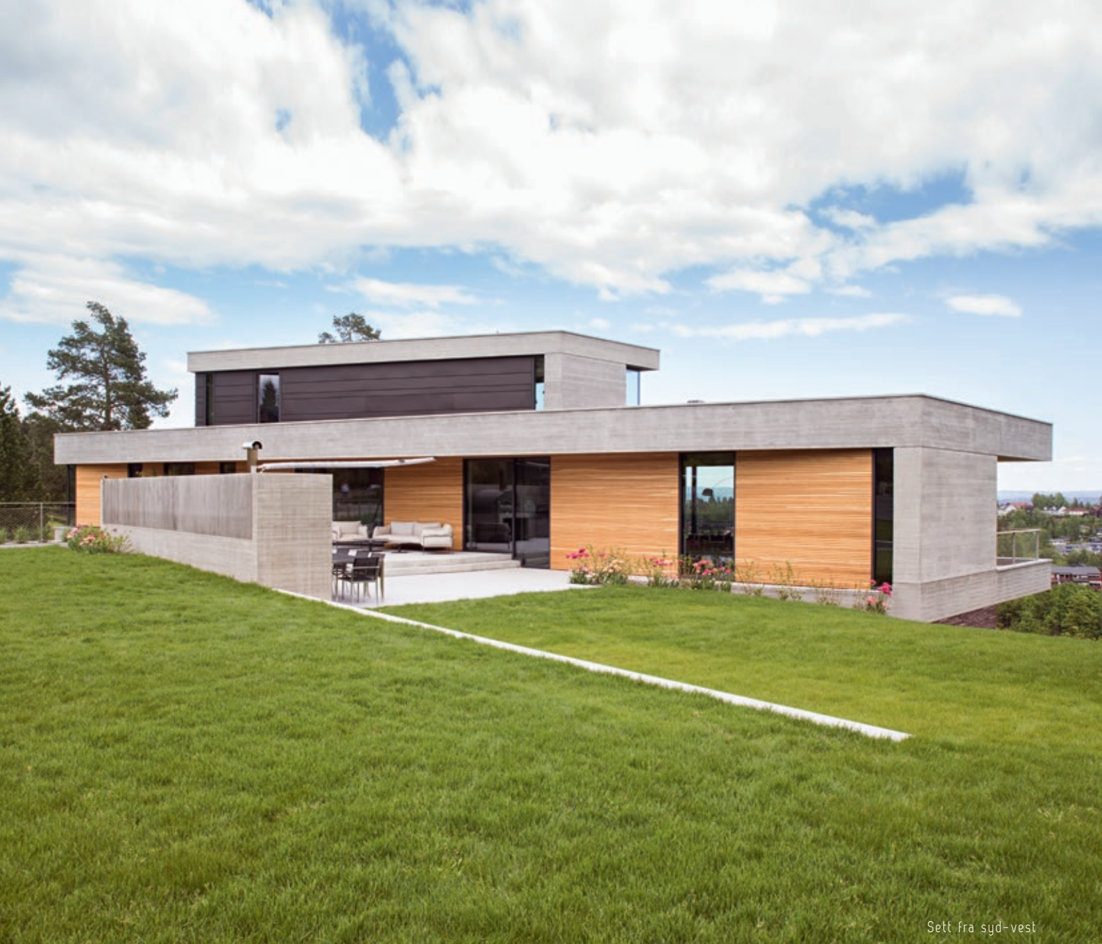
Sett fra syd-vest