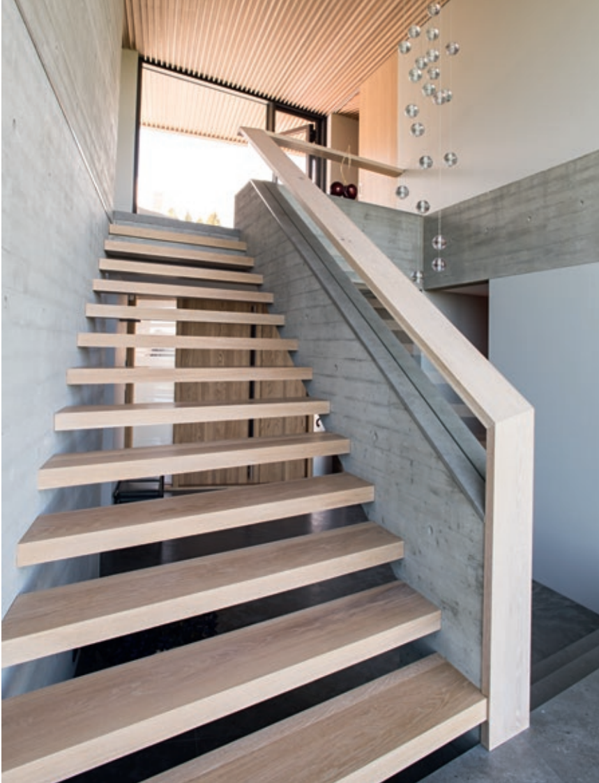
Trapp opp til suite i øverste etasje med stue, soverom, bad og garderobe