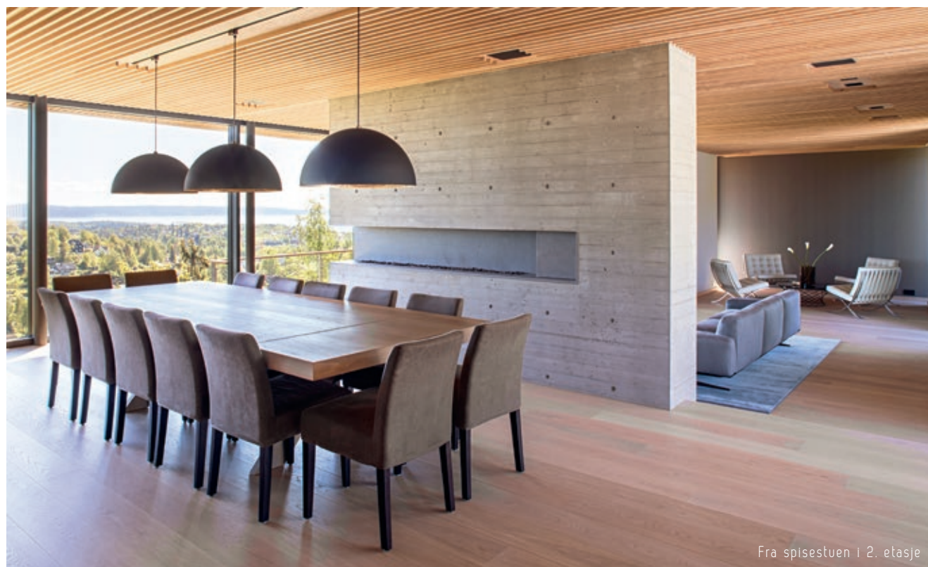
Fra spisestuen i 2. etasje