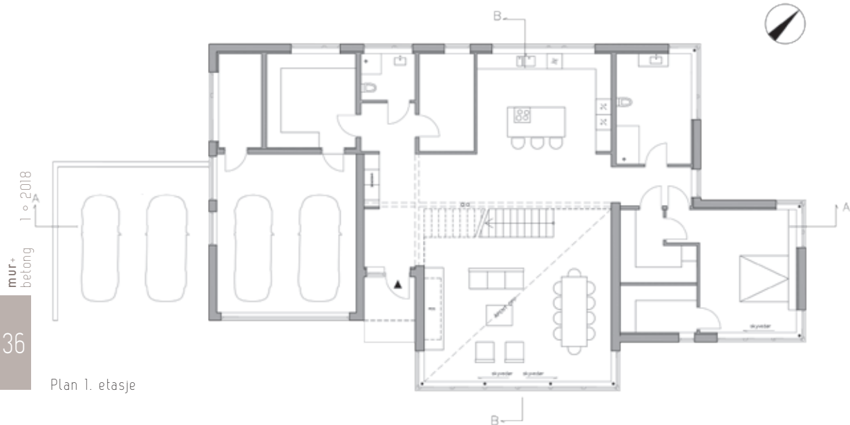
Plan 1. etasje