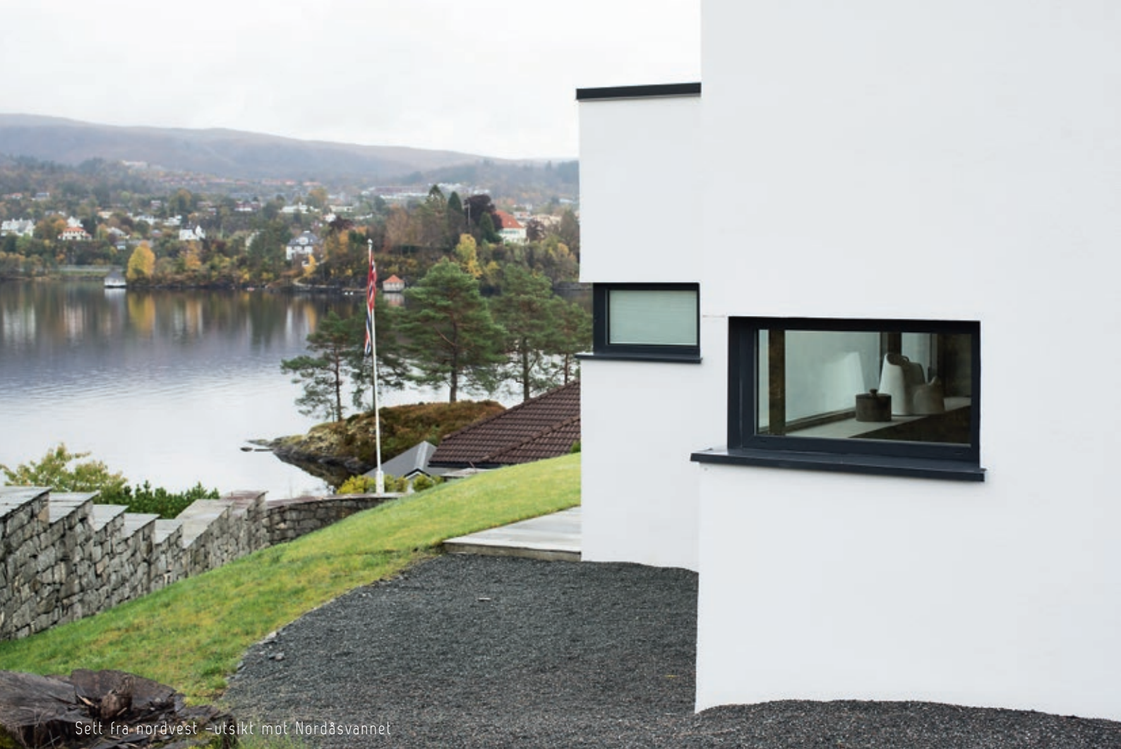
Sett fra nordvest – utsikt mot Nordåsvannet