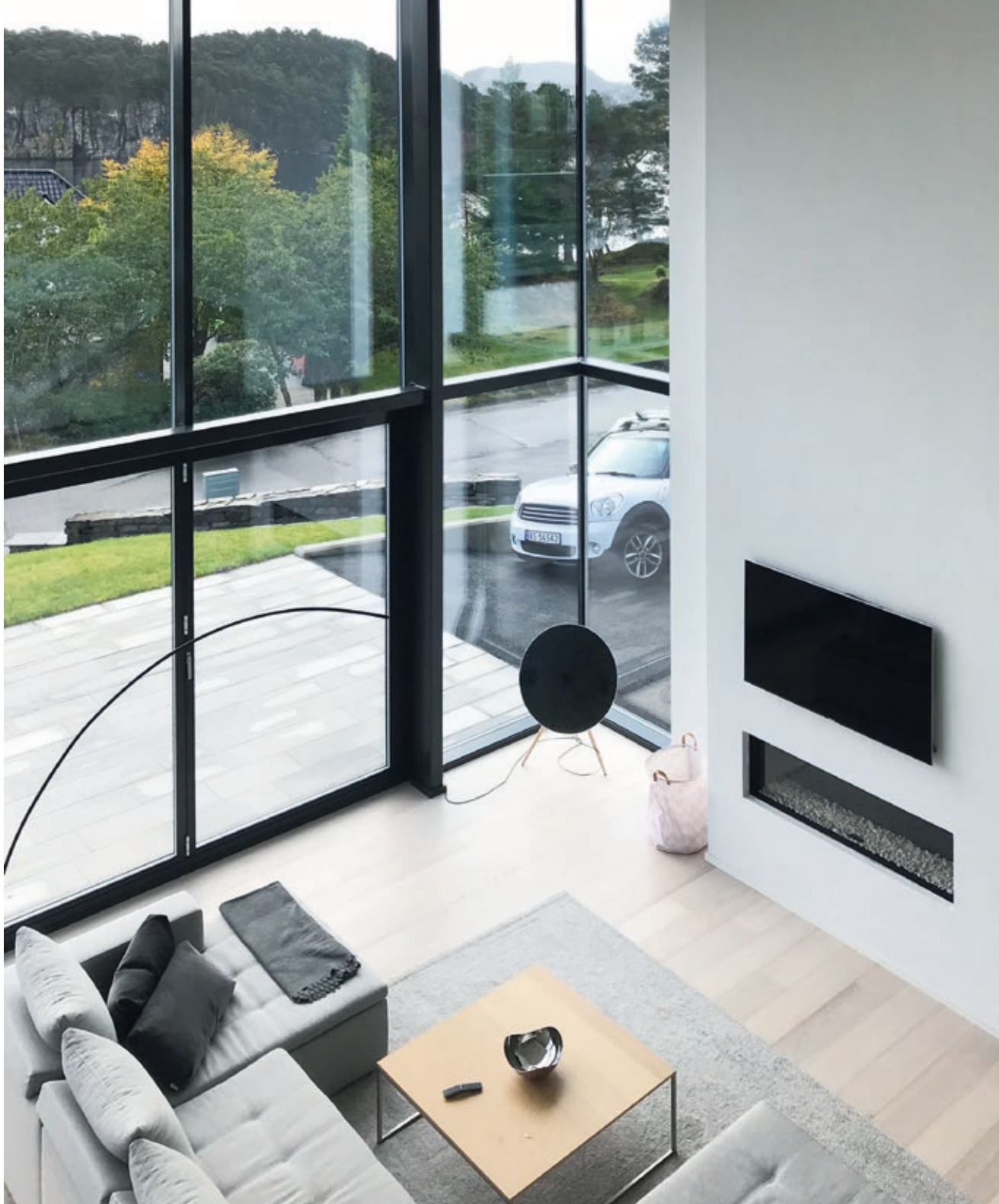
Hovedstuen i 1. etasje har dobbel takhøyde og store vindusflater mot sjø og utsikt

Intensjonen var at boligen skulle fremstå med et enkelt uttrykk. Den er høyreist mot sol og utsikt, men lukker seg mer i bakkant mot naboer og trafikk. Det store stueområdet med dobbel takhøyde ble tidlig et viktig grep for kunden. Øvrige funksjoner måtte forholde seg til dette.