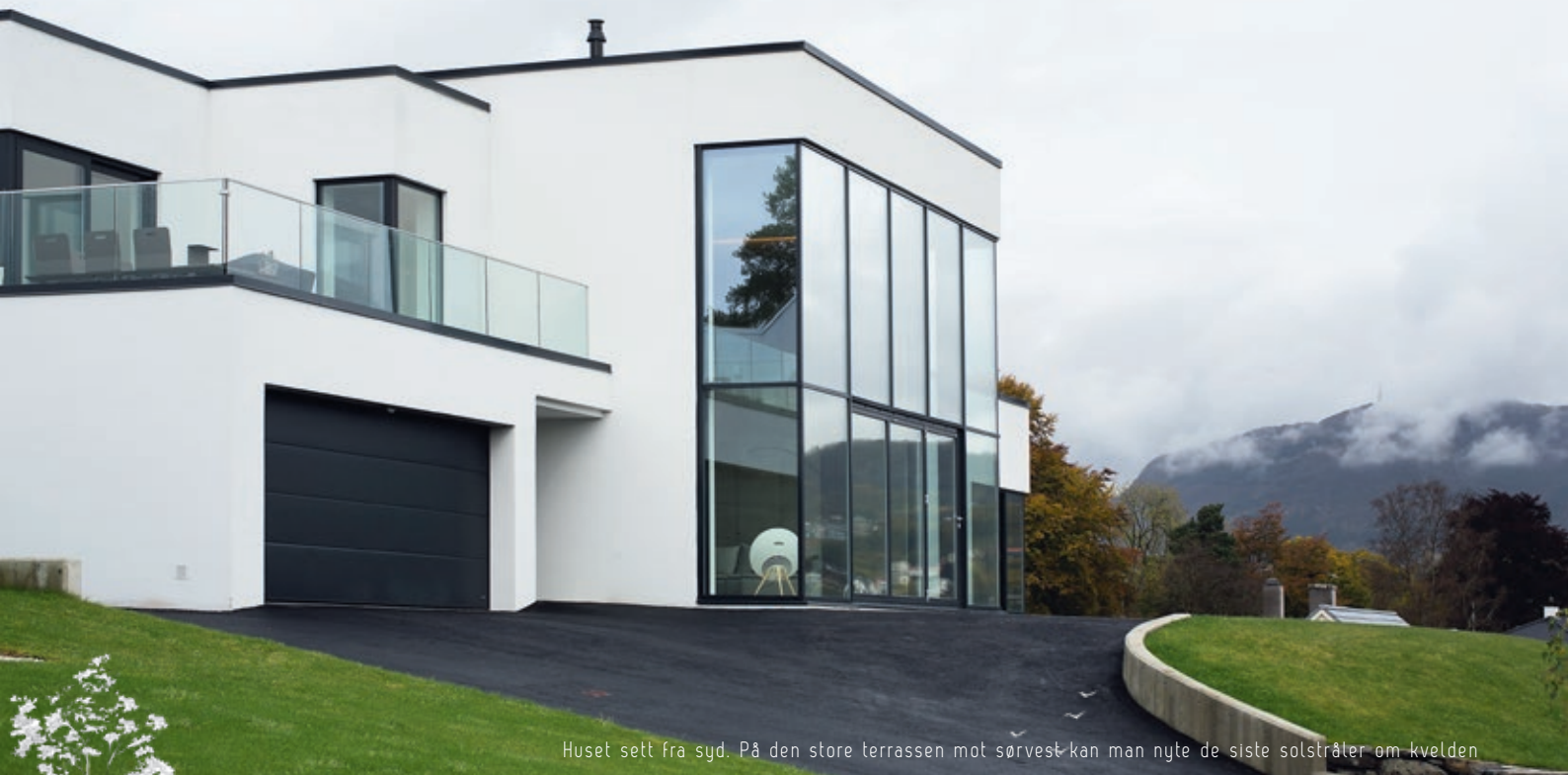
Huset sett fra syd. På den store terrassen mot sørvest kan man nyte de siste solstråler om kvelden