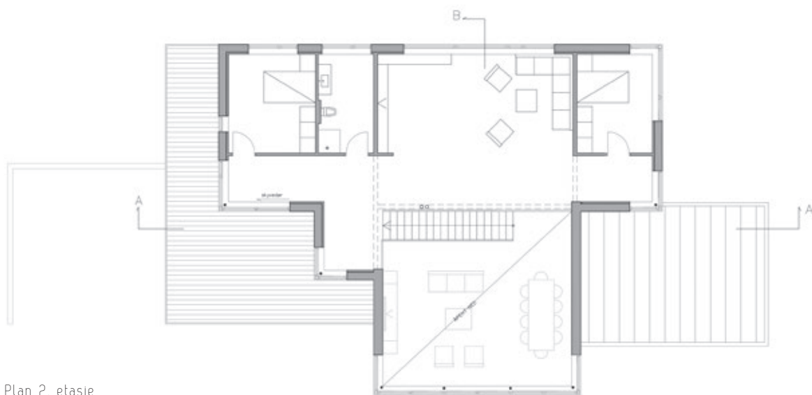
Plan 2. etasje