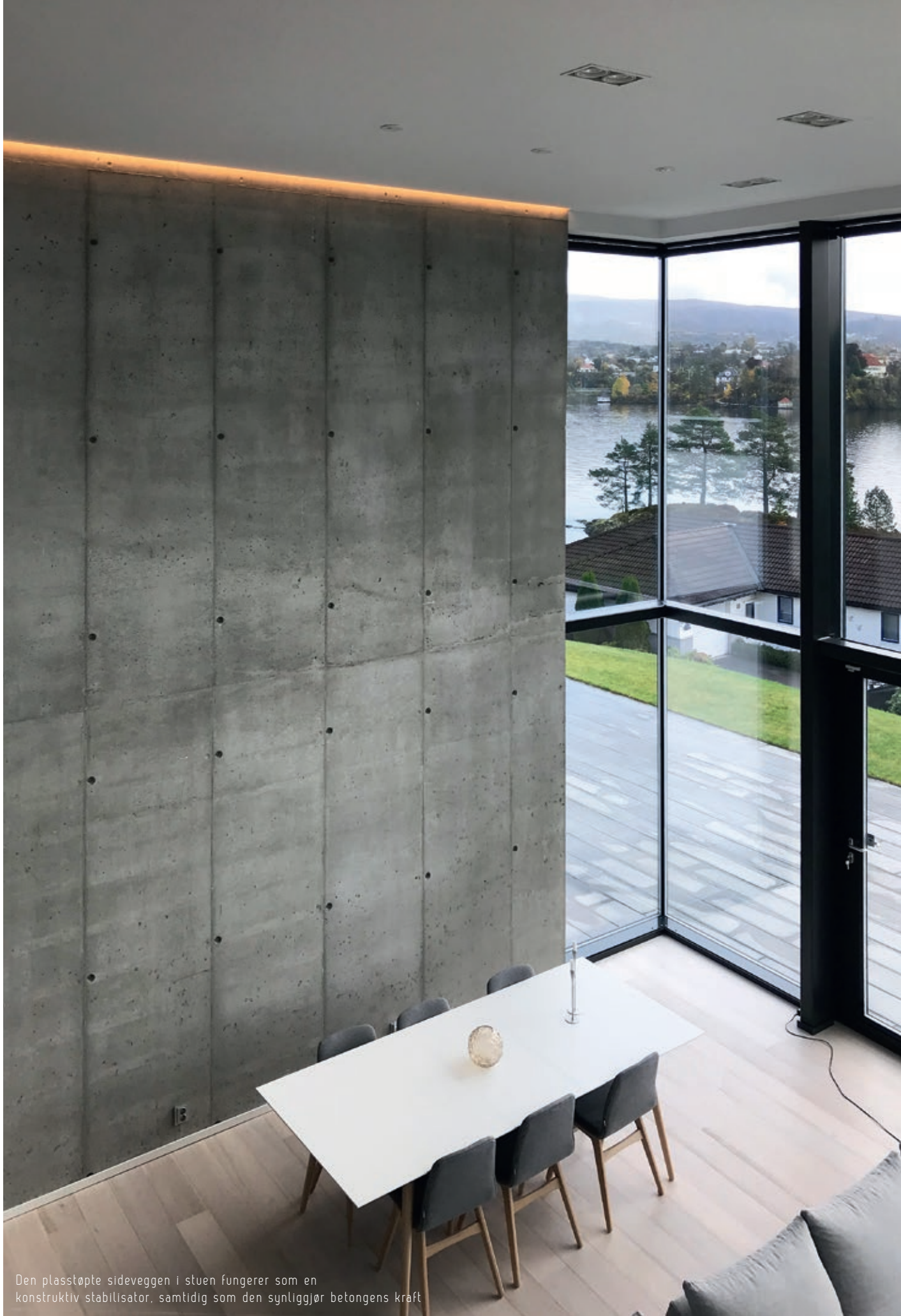
Den plasstøpte sideveggen i stuen fungerer som en konstruktiv stabilisator, samtidig som den synliggjør betongens kraft