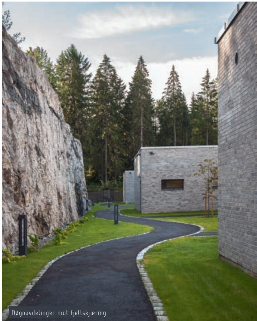
Døgnavdelinger mot fjellskjæring