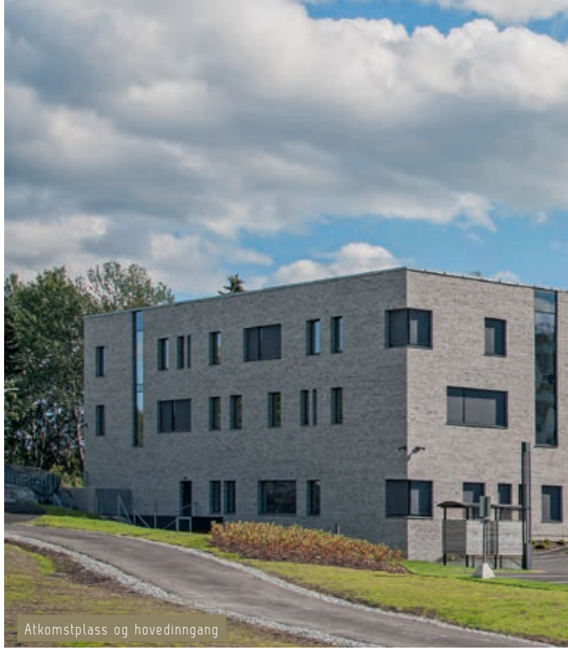
Atkomstplass og hovedinngang