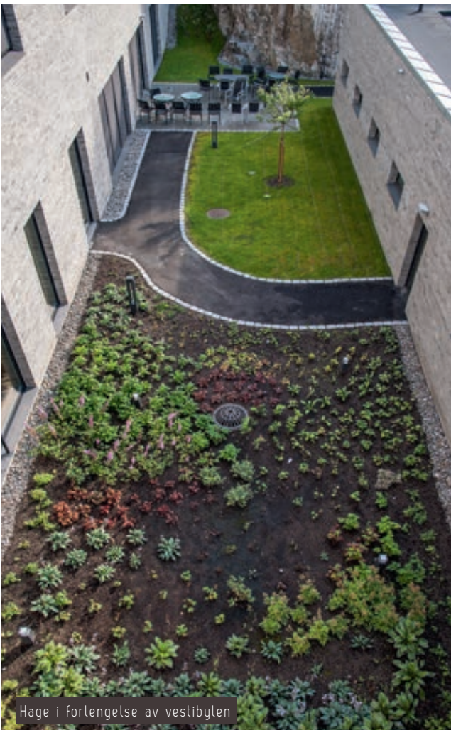
Hage i forlengelse av vestibylen