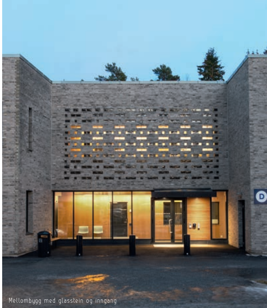
Mellombygg med glassstein og inngang

I fasadene er det arbeidet bevisst med ulike relieffer for å gi en subtil variasjon. Mot atkomstplassen og over varemottaket er det to større partier der teglen stikker noen centimeter ut. I de tre mellombyggene er det i 2. etasje murt inn glassstein i mønster. Alle vindusmyggene er murt, og solavskjerming er gjemt bak teglen. I skrå hjørner er teglsteinen skåret til. På deler av fasaden er teglen trukket noen cm inn for å skape relieffer/linjer.