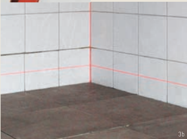
Figur 3a og b: Laser benyttes for å måle høyder eller etterkontrollere fall