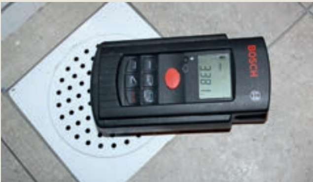
Figur 2: Elektroniske lengdemålere registrerer lengder og beregner høydeforskjeller