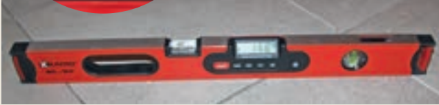
Figur 1: Omregning fra % viser at flaten med 1,64 % helning tilsvarer fallforhold ca 1:60