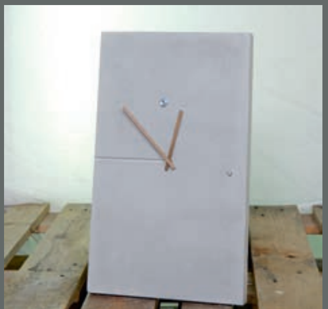
Ragnhild E Osbak - Opplandske Betongindustri, Dokka