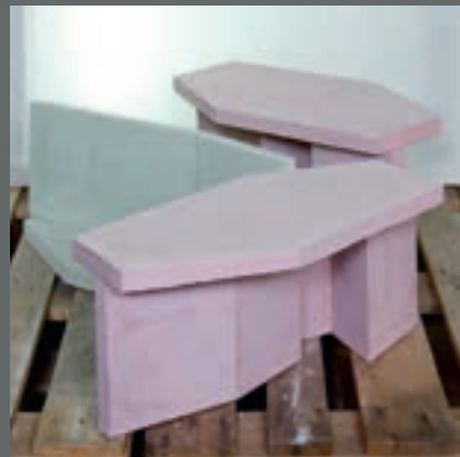
Øivind Haaland Contiga, Moss