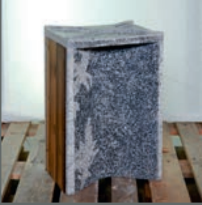
Åsmund Skeie NorBetong, Stavanger