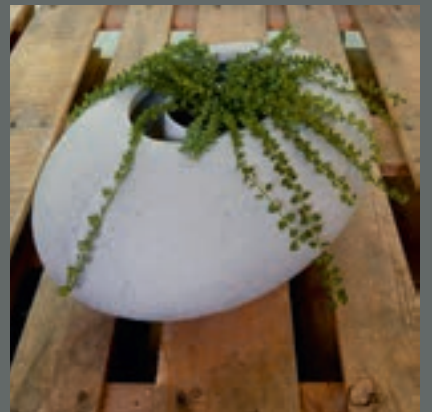
Truls Glesne Opplandske Betongindustri, Dokka