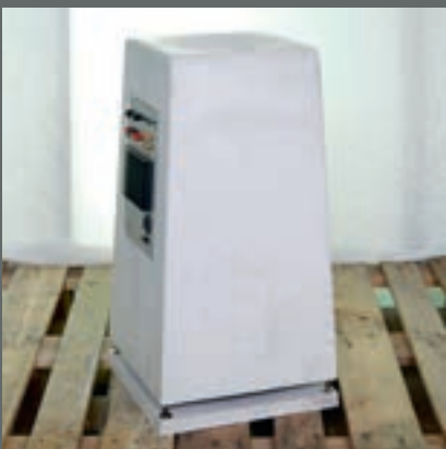
Magnus Garvoll Opplandske Betongindustri, Dokka