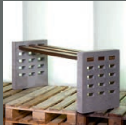
Hanna Hallböök Block Berge Bygg, Stavanger