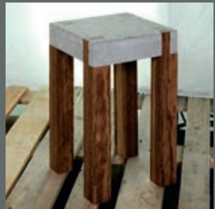
Hanna Hallböök Block Berge Bygg, Stavanger