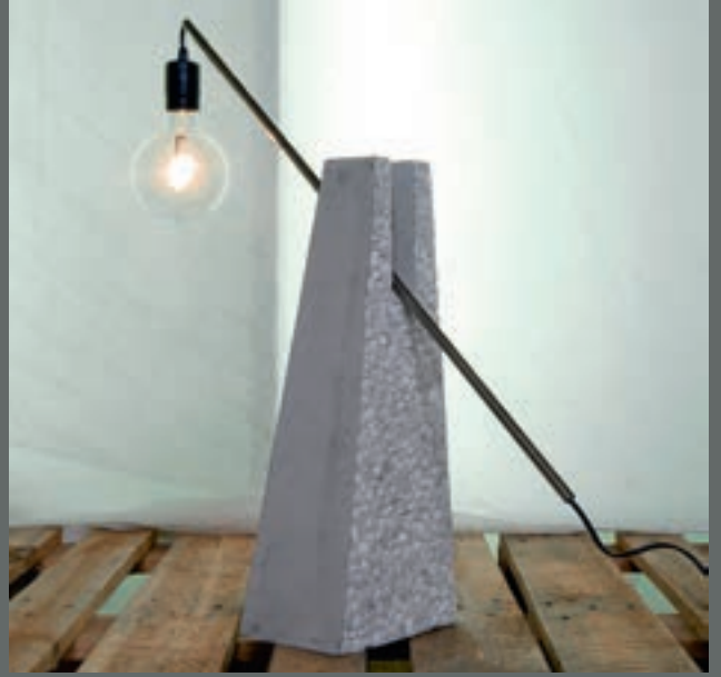
Oda Frøyen Nybø - Unicon, Sjursøya