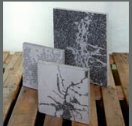
Åsmund Skeie NorBetong, Stavanger