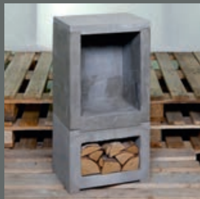
Silje Træen Spenncon, Hønefoss