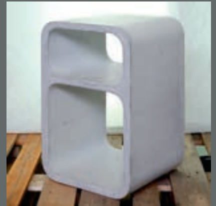
Truls Glesne Opplandske Betongindustri, Dokka