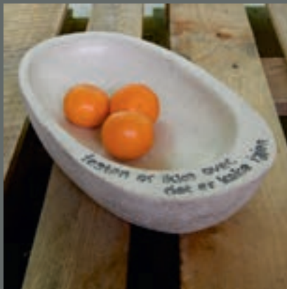
Eva Birgitte Storrusten Block Berge Bygg, Stavanger