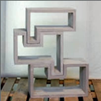
Cecilia Sundt Spenncon, Hønefoss