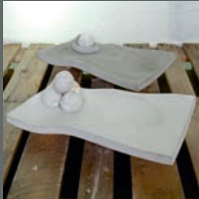
Knut Børre Mølstad Contiga, Moss