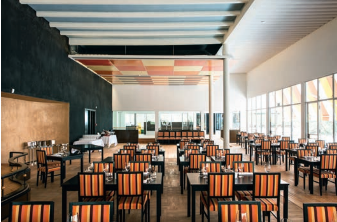
Restaurantmøblene er spesialbygd av Henriksens snekkeri etter gamle fotografier