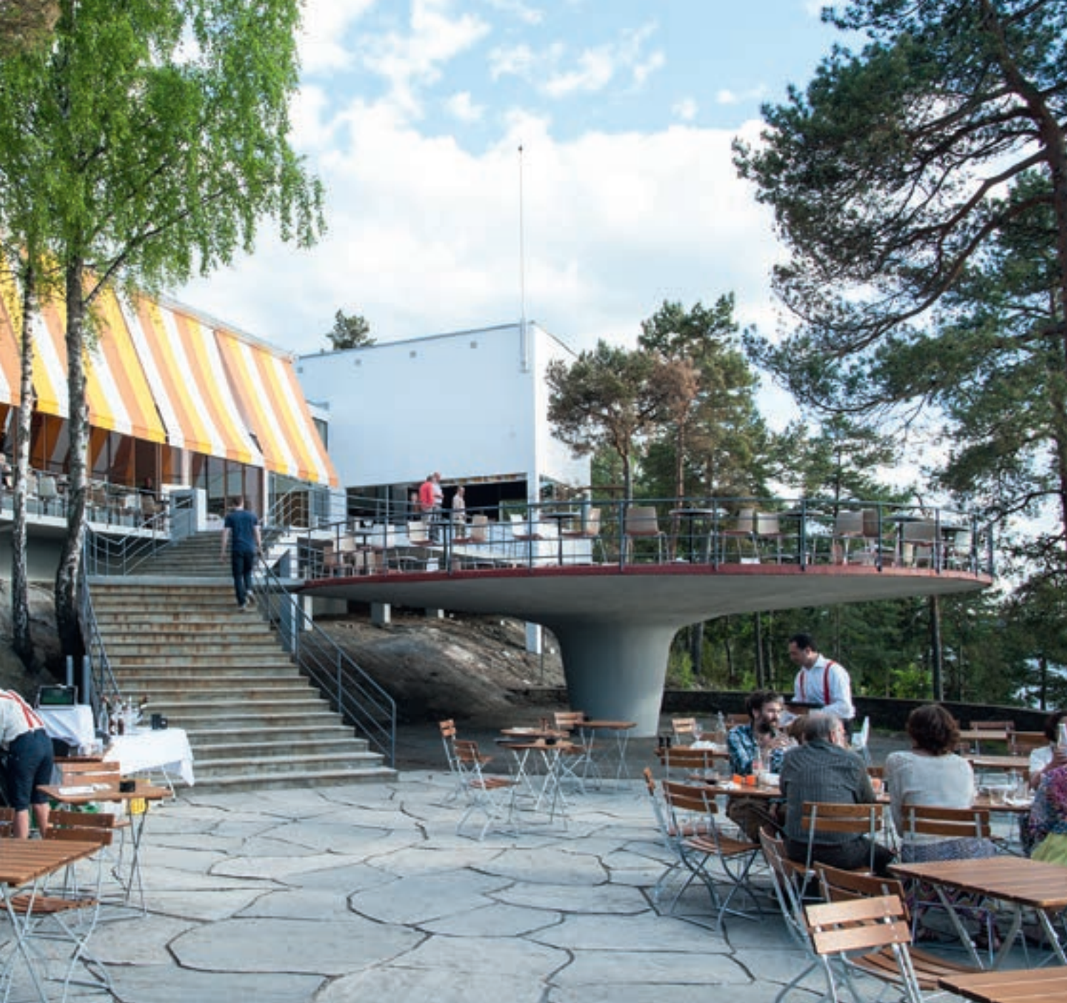
Restauranten anno 2013. Danseplattingen, også kalt 'soppen', er en rund skive i armert betong