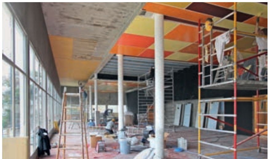
Storsalen under restaurering

I 2011 startet Eiendoms- og byfornyelsesetaten i Oslo kommune arbeidet med restaurering av restaurantbygningen. Prosjektets hovedmål har vært å sette restauranten tilbake til den stand den var i da den var ny i 1934, med original materialbruk og farger. Det er til sammen bevilget ca. 50 mill. kroner til innvendige og utvendige restaureringsarbeider.