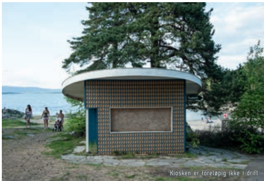
Kiosken er foreløpig ikke i drift