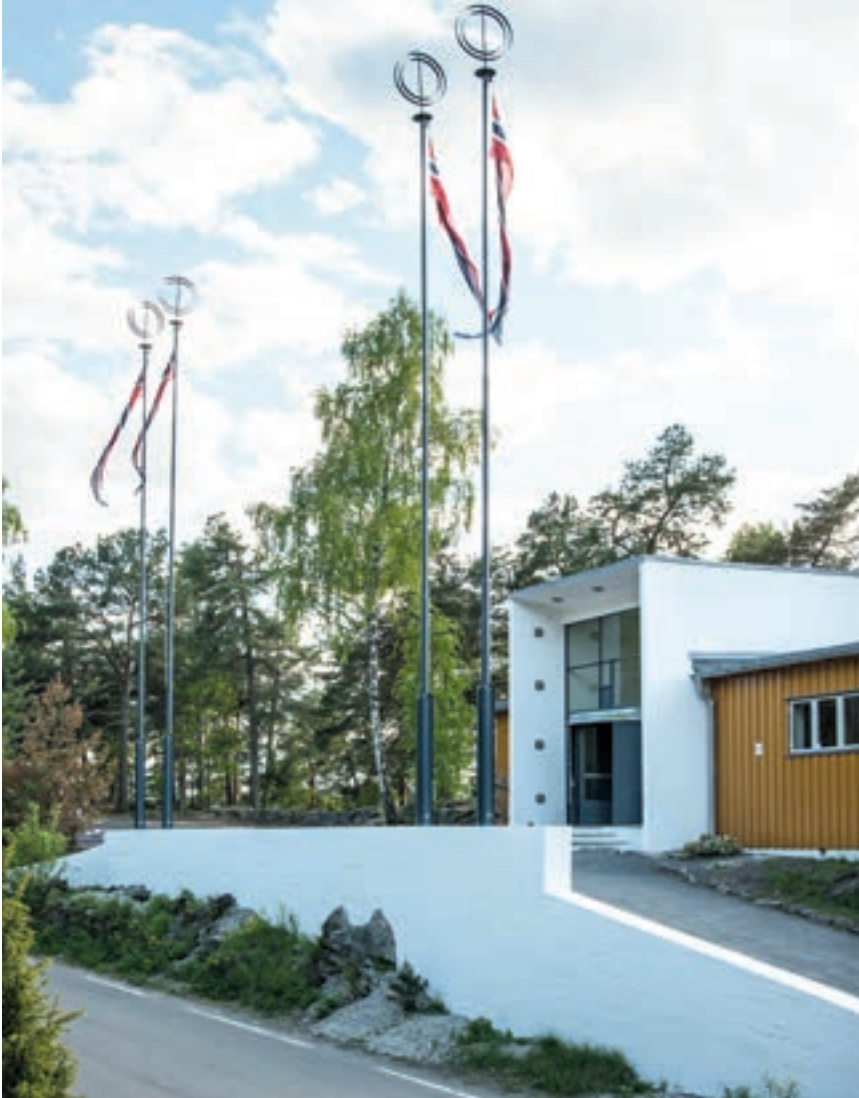
Inngangspartiet viser de slanke betongkonstruksjonene som er typiske for bygget

Arbeidet har vært en møysommelig prosess hvor bl.a. opprinnelige farger er sporet opp slik at restauranten kan få tilbake de originale fargene. Restaureringsarbeidet har skjedd i nært samarbeid med Riksantikvaren, som parallelt har arbeidet med fredningen av hele badeanlegget. Hele restaurantbygget med eksteriør og interiør samt resten av anlegget med bygninger, badestrand, brygger, veier, stier, trapper samt busker og beplantning ble fredet av Riksantikvaren 16. august 2012.