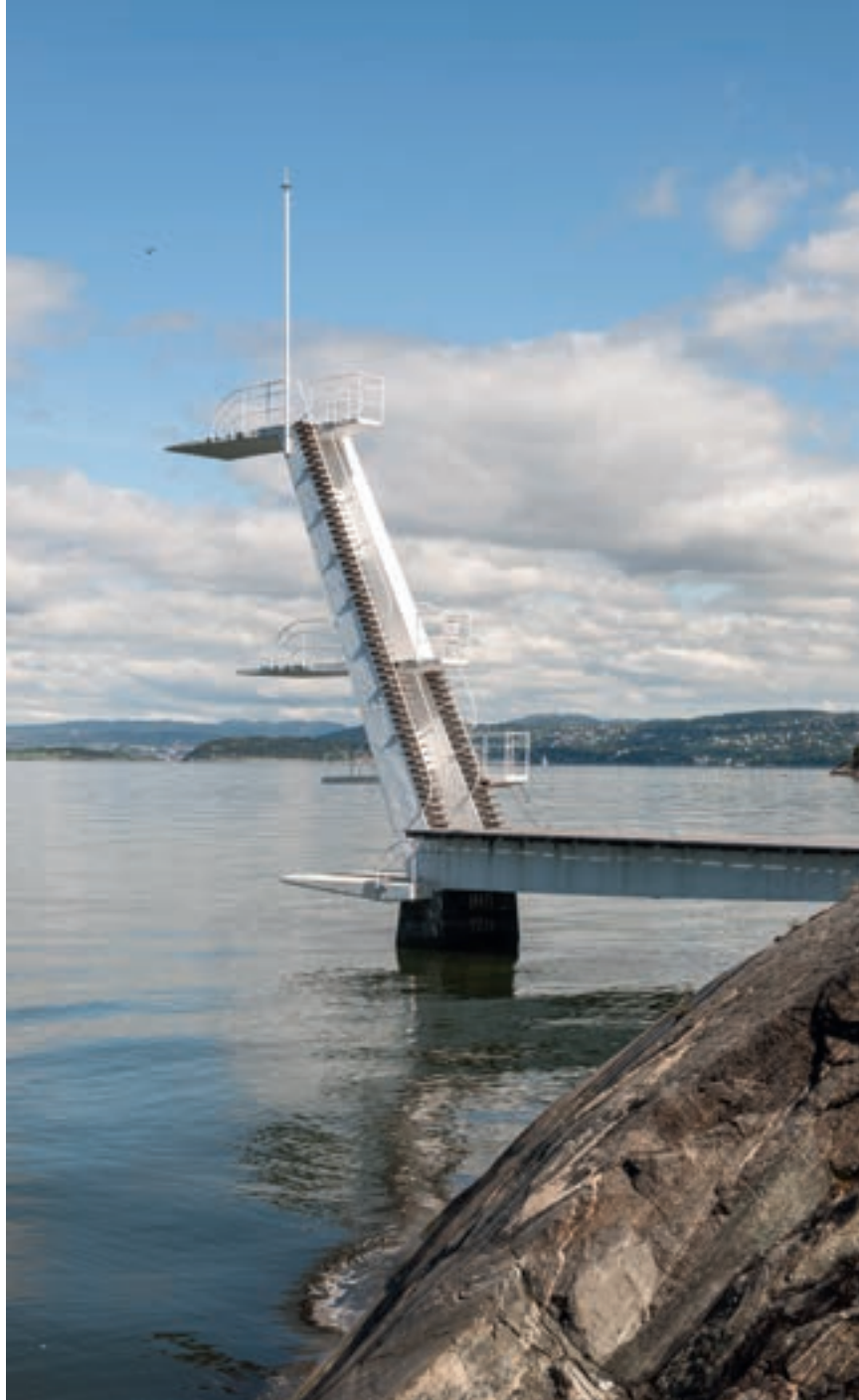
Stupetårnet ble rehabilitert i 2010. Det opprinnelige tårnet hadde ikke rekkverk

Eiendoms- og byfornyelsesetaten er glade og stolte av at denne perlen ved sjøen igjen kan vise seg fra sin beste side og utgjøre et viktig tilbud til badegjester og andre som besøker Ingierstrand bad i sommersesongen.