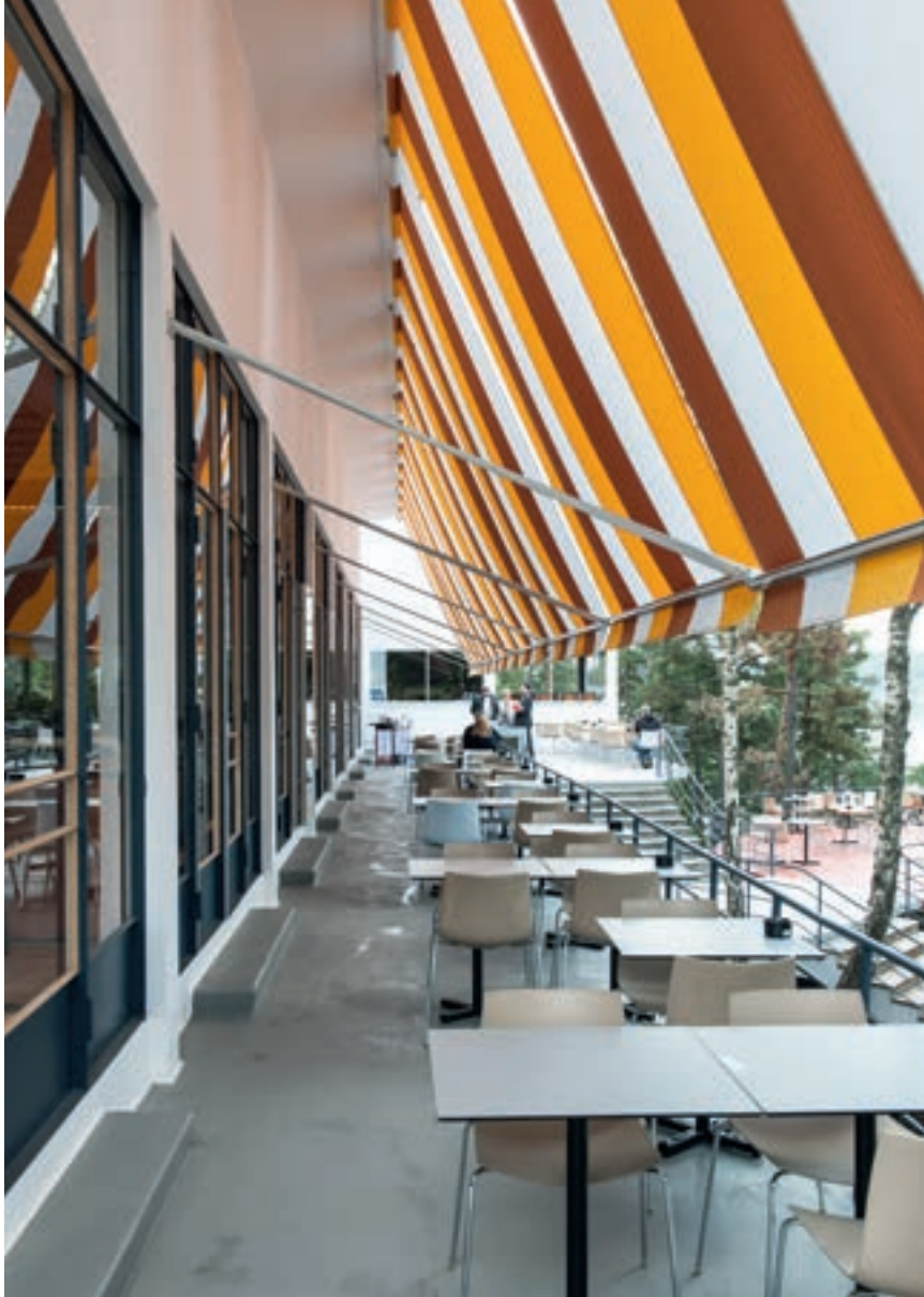
Markisene med originale farger fra 1934 er gjenskapt etter gamle fotografier

Eiendoms- og byfornyelsesetaten er Oslo kommunes grunneier og en aktiv pådriver for utvikling av byen.