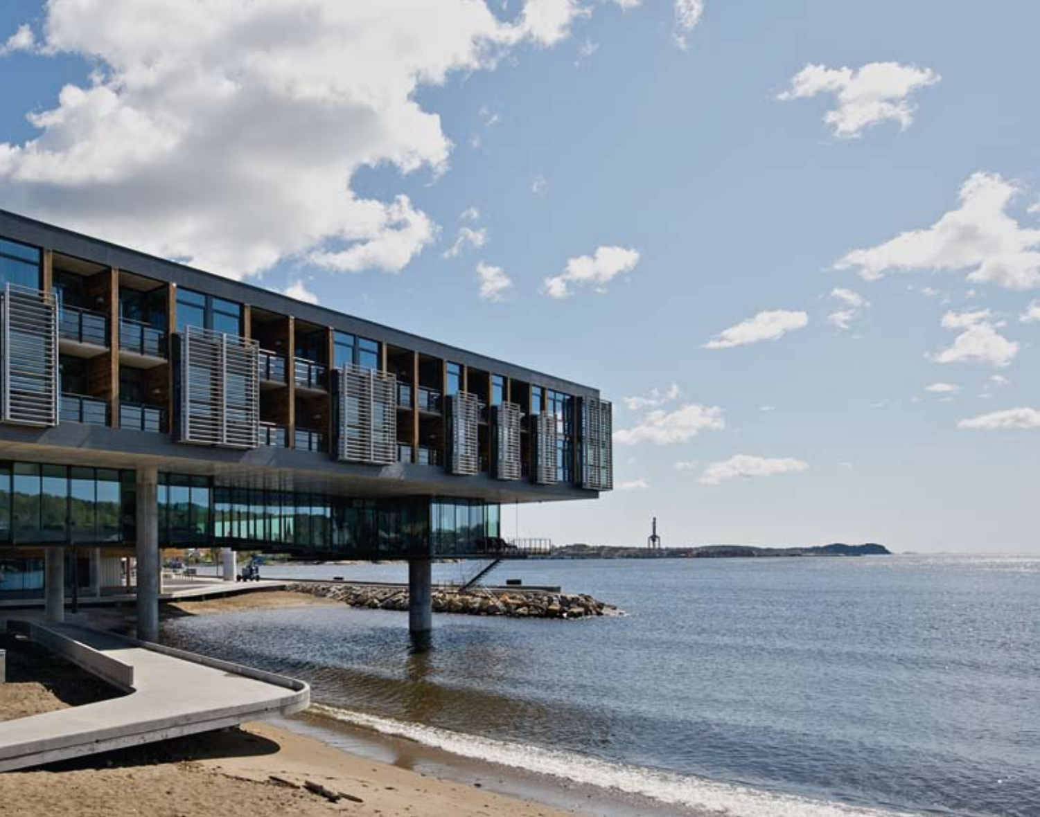
Fasade vest – hotellromsfløy krager ut over vannet