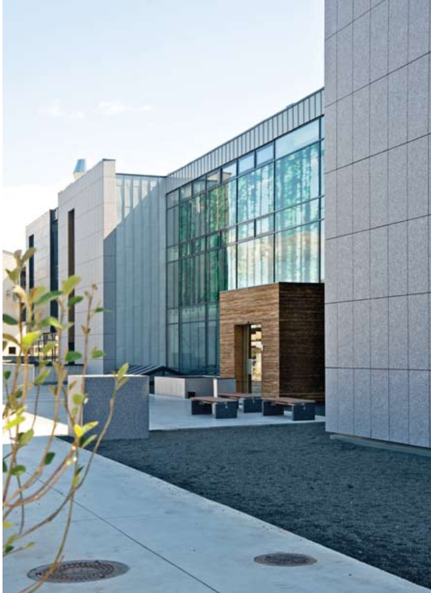
Fasade nord – mot Stavernsveien