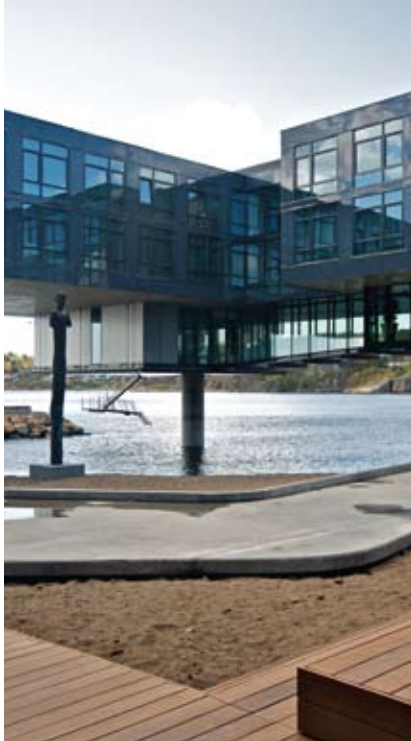
Byggets hjørne over vannet sett fra atriets

gen mellom sand og vann, direkte i gjestens siktlinje ved adkomst. Denne bronsemannen er 6,5 meter høy og står på en massiv Larvikittblokk, slik at hodet når høyden til gjestene i resepsjonen.