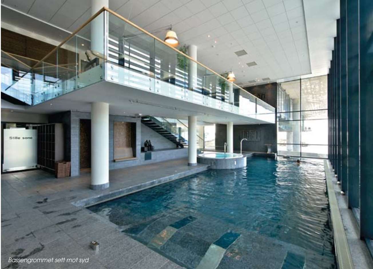
Bassengrommet sett mot syd