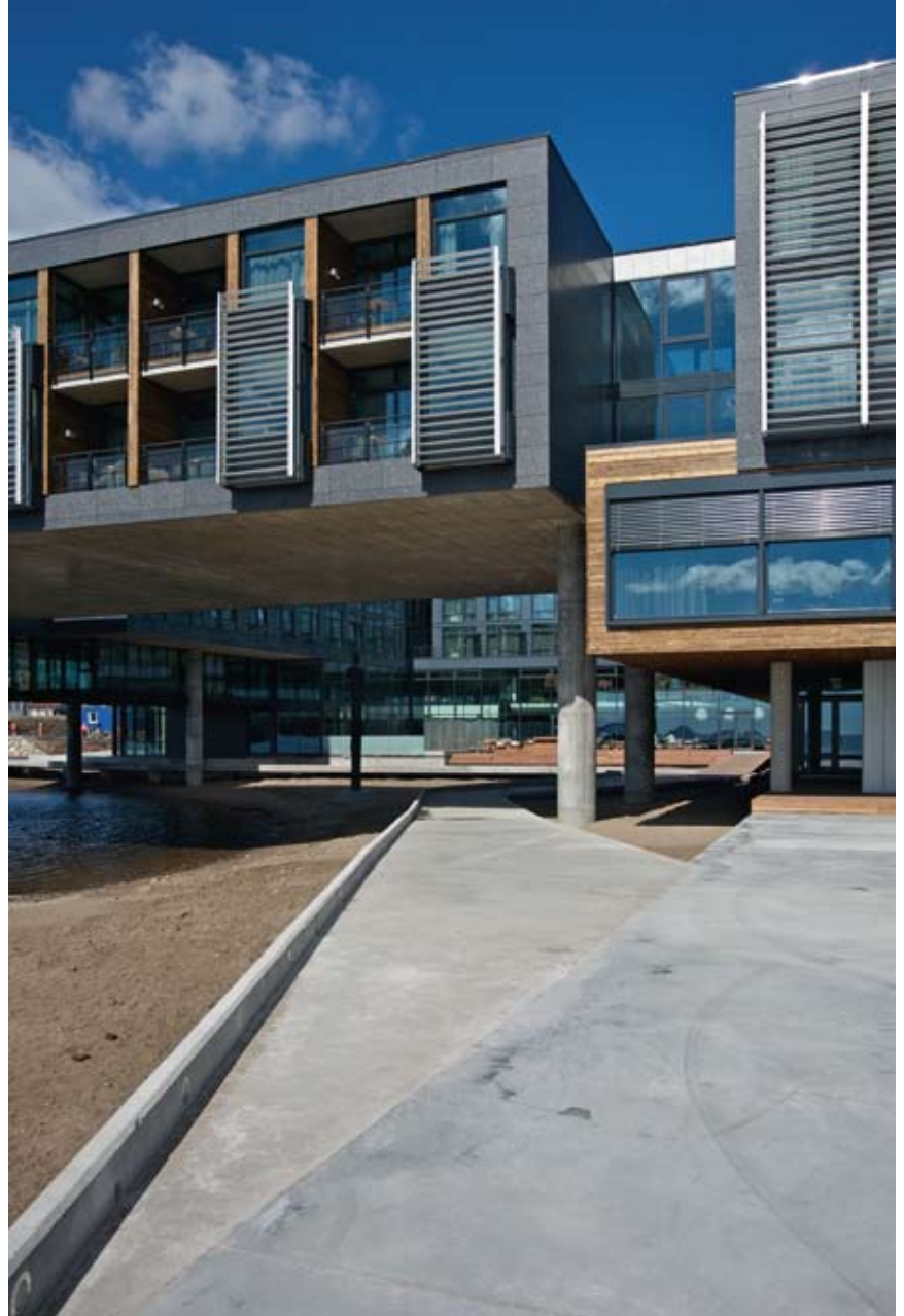
Den offentlige gangveien i betong fører gjennom atriets

At arkitekten sto fast på eksponert betong i en kald synlig himling under disse volumene har også blitt løst av en kreativ ingeniørgruppe, og forsterket byggets uttrykk.