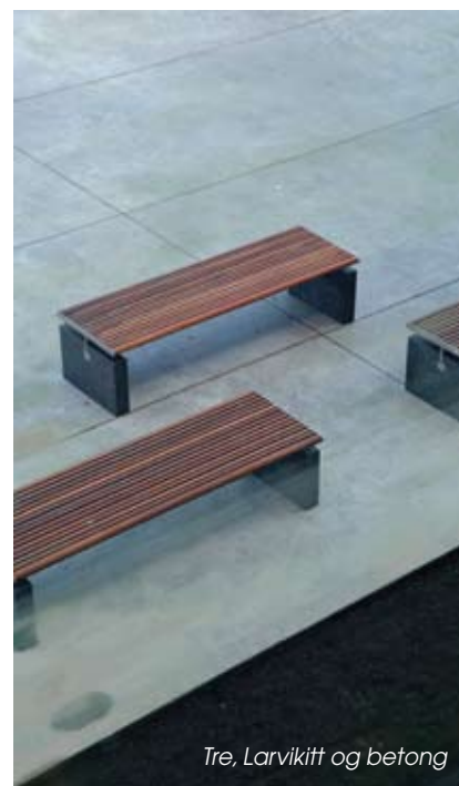
Tre, Larvikitt og betong