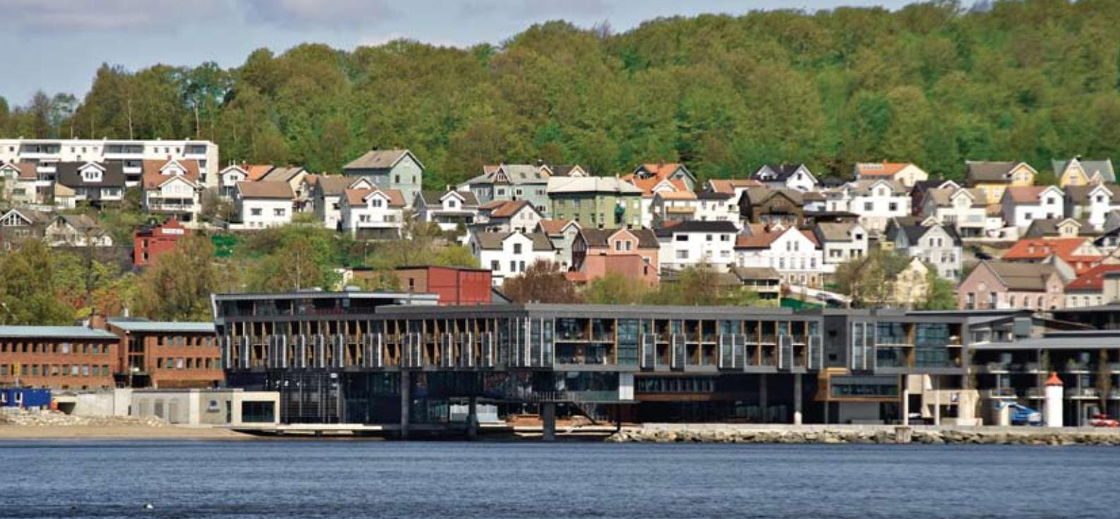
Hotellet sett fra fjorden

badekåpe står ikke i samme heis som konferansegjesten i dress.