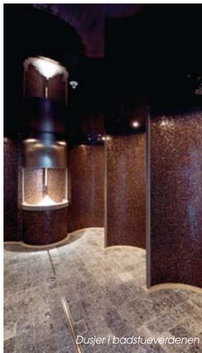
Dusjer i badstueverdenen