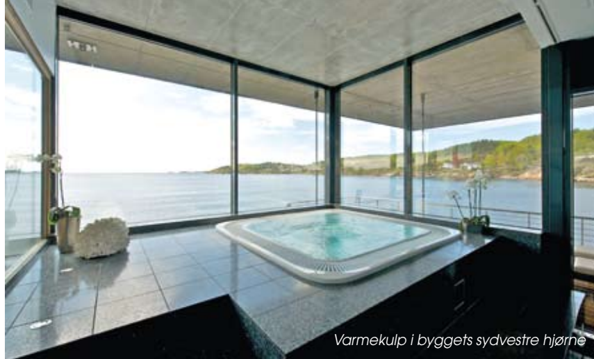
Varmekulp i byggets sydvestre hjørne

Sentralt i organiseringen har det derfor vært å separere transport av gjester til spa fra kurs- og konferansefunksjoner og hotellets øvrige funksjoner. Fra rometasjene velger gjestene mellom heis/trappeløp som går til spa eller til andre funksjoner. En gjest i