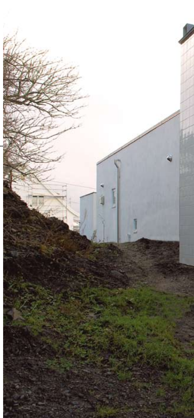
Fasade nordvest. Arkitekten foran boligen på inngangsnivå