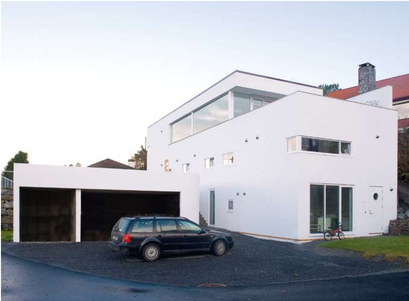
Fasade sørvest. Gårdsplass på nivå med kontordel. Inngang og hageareal på nivå med garasjetak