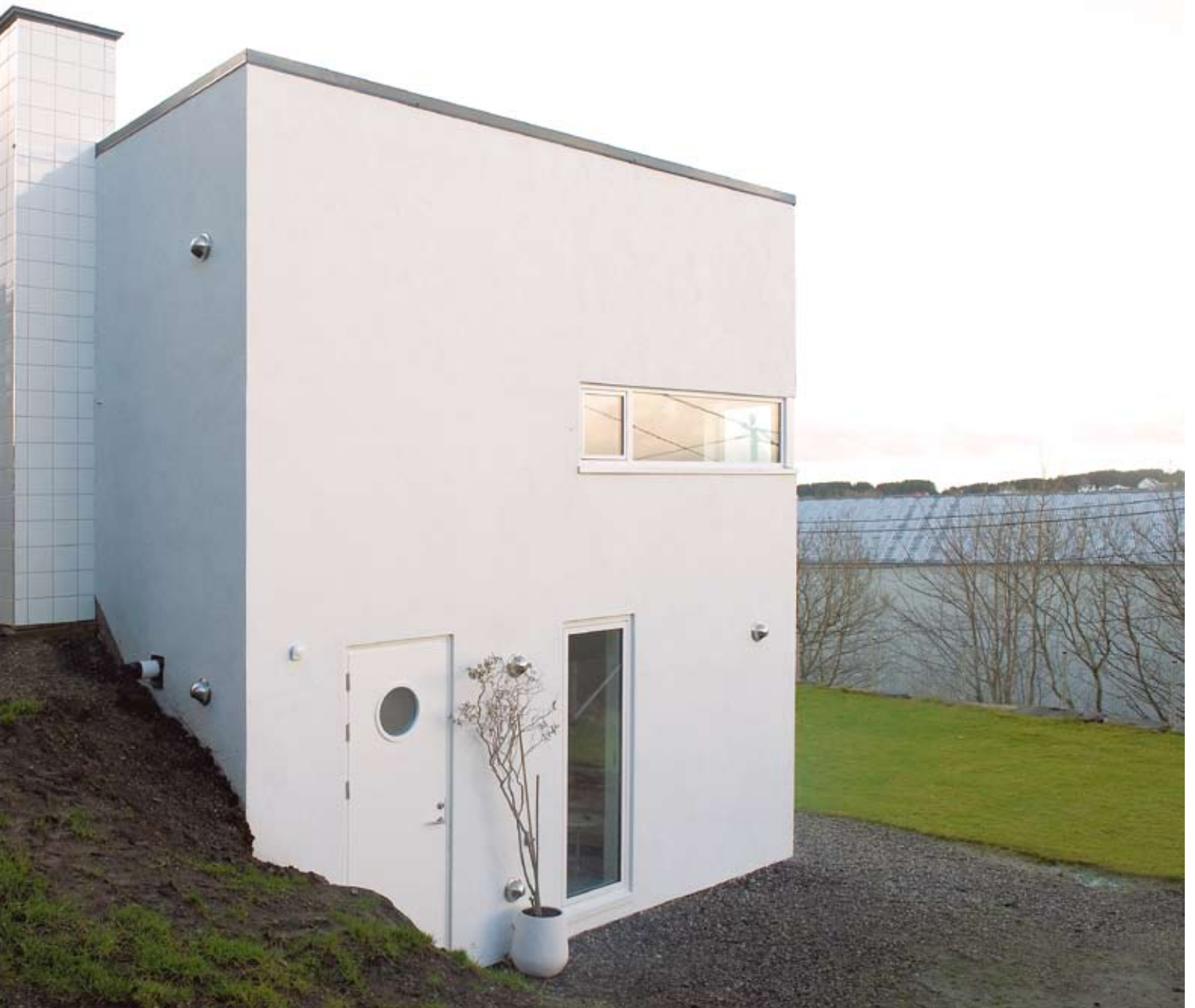
Fasade nordøst. Pipen med glaserte hvite fliser i kontrast til den matte silikatpussen

Tomten er skilt ut fra en hage i et etablert boligområde med relativt store tomter. Den utskilte tomten er på 800 m 2 og skråner mot Karmsundet i vest. En privat vei ligger på nordsiden; denne tar i seg høydeforskjellen på ca åtte meter. Veien fortsetter langs tomtens vestside, og munner ut i gårds plass til nabo i sør. Tomten ligger skjermet, fri for gjennomgangstrafikk og innsyn.