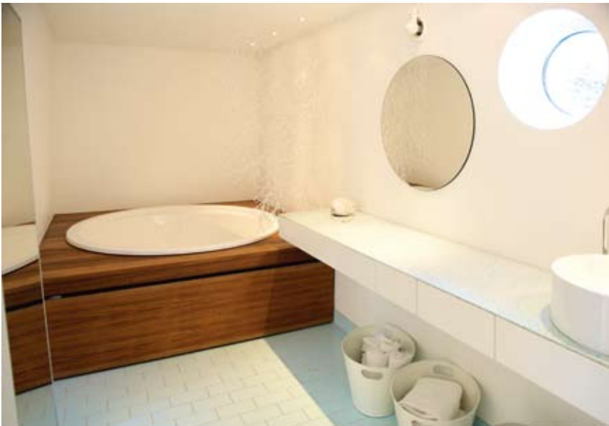
Baderom har pussede, hvitmalt vegger, fliser på gulv, benkeplate i glassbetong samt badekar innbygd i tre