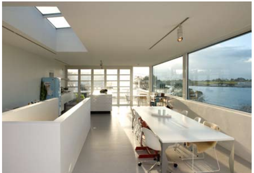
Fra kjøkkenet. Det elleve meter lange vindusbåndet gir god kontakt med sundet

I underetasjen ligger lekerom, teknisk rom, bodareal, samt kontordel med egen inngang mot sør.