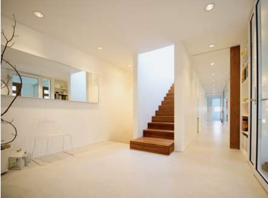
Fra hall ledes man opp til oppholdssone via trapp mellom to pussede skiver