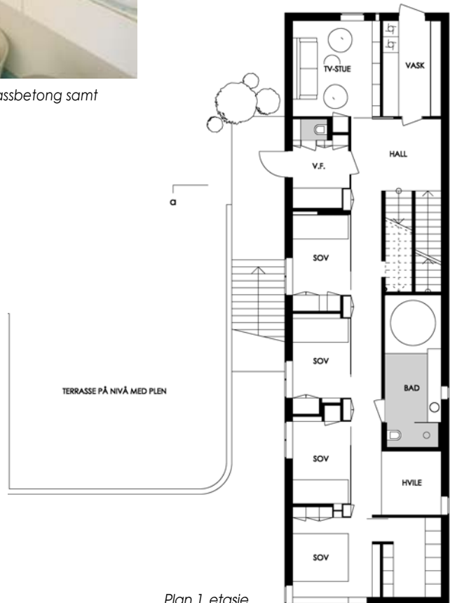
Plan 1. etasje