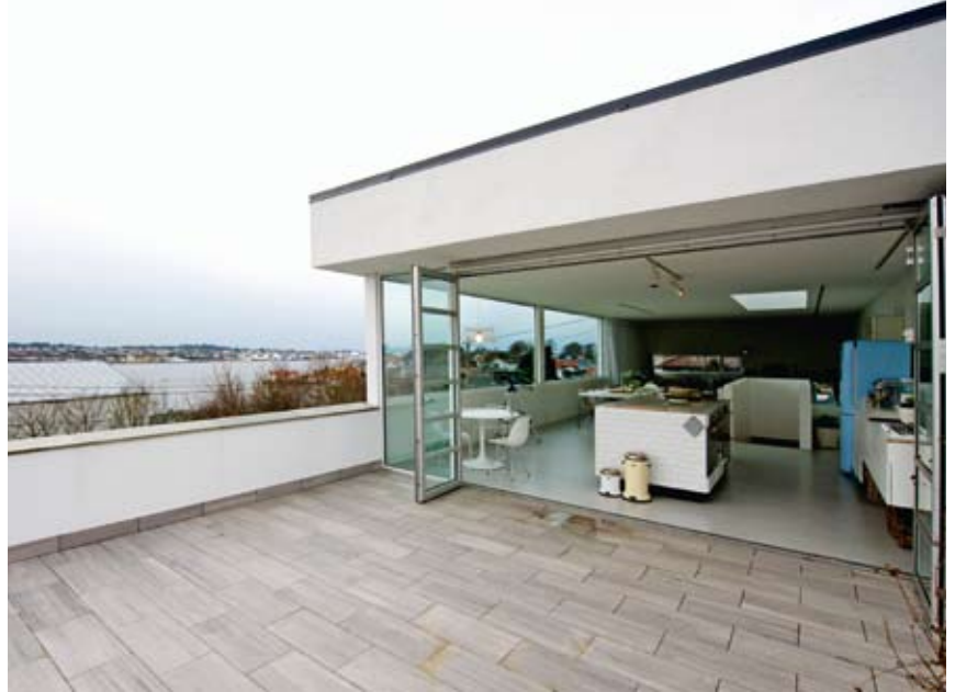
Når foldedøren mot sør åpnes, integreres terrasse i oppholdsdel

nordøst som mulig, slik at utsiktsforholdene utnyttes optimalt, og det frigjøres mer utendørs oppholdsareal mot sørvest.