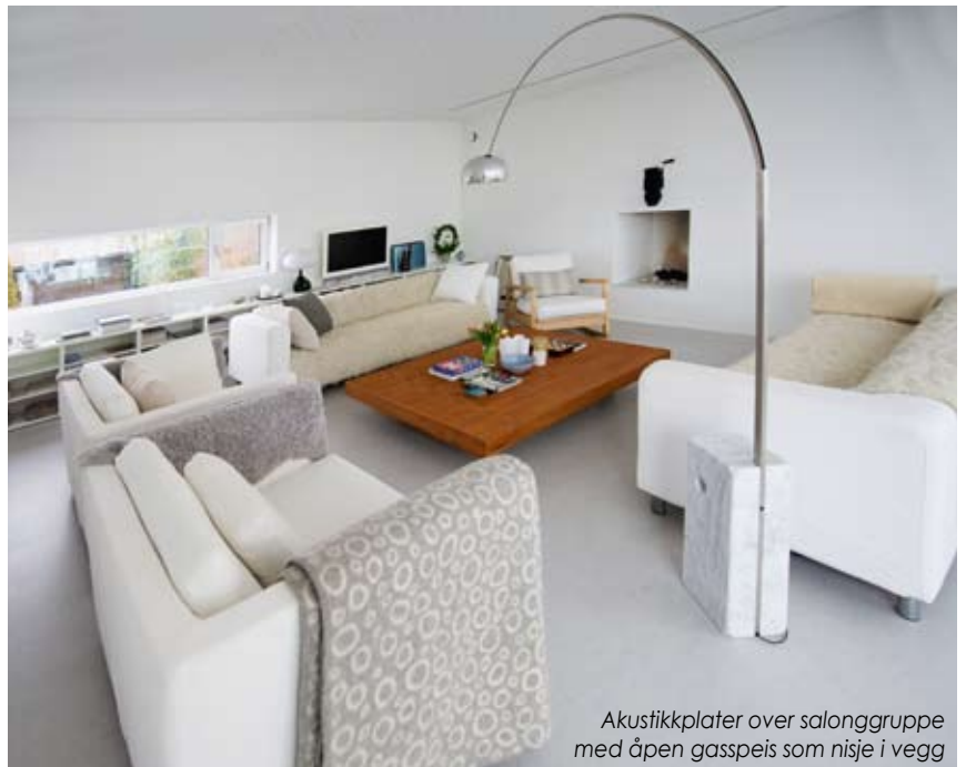
Akustikkplater over salonggruppe med åpen gasspeis som nisje i vegg