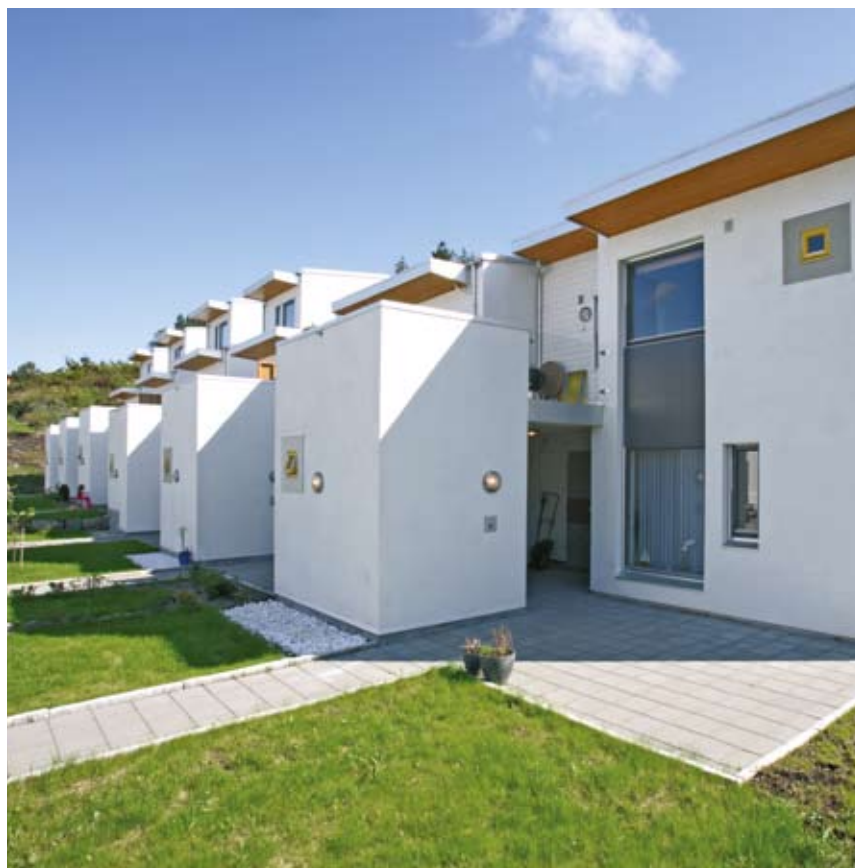
R16-21; inngangsfasaden mot nord