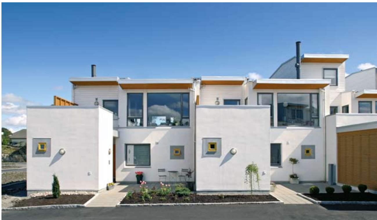
R26–30; inngangsfasaden mot nordvest