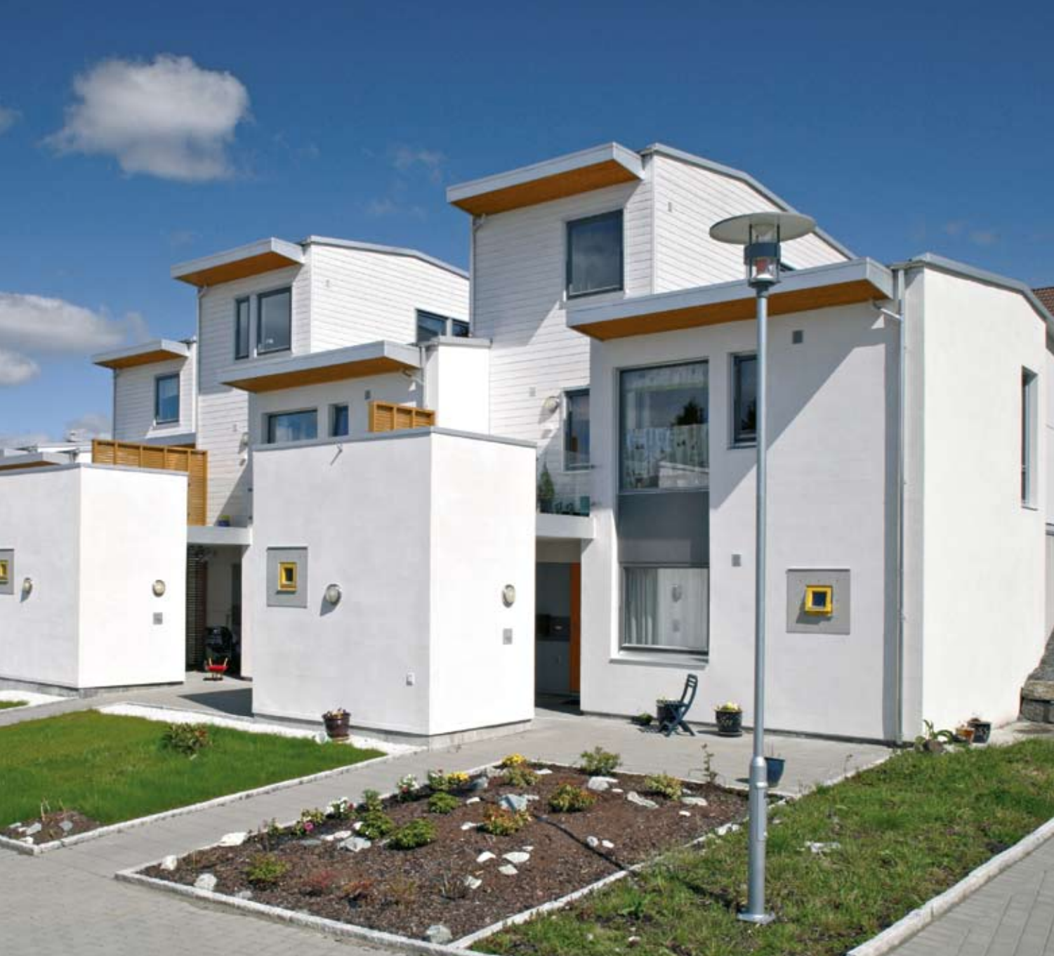
R22-25; inngangsfasaden mot vest

Tomten hører til et større nytt utbyggingssområde i Fana utenfor Bergen, og ligger inntil et frodig friområde i nærheten av komponisten Harald Sæveruds hjem Siljustøl. Tomten har ingen spesiell utsikt, men den har gode solforhold.