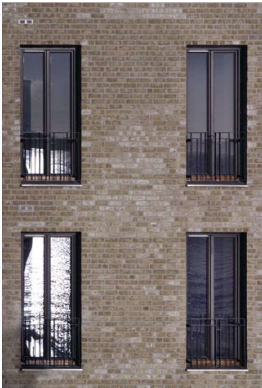
Sjøens lys og reflekser