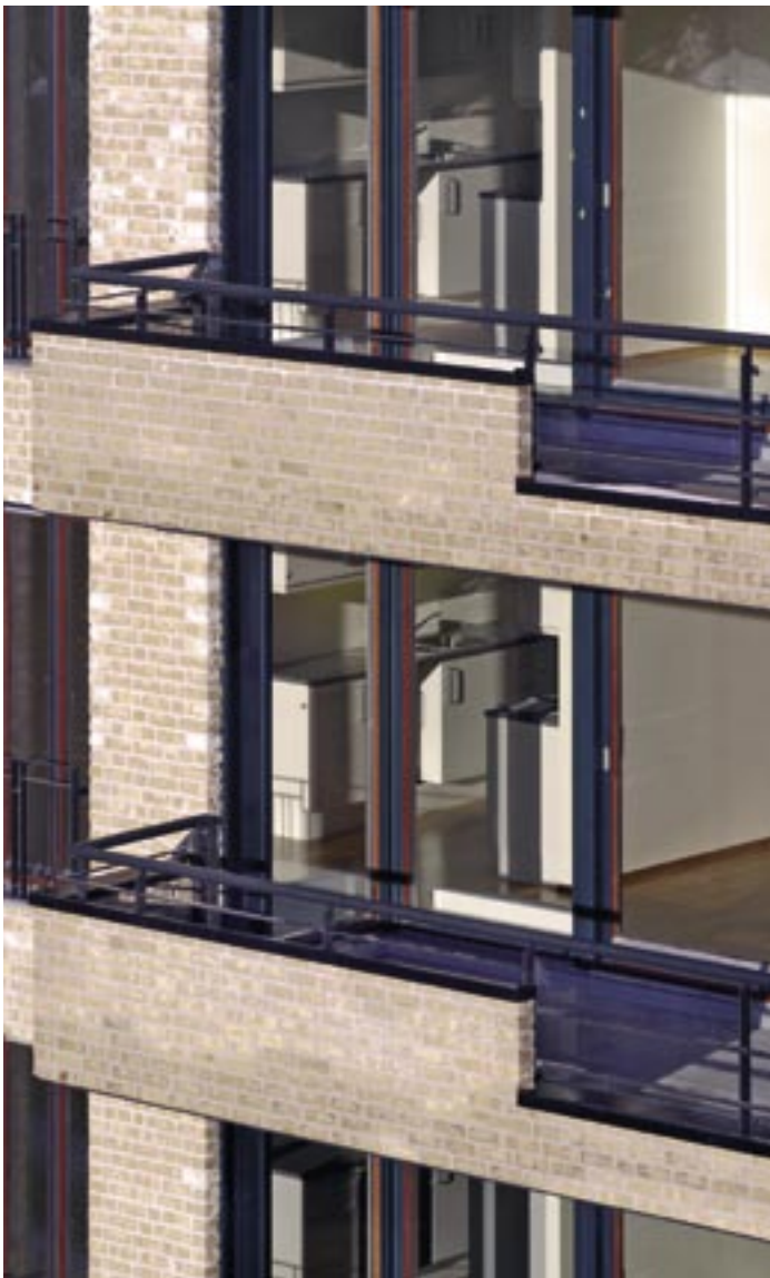
Sikt gjennom hjørnet