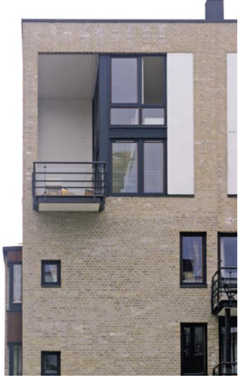
Her fanges solens siste stråler