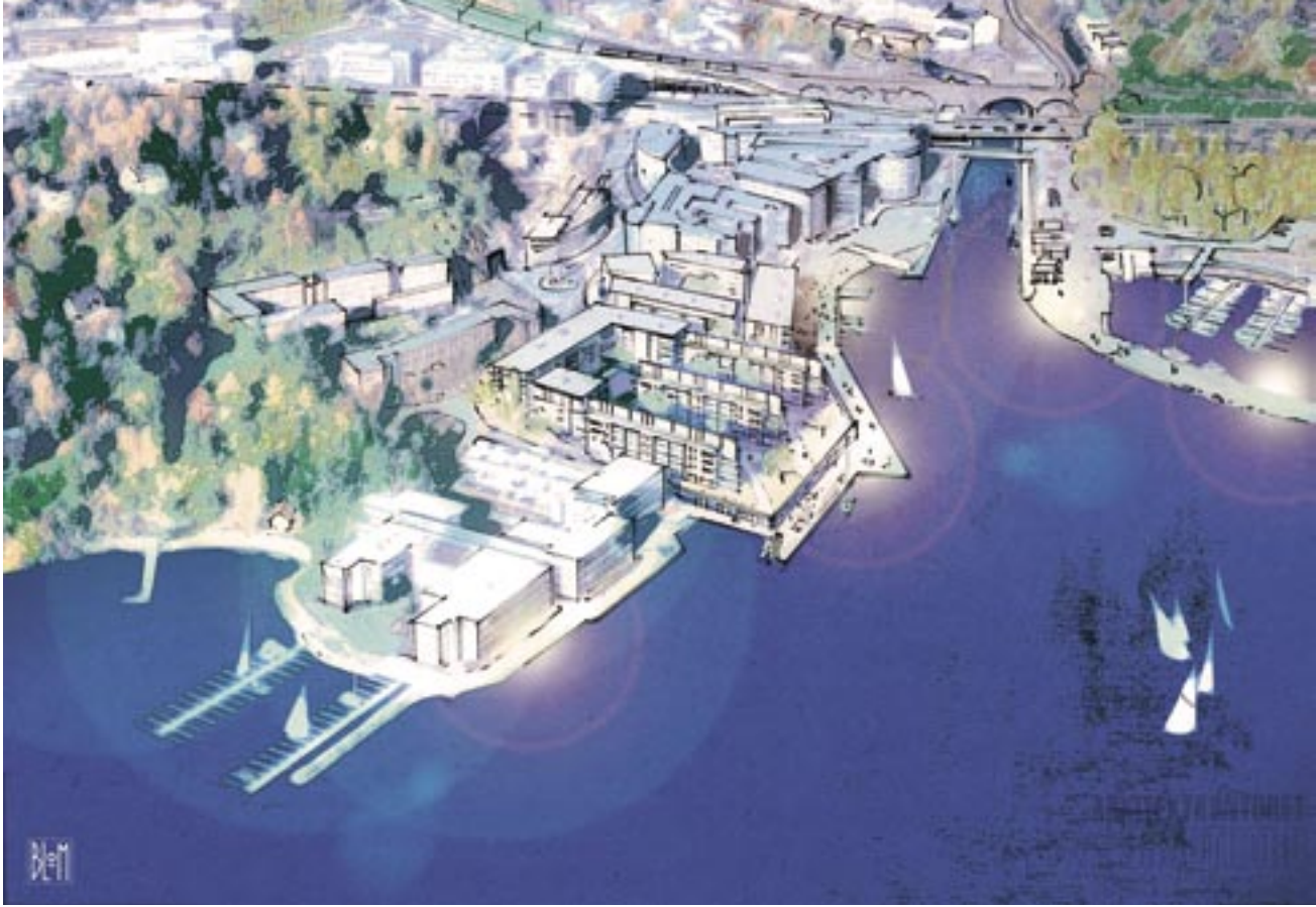
Lysaker brygge – situasjonsperspektiv

Vi vet at «innfatningen» rundt våre hverdagsliv preger vår tilværelse, på godt og vondt, og da føles det meningsfylt å prøve å tilrettelegge for det gode. I mitt hode innebærer det bl.a. å skape steder som føles trygge, hvor det er lett å orientere seg og lett å «høre til». Gode steder har atmosfære og karakter med variasjon og mangfold som tema.