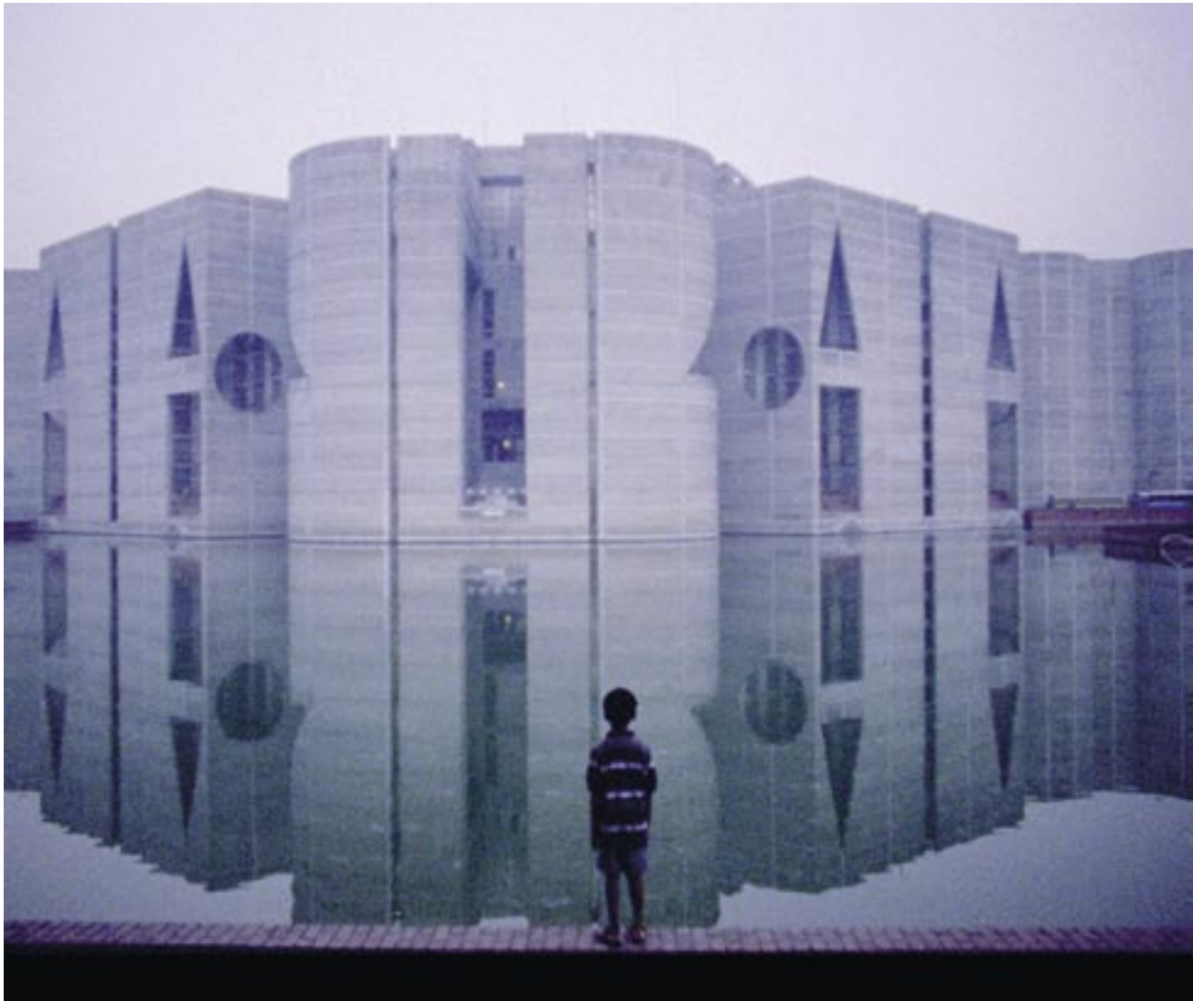
Filmlakaten; regjeringsbygningen i Dhaka, Bangladesh Fra filmen.