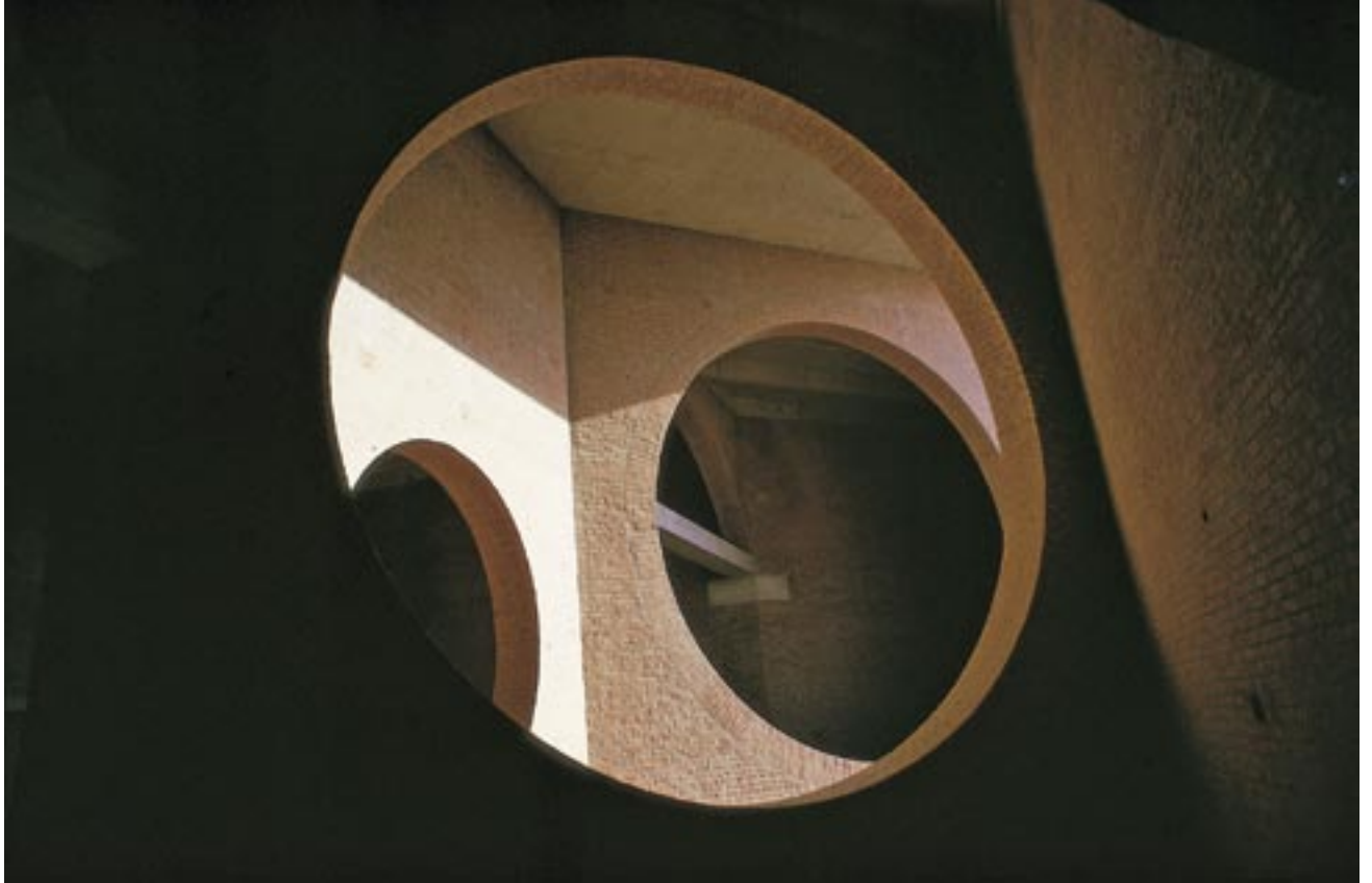
Institute of Management, Ahmedabad. Åpningene i den solide murarkitekturen låner former fra geometrien, slik som sirkelen.

fant han sent, etter fylte 50 år. Louis Kahns hus er få, men legendariske. Mens både hans utopiske byplan for Philadelphia og forslaget til ny synagoge i Jerusalem er forblitt på skissestadiet, ble Richard Medical Research Centre, den arkitektoniske perlen Kimbell Art Museum, Exeter Library og Indian Institute of Management alle bygget mellom 1950 og 1970-årene. Overalt er det mye nydelig murverk å se. Den mektige regjeringsbygningen i Dhaka (Bangladesh) er Lous genistrek. Det tok tre-og-tyve års innsats fra tusenvis av lokale håndverkere for å fullføre prosjektet i et av verdens fattigste og mest flomherjede land.