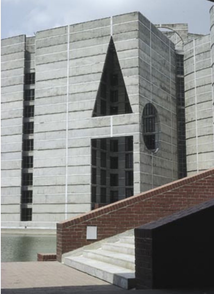
Regjeringsbygningen i Dhaka, Bangladesh (detalj). Triangelformen påkaller de egyptiske pyramidene - en arkitektonisk hieroglyf som er blitt tolket som et evig og moderne symbol på fysisk og åndelig lys.