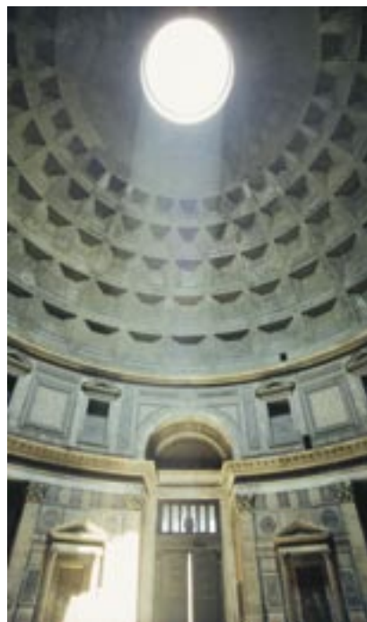
«Alle rom trenger naturlig lys» sa Kahn. (Fra Pantheon, Roma).

Da min far var arkitekturhistoriker, er det uungåelig å ikke føle en nærhet til Kahn. Sammen med en viss