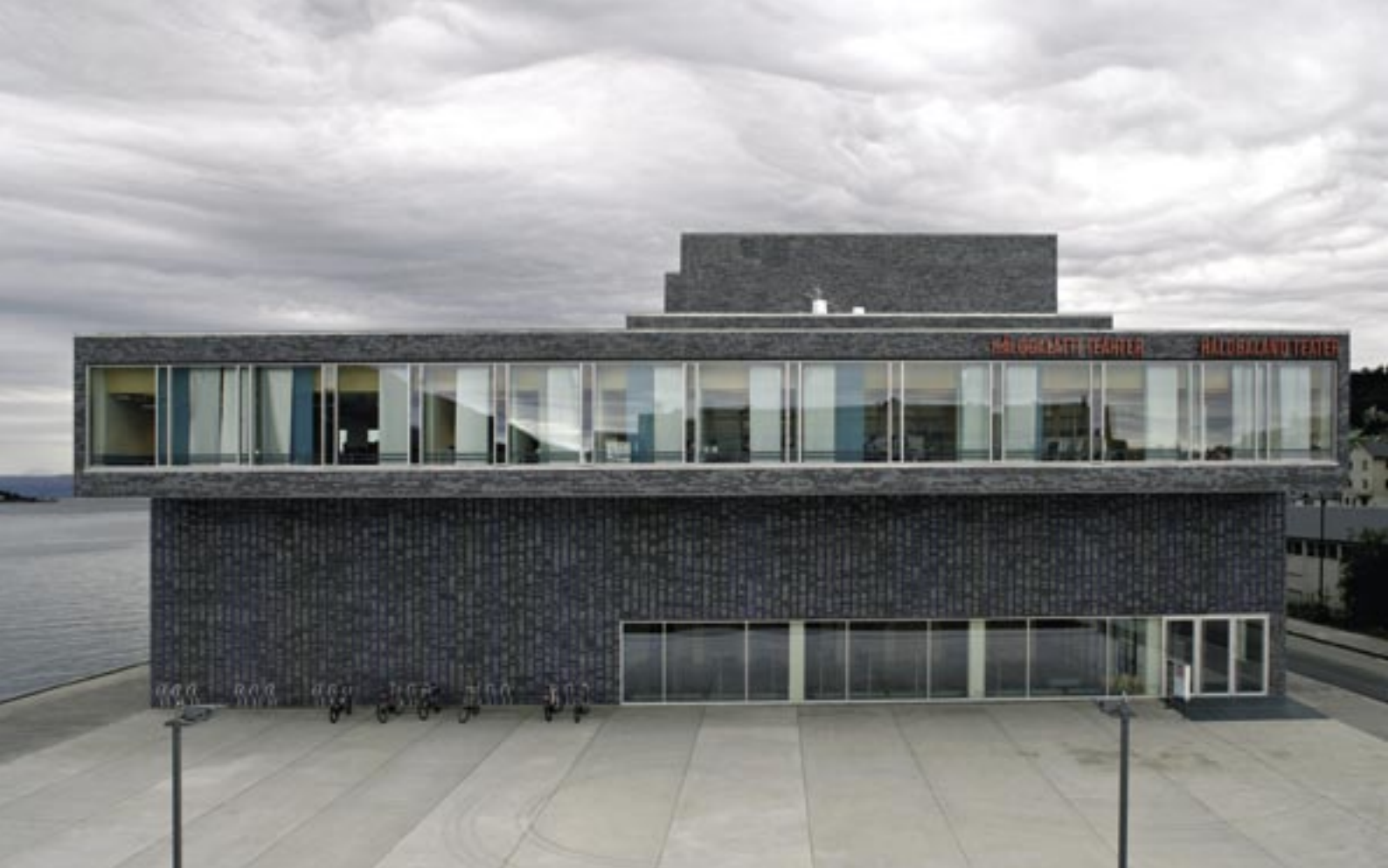
Fasaden mot teaterplassen. Teglveggen under den utkragede administrasjonsfløyen er et utsmykningsprosjekt skapt av Inge Pedersen.