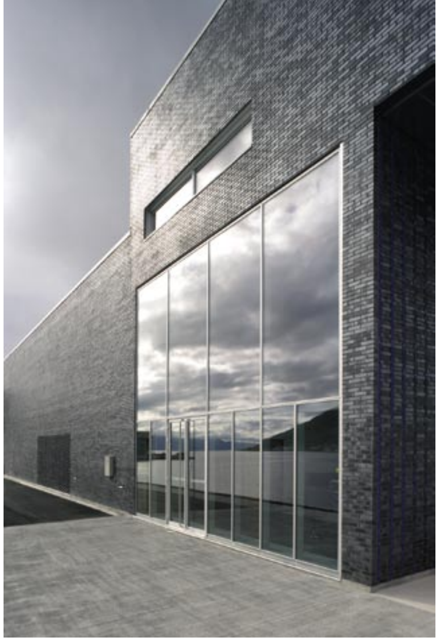
Tromsøysundet speiler seg i glassveggen i enden av foajéen