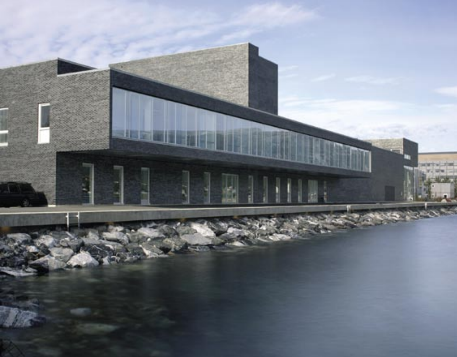
Skuespillergarderobene krager ut over strandpromenaden langs Tromsøysundet

mye i forhold til skiftende lysinnfall og refleksjoner. Steinene har i tillegg stor innbyrdes variasjon, slik at det også på nært hold er variasjon i flatens uttrykk.