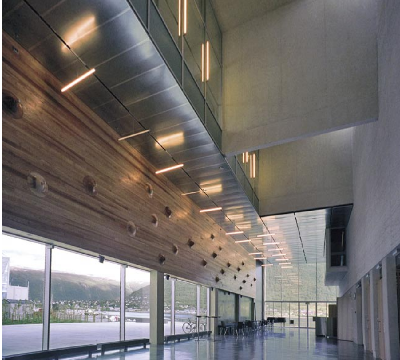
Foajéen sett mot sundet. Askeveggen med innfelle former av heltre er en utsmykning skapt av Martine Linge.