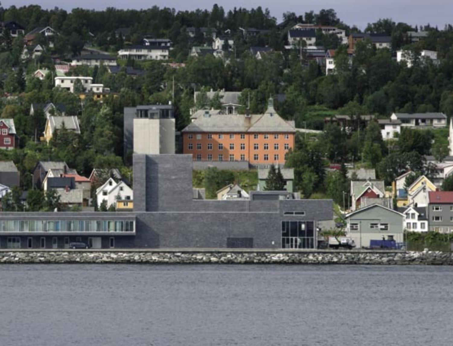
Hålogaland Teaters nybygg står i et variert bygningsmiljø

Det er variert med forskjellige typer teglforband og stussfugebredder i fasadene. Vist her utsnitt av løperforband og «perforert» forband med vindusfelt bak.