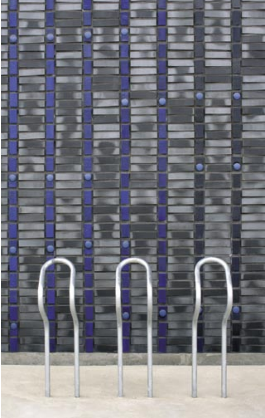
Utsnitt av den kunstnerisk bearbejdede teglveggen mot forplassen.