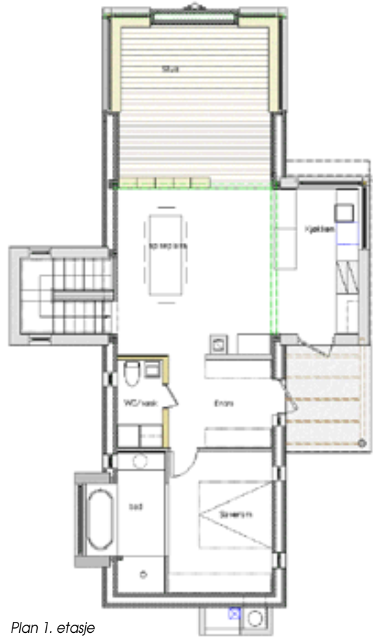
Plan 1. etasje