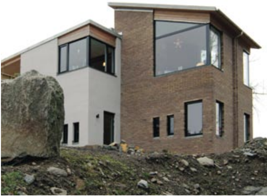
Tomten var ei bratt, østvendt skogkledd ur, – med mulighet for sjøutsikt mot nord