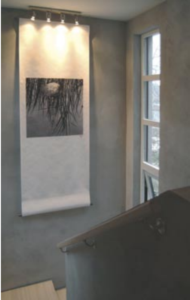
Trapperommet har loddpussete lecavegger med vinduer på to sider av repoet. Trappen er i lys ask.