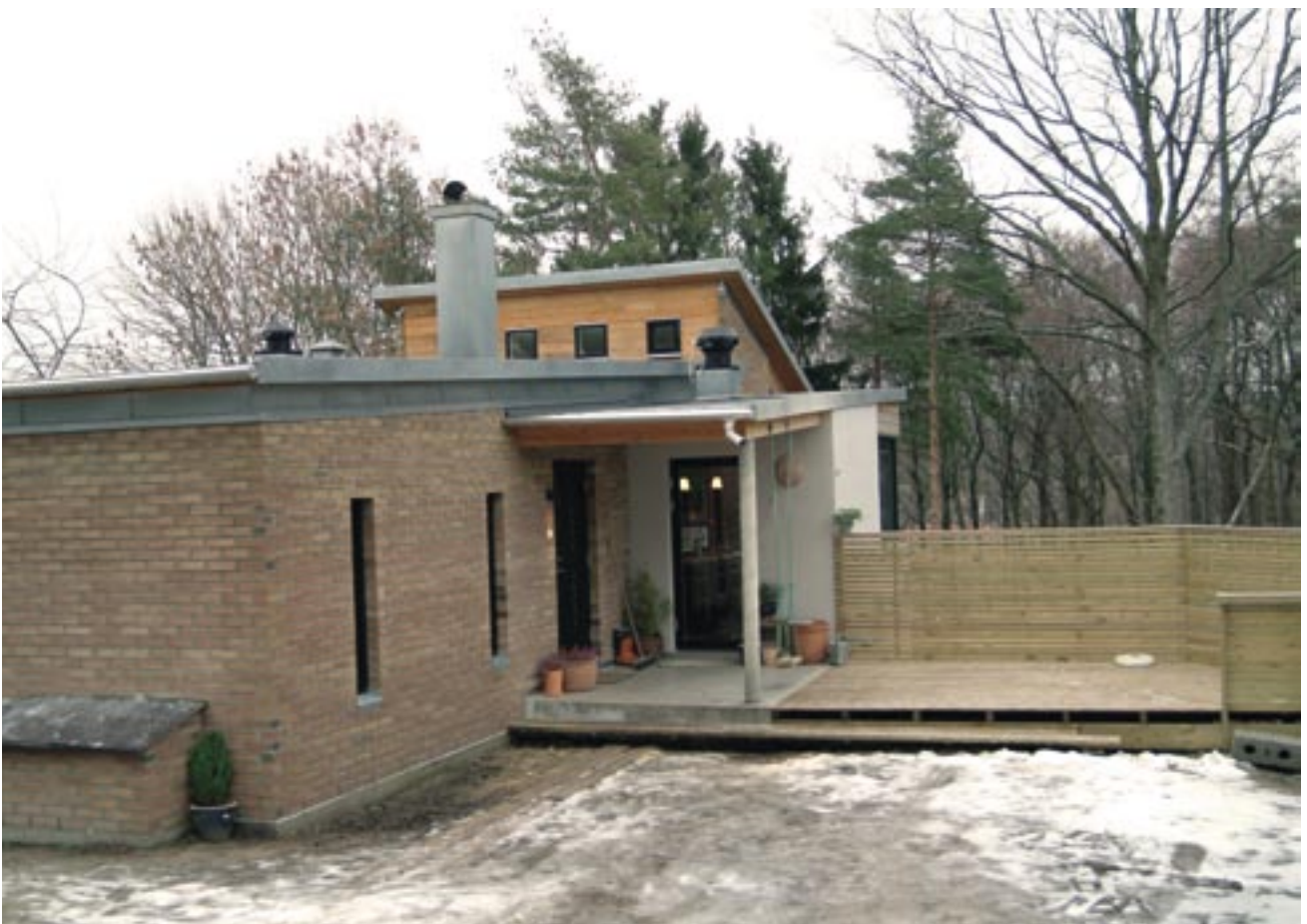
Inngangsparti med uteplass