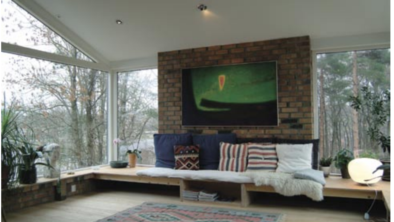
Sofabenk (under bygging) er tilpasset brystningshøyden på vinduene. Her sitter man blant tretoppene