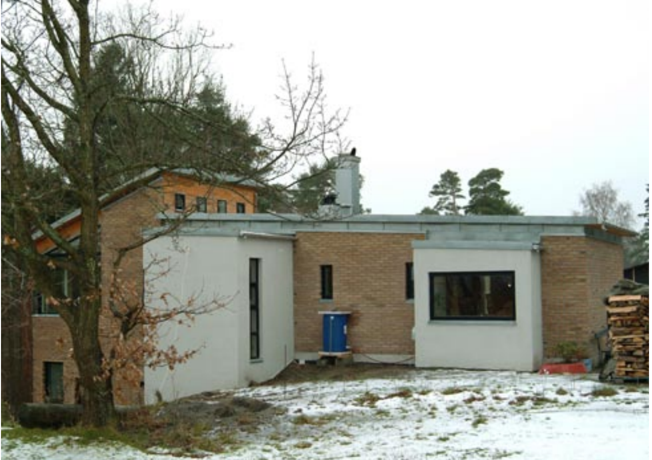
Sekundærvolumer i pusset leca, sett fra nord