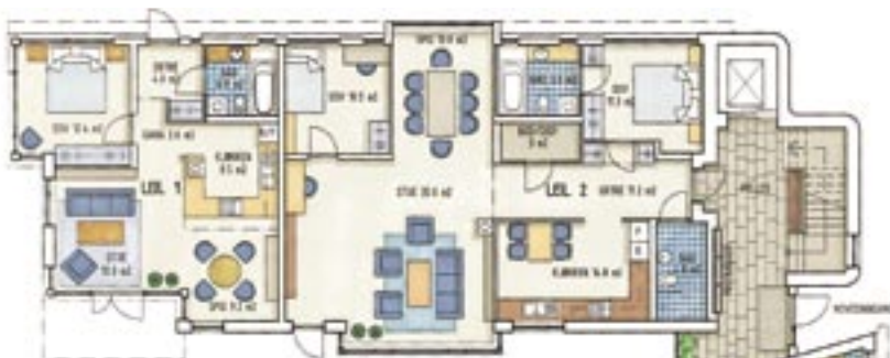
Plan 1. etasje