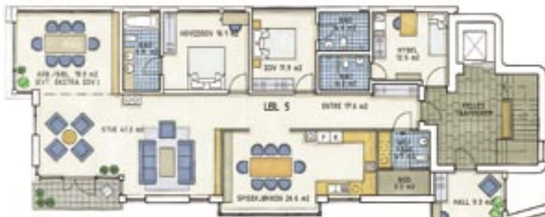
Plan 2. etasje