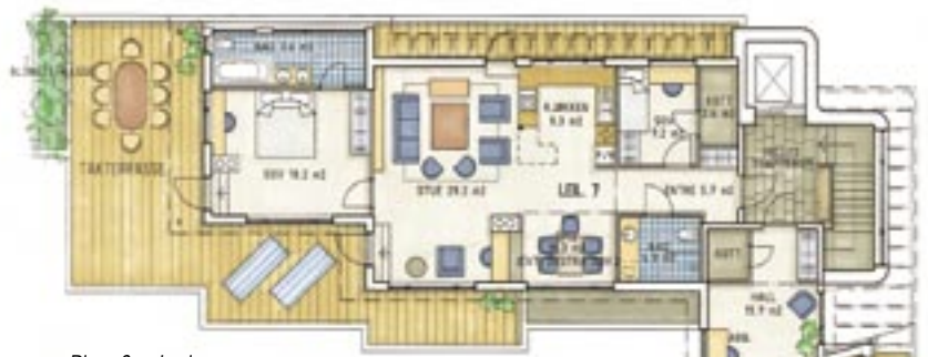
Plan 3. etasje