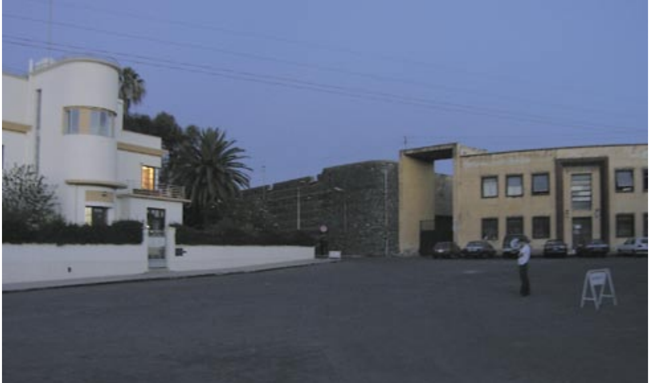
Villa, Arkitekt: ukjent, midt 1930-tall