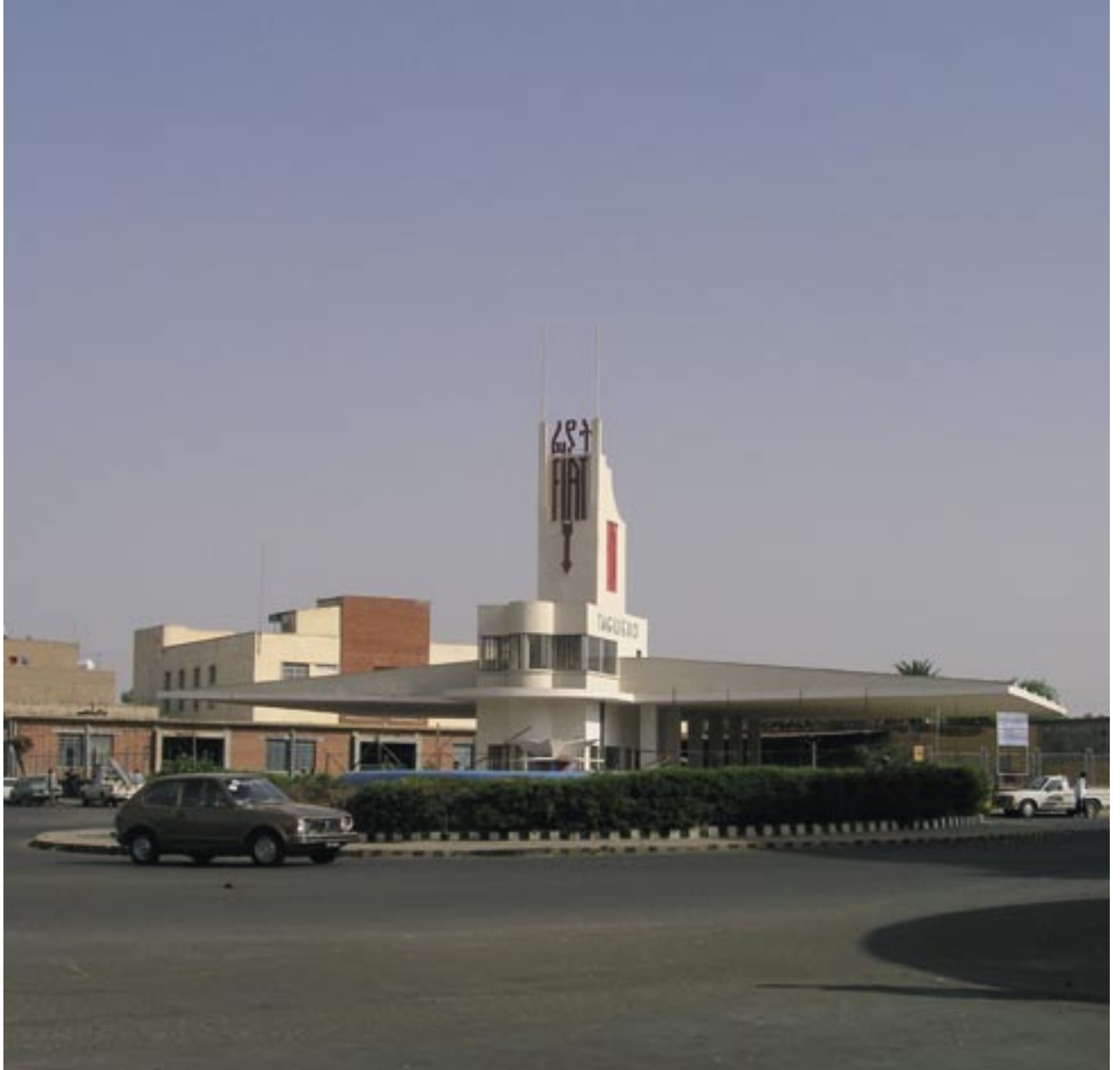
Bensinstasjon. Arkitekt: Giuseppe Pettazzi, 1937

Byen ble til ut i fra en italiensk idé; et modernistisk, rasjonalistisk og futuristisk konsept, som den italienske, fascistiske kolonimakt realiserte på høylandet ved Afrikas horn. Den mest fascinerende arkitekturen ble bygget på 1930-tallet. En tid som verden over var veldig innovativ, arkitektonisk sett. Tiden var preget av optimisme på teknologiens vegne.