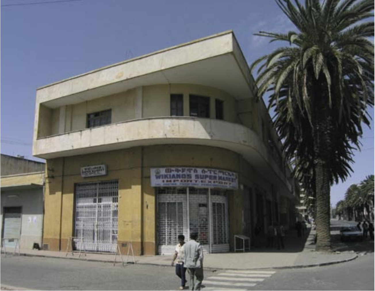
Forretninger og boliger. Arkitekt: Antonio Vitaliti, 1944