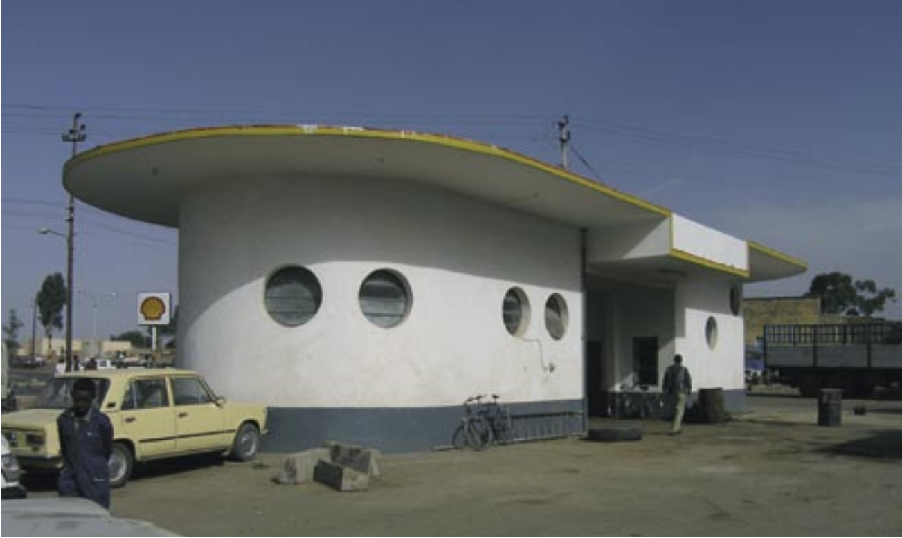
Bensinstasjon. Arkitekt: ukjent, 1937