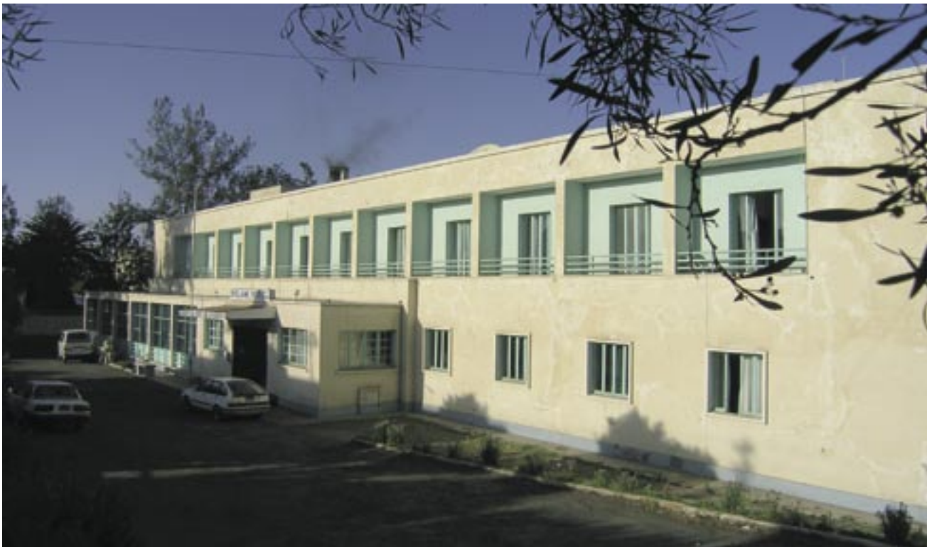
Hotel Selam. Arkitekt: Rinaldo Borgino, 1937