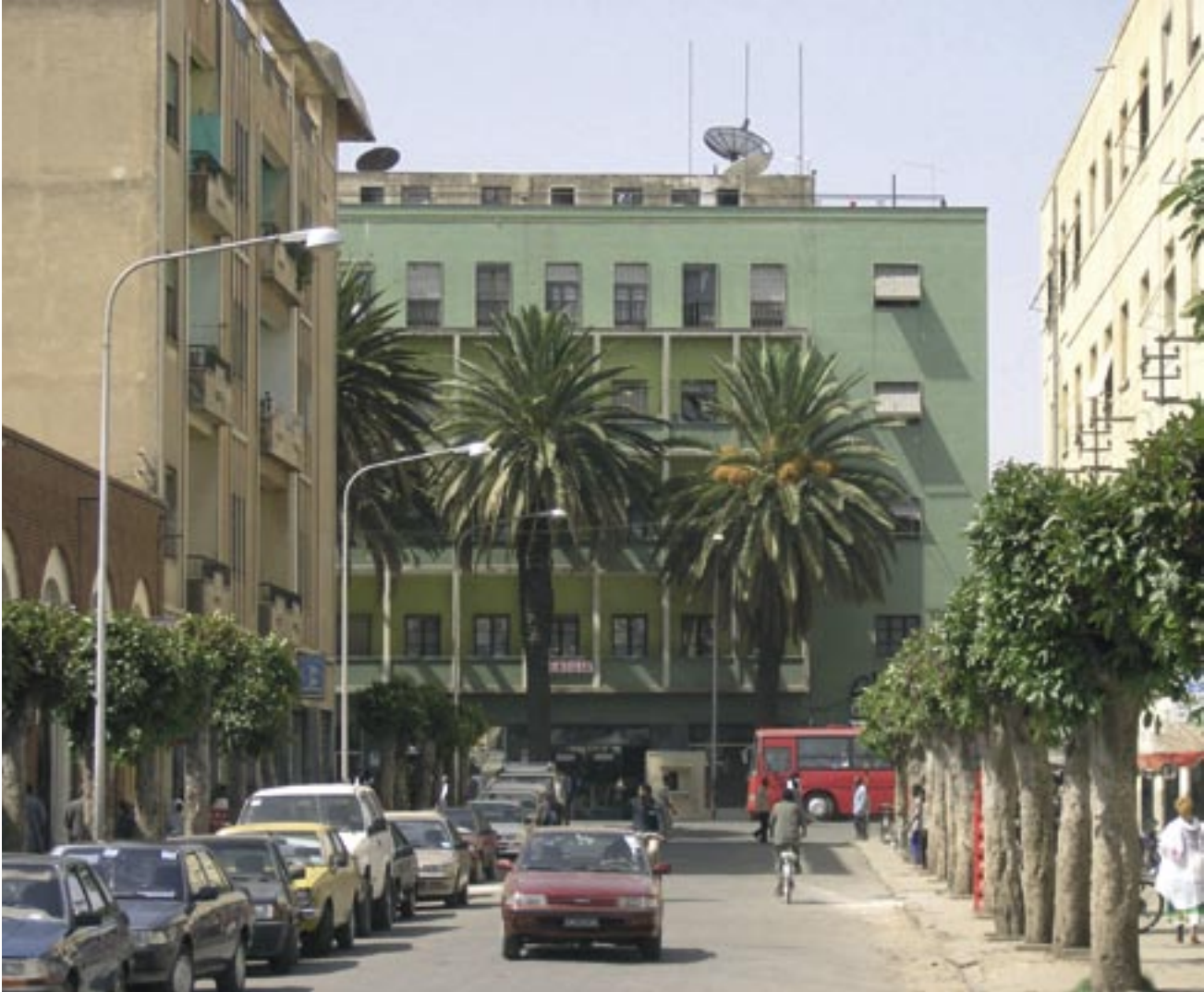
Forretninger og boliger. Arkitekt: Arturo Mezzedimi, 1956