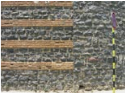
Forretninger og lager. Arkitekt: ukjent, sent 1930-tall