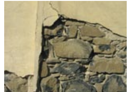
Alfa Romeo fabrikk og boliger. Arkitekt: ukjent, 1937

gjøre videoinnspillingen til en kunstnerisk og estetisk ekspedisjon. Vi samlet et lag som bestod av bandet, et film-team, skribenter og en fotograf og arkitekt.