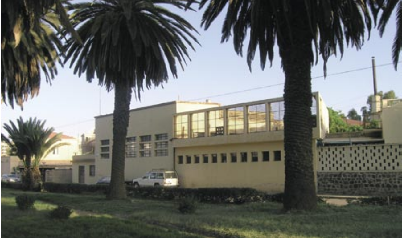
Svømmebasseng. Arkitekt: Arturo Mezzedimi, 1944