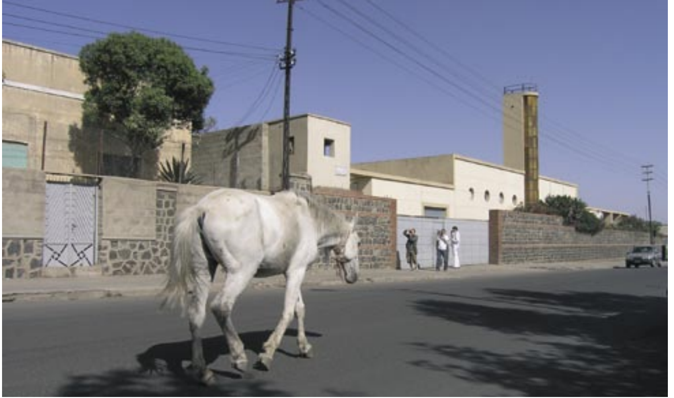
Fabrikk og utstilling. Arkitekt: Carlo Marchi og Carlo Montalbetti, 1938