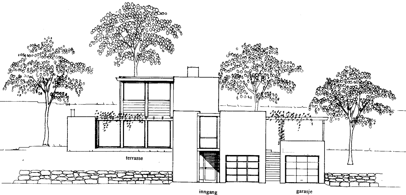
Fasade mot øst