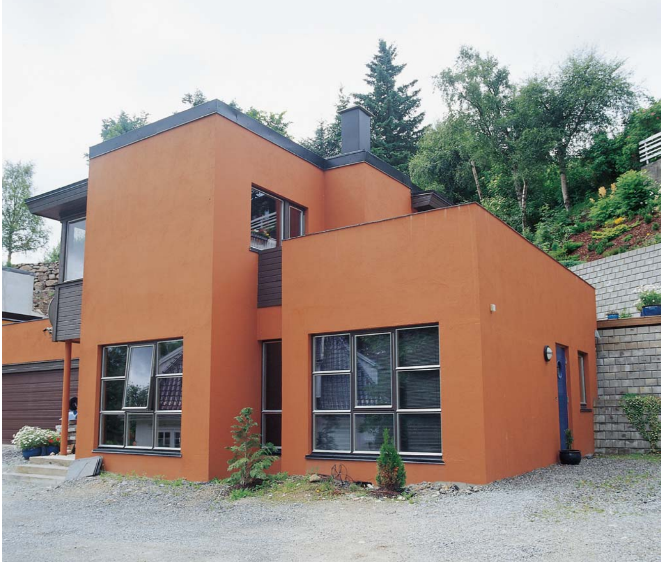
Fasade mot øst. Det er utgang til terrenget fra alle plan. Fra kjøkkenet kan man også komme ut på en stor takterrasse over hybeldelen (tidl. garasje).

Boligen er én av to tvillinghus som er bygget rett utenfor Sandnes sentrum. Eiendommen ligger vakkert til nær Gand gravlund og Sandvedparken. Tomten er østvendt og er derfor solrik morgen og midt på dagen, men mister solen relativt tidlig på kvelden. Nærheten til Rv 44 gjør den noe utsatt for trafikkstøy, og det ble en utfordring å kunne bygge en utvendig oppholdsplass med sol, men som også var skjermet mot trafikkstøy.