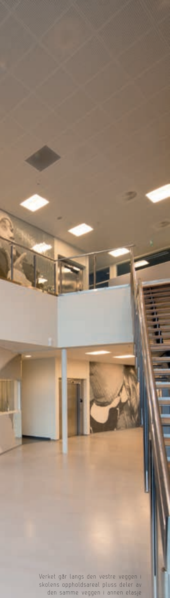
Verket går langs den vestre veggen i skolens oppholdsareal pluss deler av den samme veggen i annen etasje