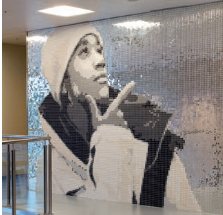
Den keramiske mosaikken er i en fargeskala på seks nyanser i format 25x25 mm. Håndkuttet speilmosaikk danner bakgrunn for portrettene og gir verket en ekstra dimensjon

rolle: mosaikken er konstruert spesielt for dette innsynet, men også for lysinnfallet denne store glassveggen gir. Skiftinger i årstid og lys gjør at verket stadig forandrer seg. Dette området fikk den største figurasjonen, med mulighet til å oppleve portrettet både gjennom glassfasadens store vindu, men også innenfra, på avstand, fra første og andre etasje.