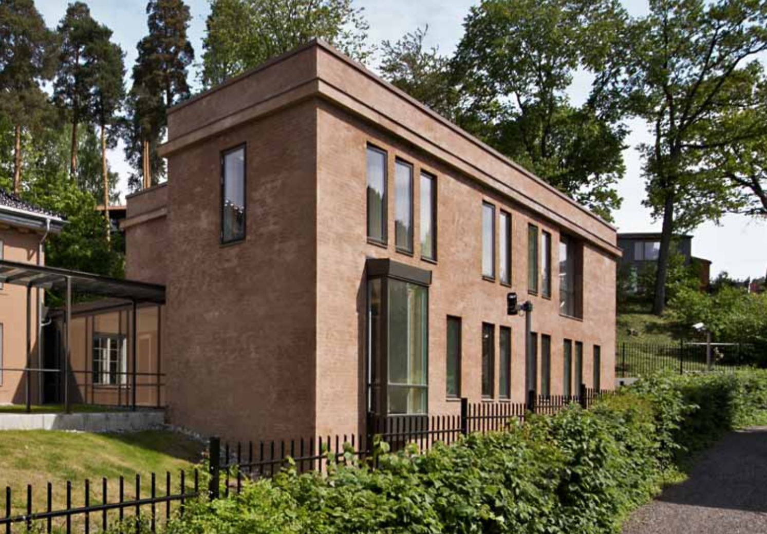
Fra sydøst. Tilbygget har en sekkeskurt overflate i samme terrakottafarge som den rehabiliterte villaen