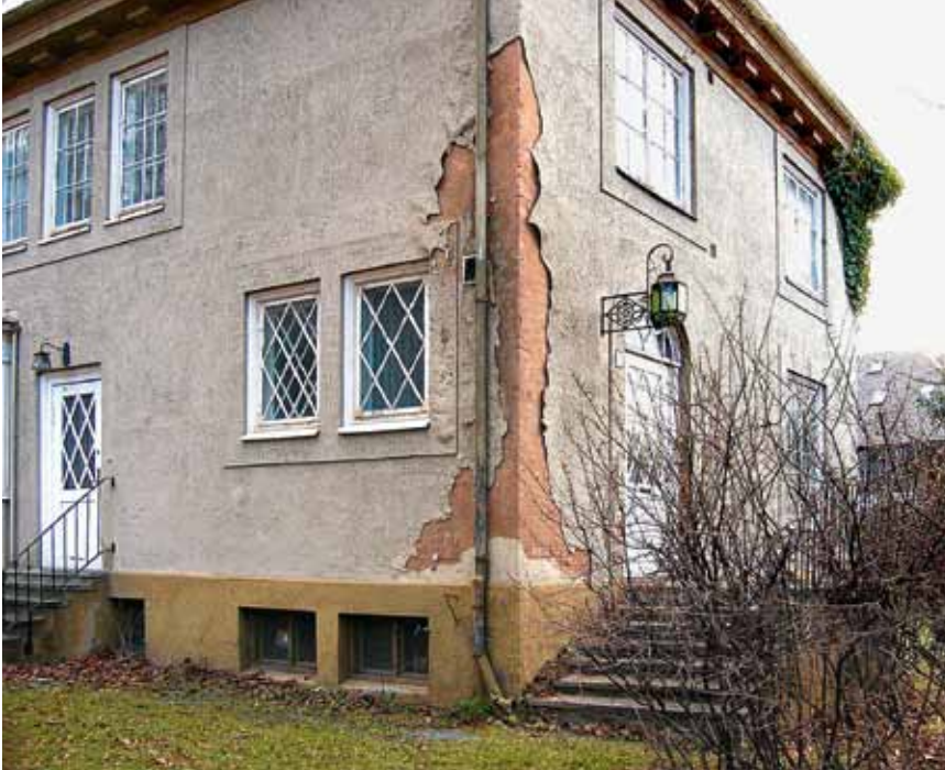
Den bevaringsverdige villaen fra 1920 trengte omfattende rehabilitering. Teglfasaden hadde en grå puss som var i ferd med å løsne. Bak pussen fantes restene av terrakottafarget puss. Gammel puss ble fjernet, og ny puss ble påført i den opprinnelige fargen.