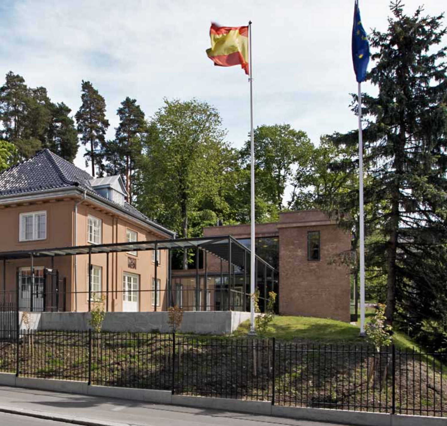
Sett fra vest. Villaens eksteriør er beholdt, mens tilbygget er gitt et nyere formspråk, visuelt forbundet med villaen gjennom farge, skala og enkelte detaljer