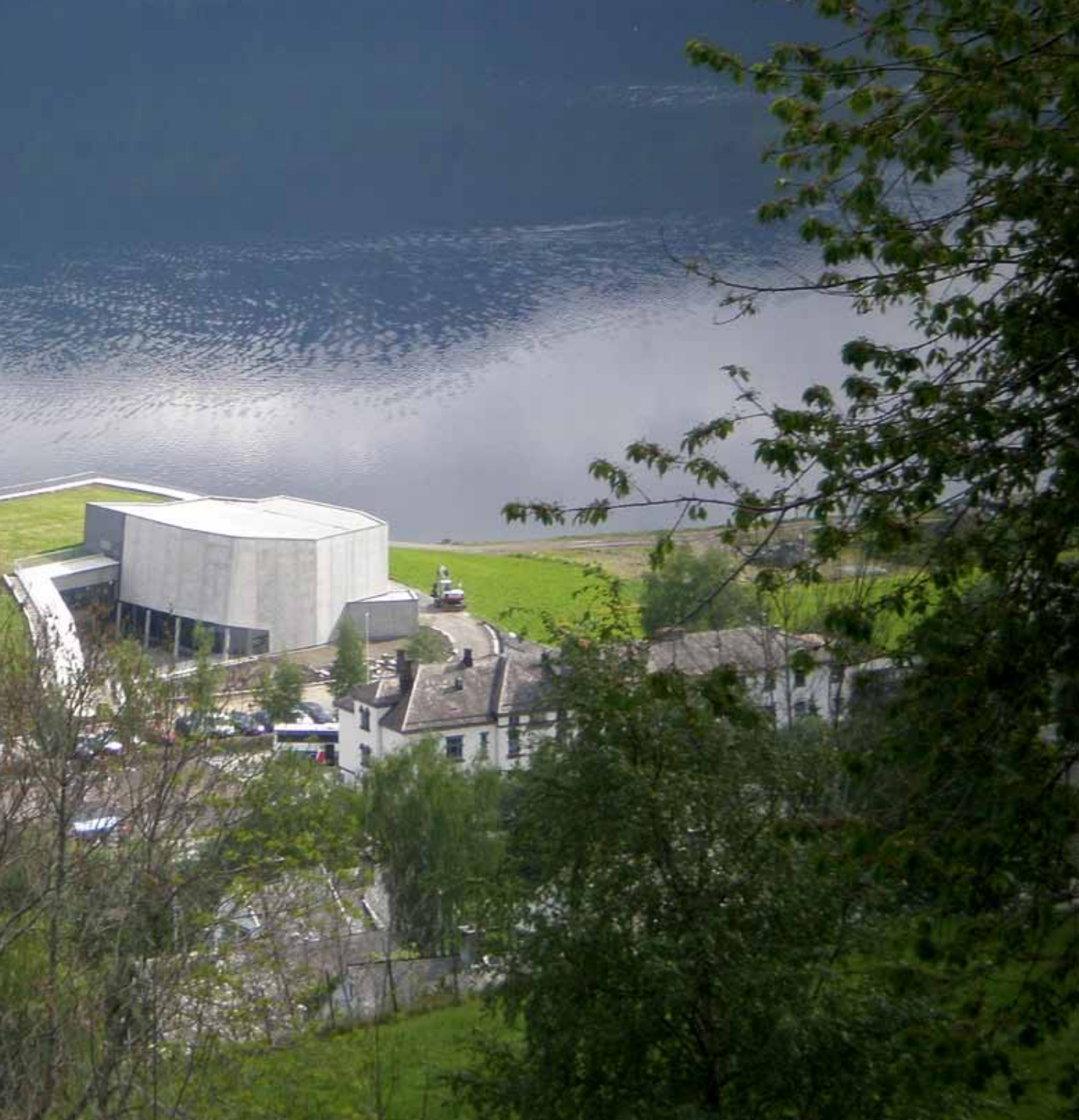
Sett fra nord. Kulturhuset ligger vest på Vossevangen i parklandskapet mellom Fleischers hotell/jernbanestasjonen og Vangsvatnet

let under et felles tak som løfter seg fra parklandskapet som om det er selve torva som er løftet opp. Inspirert av biblioteket i Delft og den nye operaen i Oslo har vi på denne måten søkt å understreke bygget som en del av parklandskapet mere enn som et tradisjonelt bygg i bymessig sammenheng. Samtidig er taket blitt et attraktivt utsiktspunkt i et rekreativt område med stor aktivitet i sommerhalvåret.