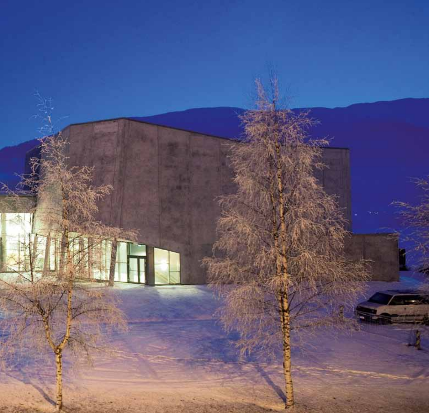
Kinosenteret (til høyre i bildet) ligger som en 'steinhelle' inspirert av det barske landskapet, mens øvrige aktiviteter er samlet under et felles tak som løfter seg fra parklandskapet som om det er selve torva som er løftet opp. Taket er blitt et attraktivt utsiktspunkt