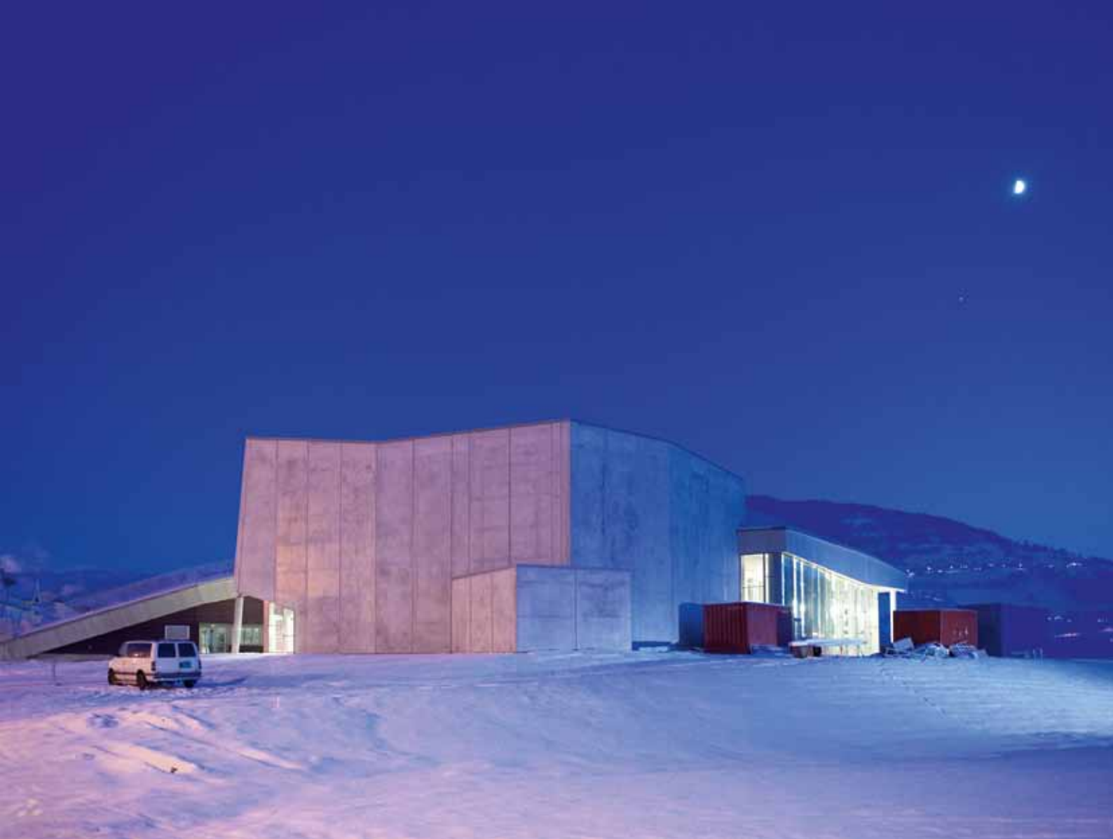
Sett fra vest