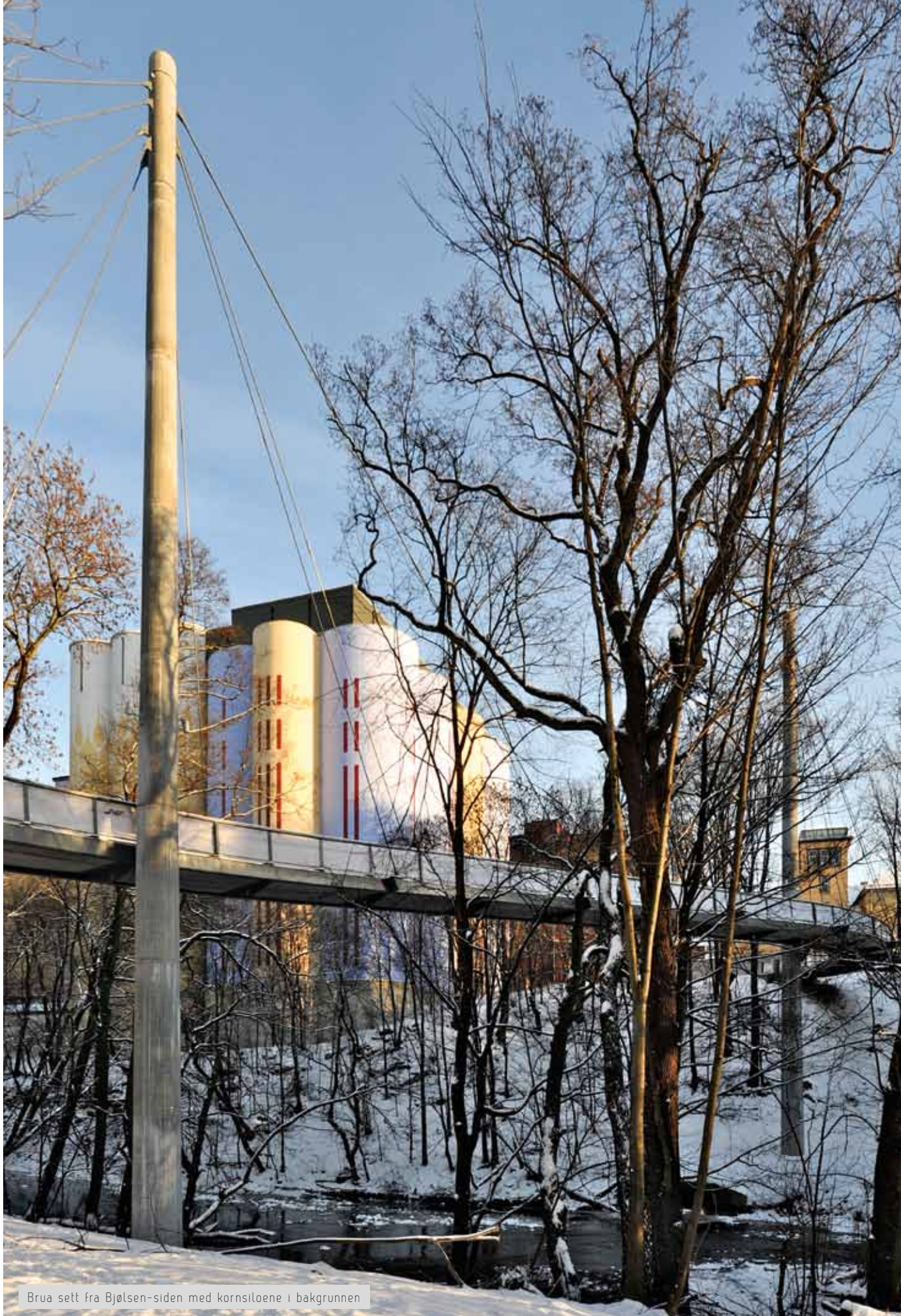
Brua sett fra Bjølsen-siden med kornsiloene i bakgrunnen