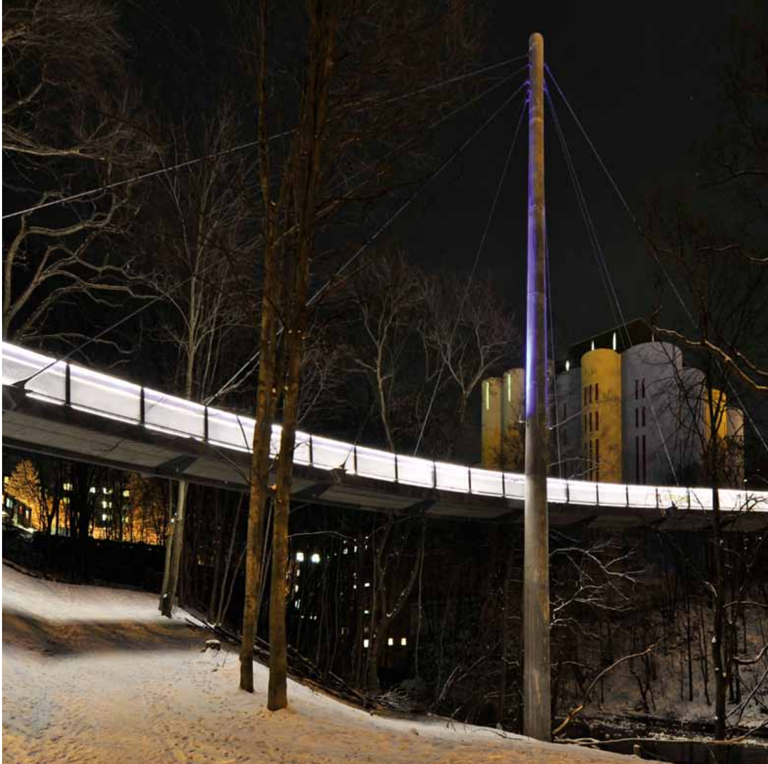
I mørket beskriver rekkverket brua som et lysende bånd

at det tok lang tid å få full finansiering på plass. Ansvar for prosjektering og gjennomføring ble overtatt av Samferdselsetaten (nå del av Bymiljøetaten). Byggearbeidene startet i 2010.