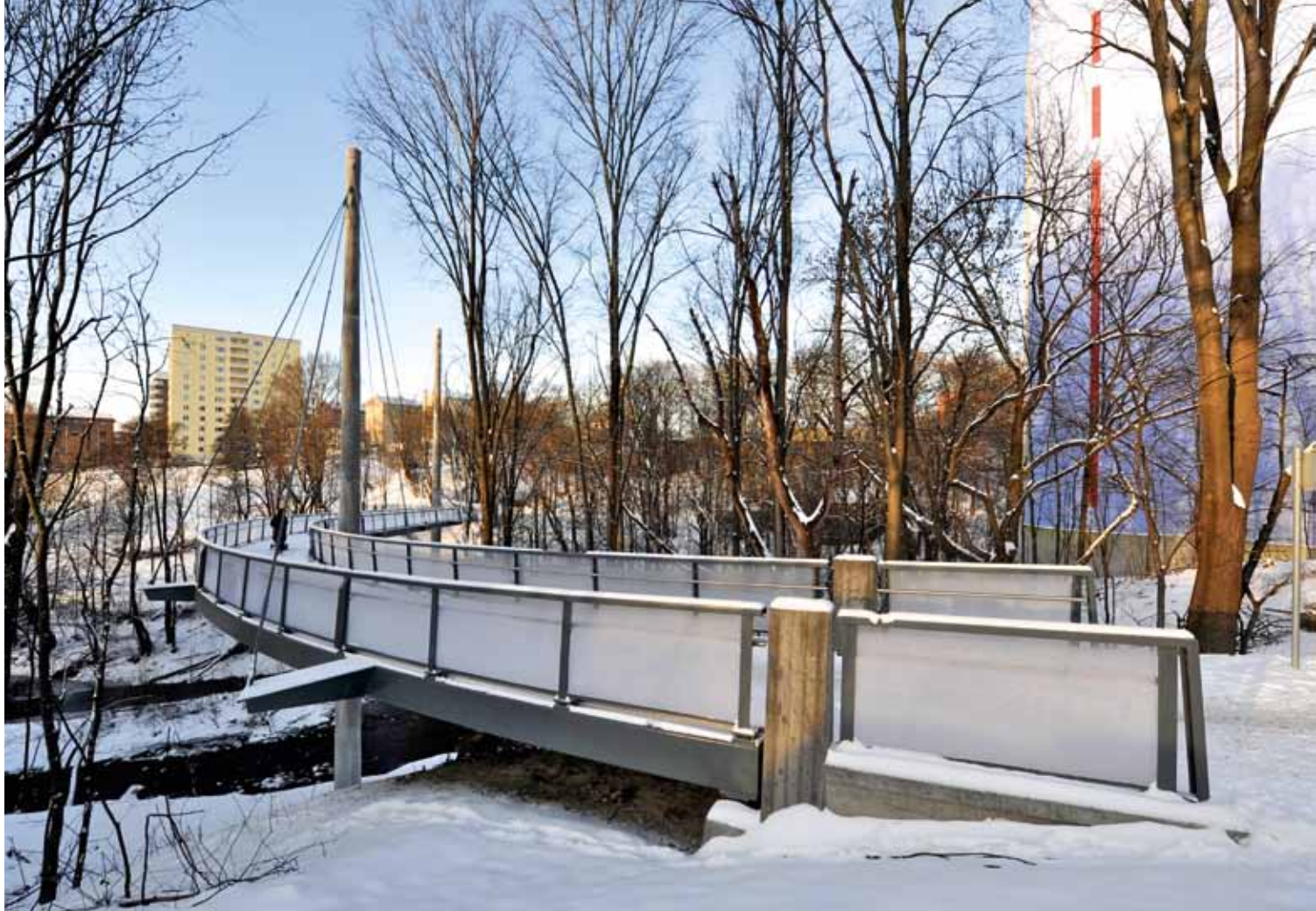
Brua gir en slak og god forbindelse over den dype elvedalen