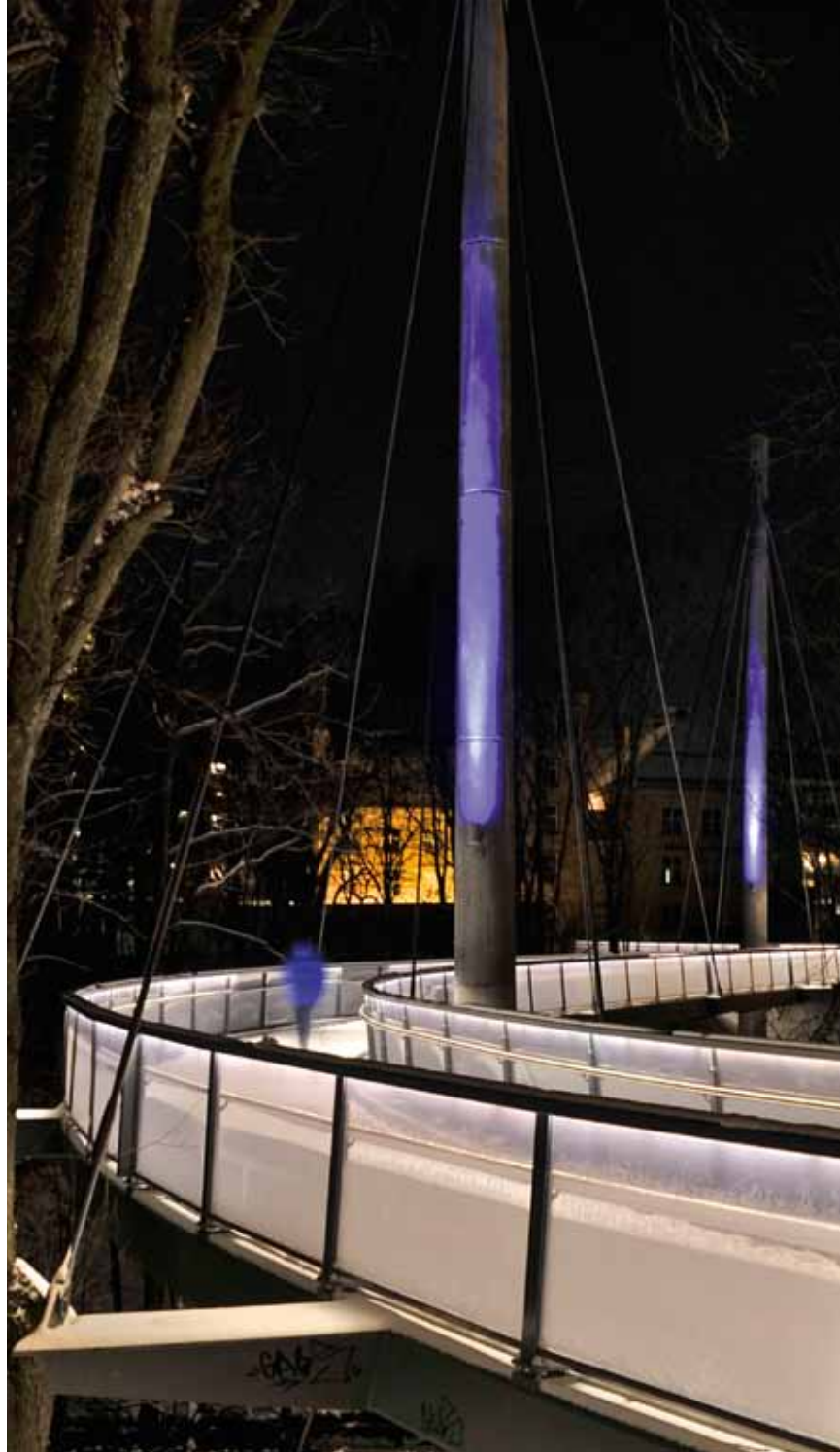
Tårnene har blå effektbelysning

paneler i mønsterpreget polykarbonat. Stålkonstruksjonene er lakkert i en mørk grågrønn farge. Håndløperne er i rustfritt stål.