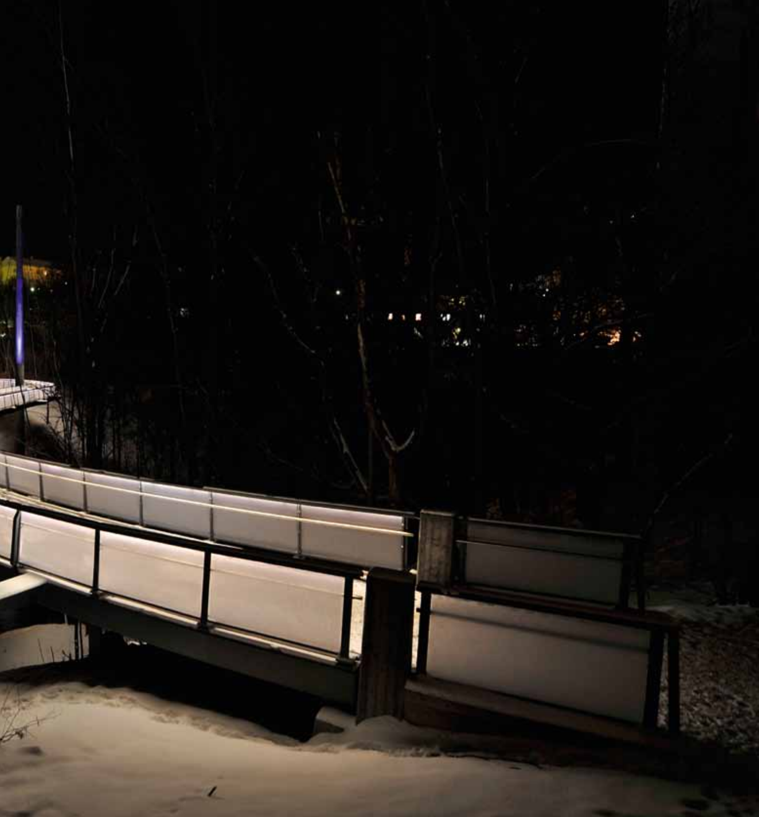
Brua sett fra Sandaker-siden. Brubanen slynger seg mellom trekrone

med hensyn til bredde og stigningsforhold.