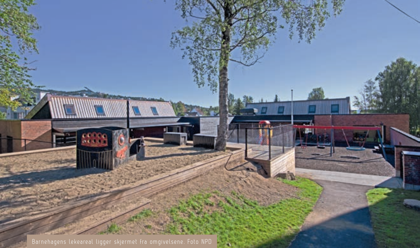
Barnehagens lekeareal ligger skjermet fra omgivelsene.