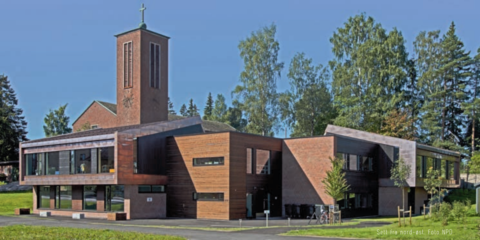
Sett fra nord-øst.