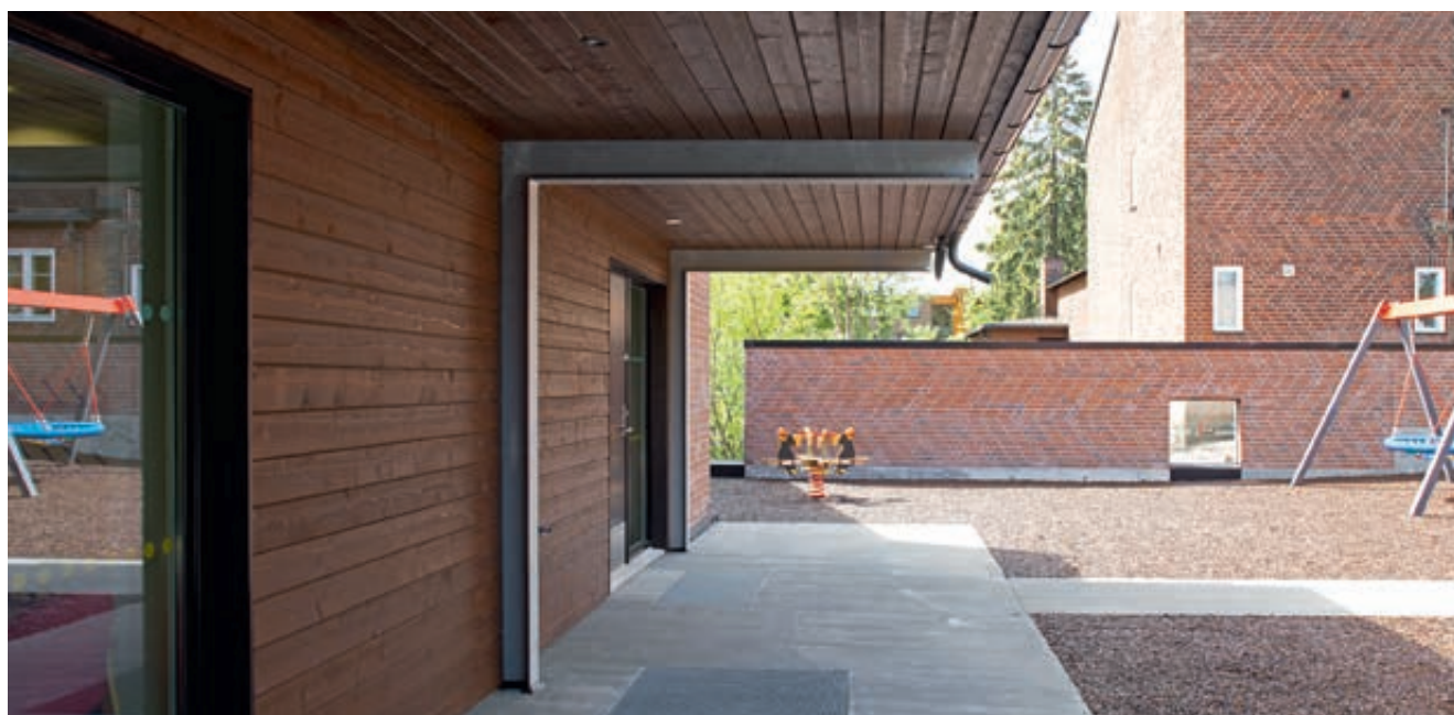
Sett fra nord: Bygningskroppen skjerner lekeplassen fra den trafikkerte Vækerøveien, og skaper en orientering mot kirken. Foto M6