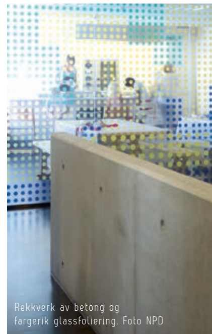
Rekkverk av betong og fargerik glassfoliering.

Første etasje ligger delvis under terreng og inneholder spesialrom for musikk og drama, formingsrom og bibliotek, i tillegg til personalfunksjoner, tekniske rom og varelevering. En stor del av etasjen som ligger under terreng er vinnredet og er ikke tatt i bruk