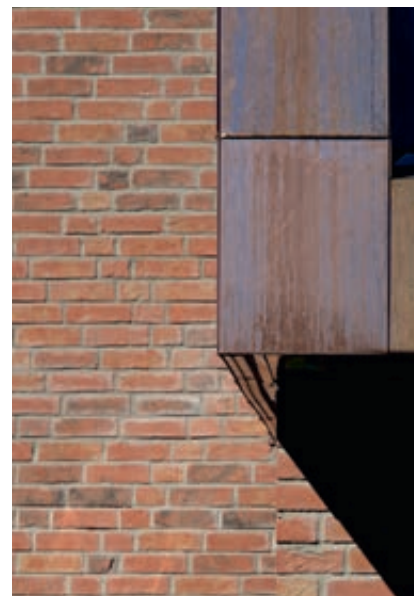
Rød tegl i munkeforband skaper et slektskap mellom barnehagen og kirken.

For øvrig har barnehagen en kledning av treverk i tre ulike valører, mørke dører og vindusinnramninger. De utragede paviljongene er kledd i kobber. Materia- lene er valgt for å spille sammen med det gamle kirkebygget, slik at barne- hagen framstår som en naturlig del av kirkeanlegget.