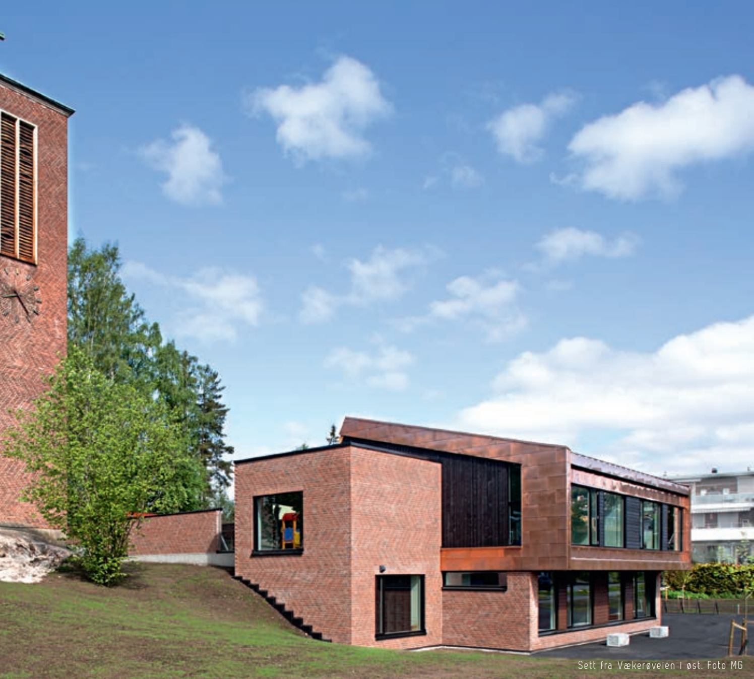
Sett fra Vækerøveien i øst.