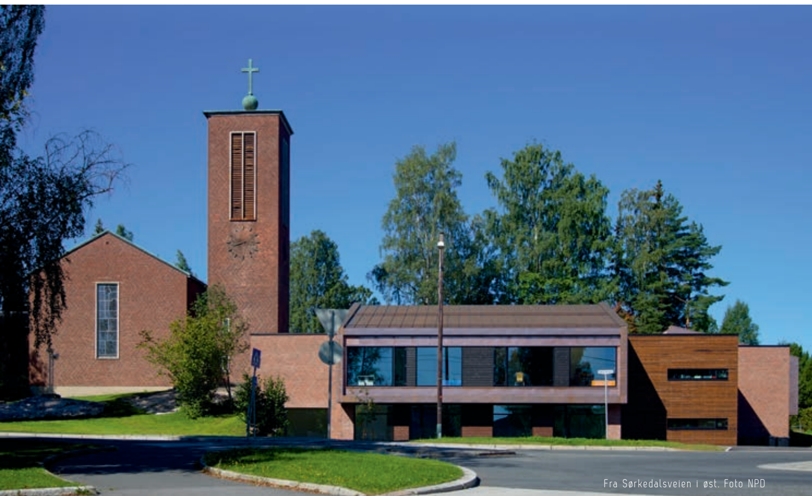
Fra Sørkedalsveien i øst.