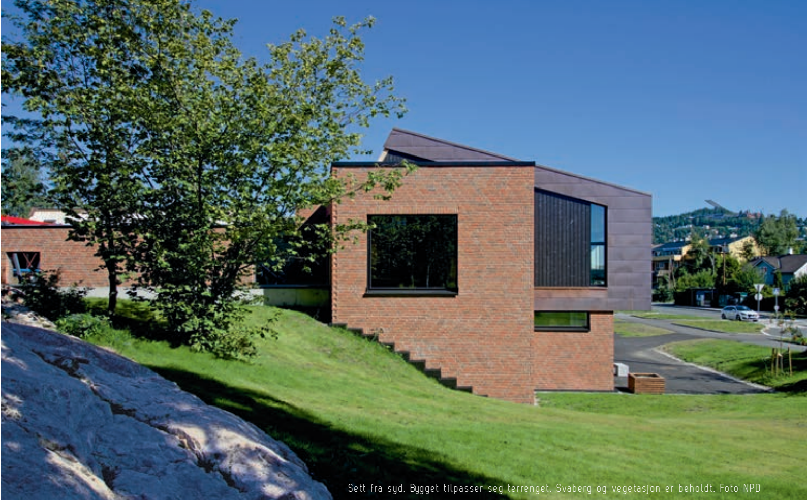
Sett fra syd. Bygget tilpasser seg terrenget. Svaberg og vegetasjon er beholdt.