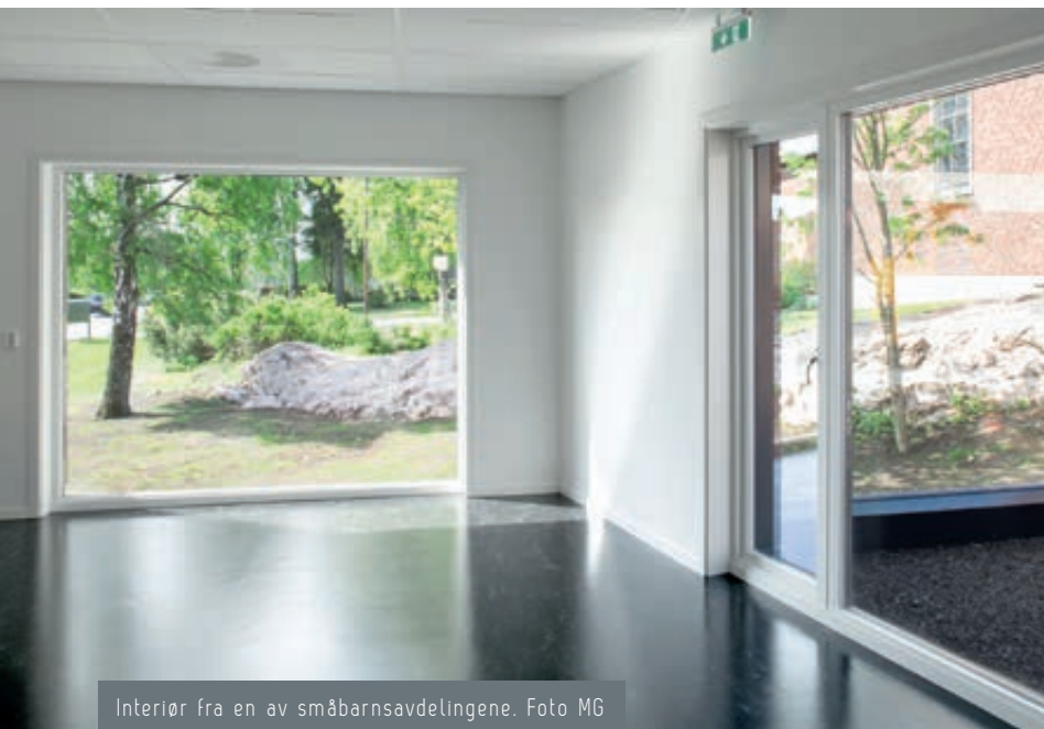
Interiør fra en av småbarnsavdelingene.