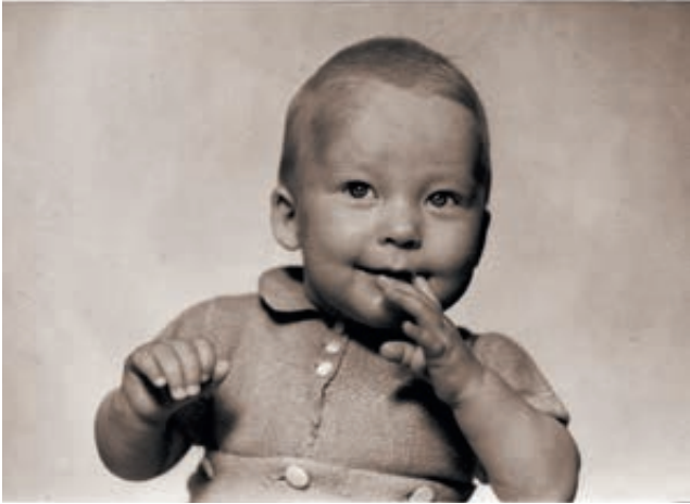
1947: Ekte Fredsbarn fra Sagene

ødelegger sjelen». Og selv når bygningen står der, kan den plutselig bli ombygget. Jeg har opplevd det.