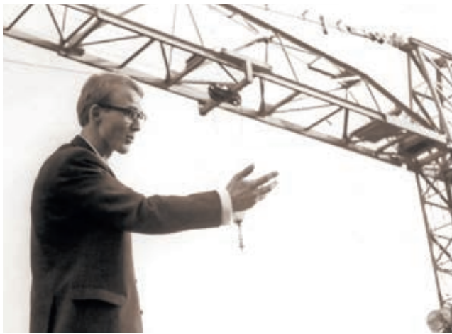
1968: Studier ved ETH, Zürich