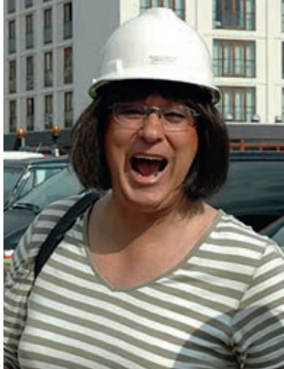
2007: Befaring i København