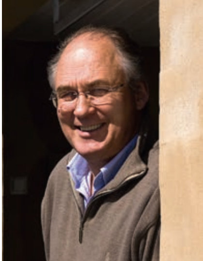
2005: Besøk hos storfornøyd byggherre