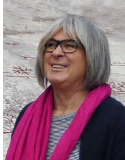
2015: Studietur – helleristninger