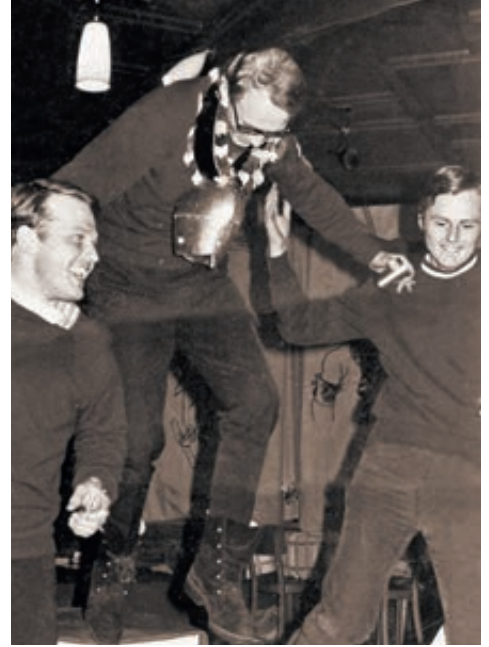
1970: Unterwasser ANSA-mesterskap

- Å ja. Jeg var skihopper, og du kan tenke deg hvilken oppstandelse det ble hjemme hos oss når alle hoppkonkurransene var på søndag. Det var kjefting og smelling, og jeg fikk absolutt ikke