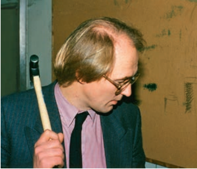
1987: Poengene hamres hjem på AHO