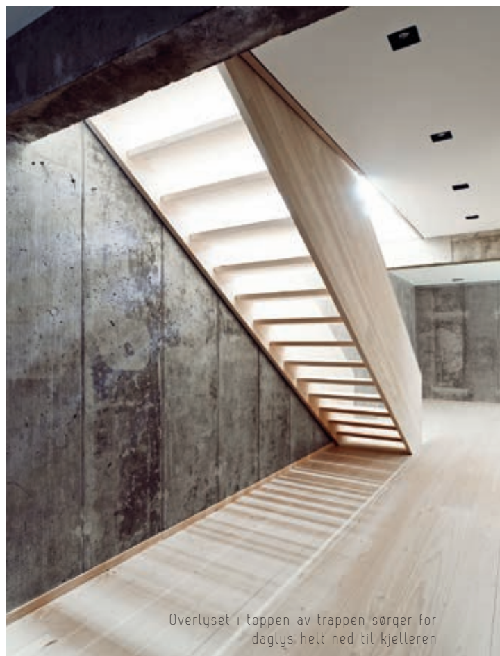
Overlyset i toppen av trappen sørger for daglys helt ned til kjelleren