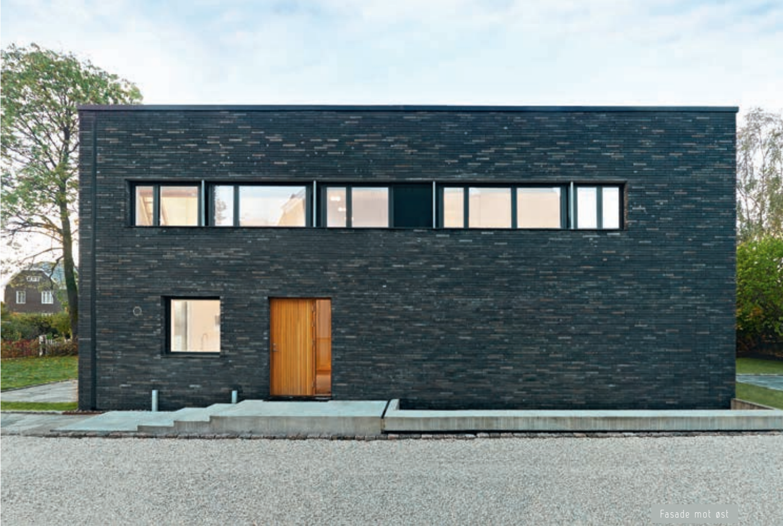
Fasade mot øst