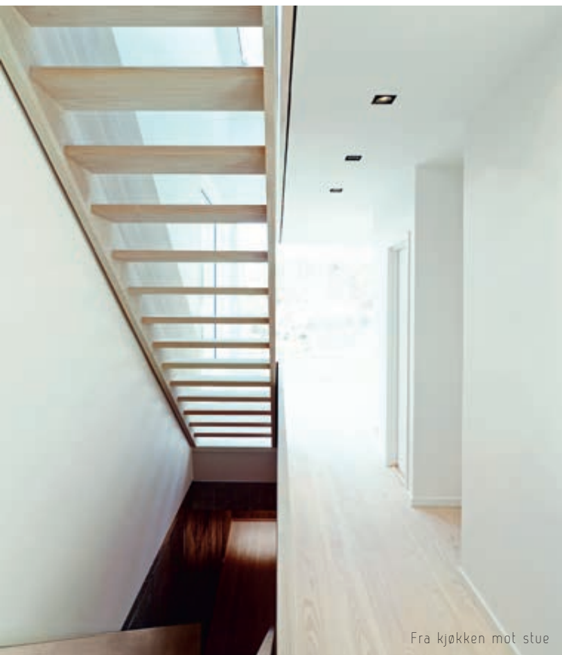
Fra kjøkken mot stue