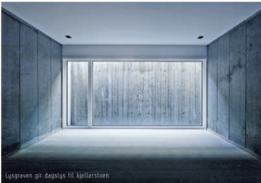
Lysgraven gir dagslys til kjellerstuen

tilbaketrukne fuger. Dette gir inntrykk av en tørrstabet fasade hvor andelen av mørtel er redusert til det minimale. Materialpaletten for øvrig er dempet, og interiøret begrenser seg til eksponert betong og malt gips på vegger, med gjennomgående gulv og trapper i samme type granmateriale.