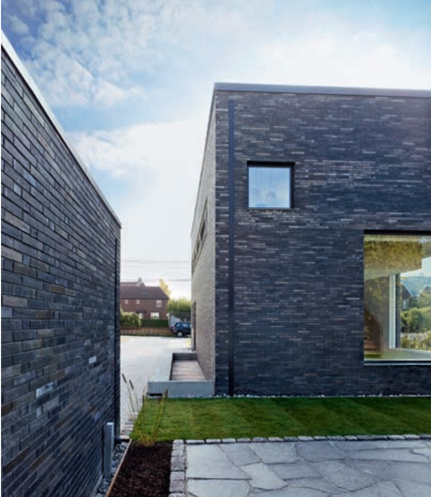
Sett fra nord. Garasjen til venstre