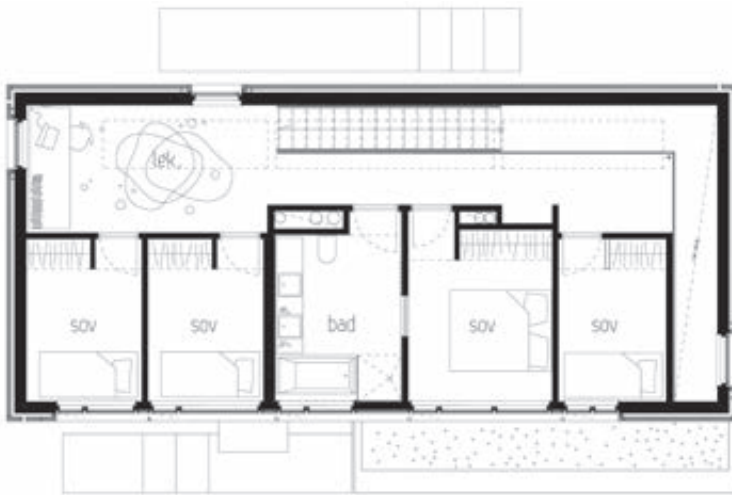
Plan 2. etasje