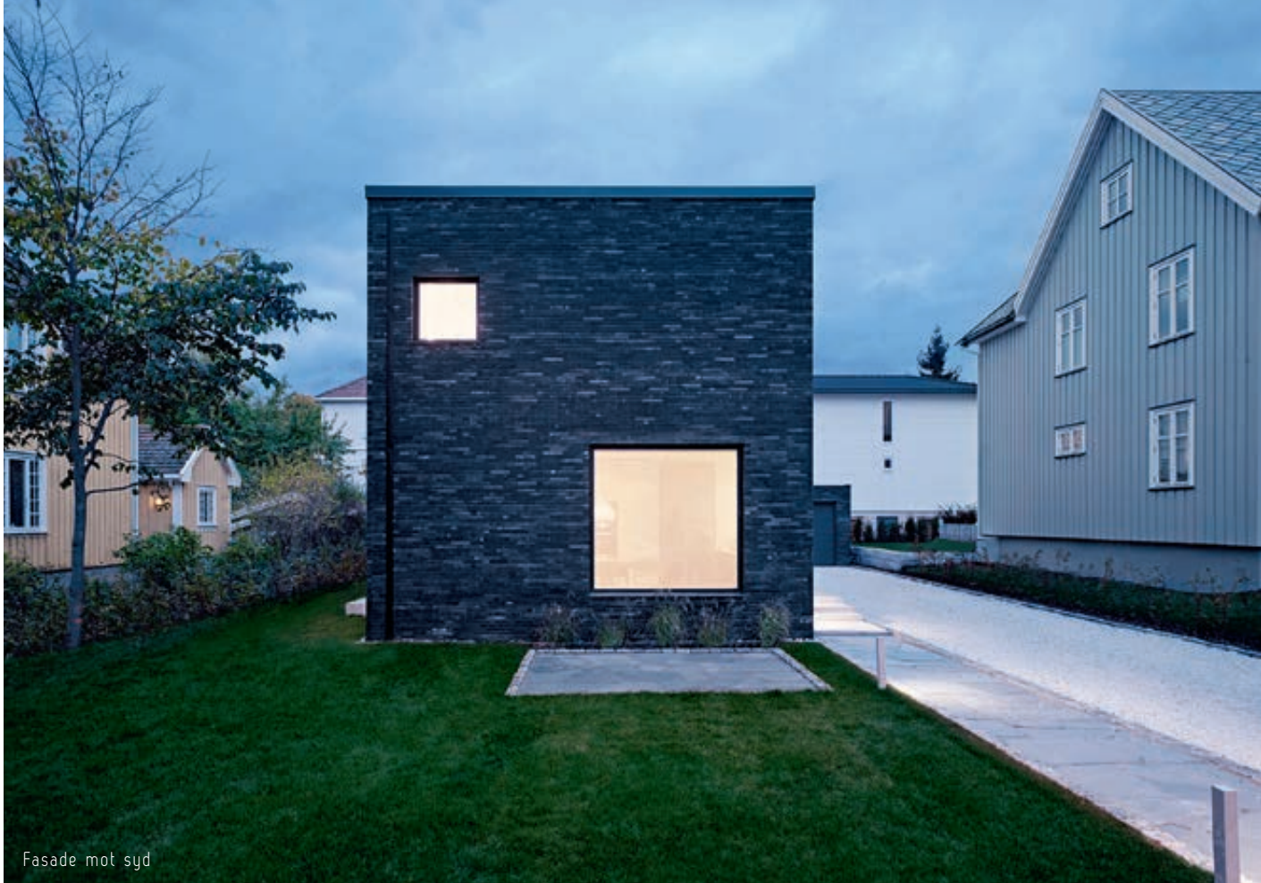
Fasade mot syd