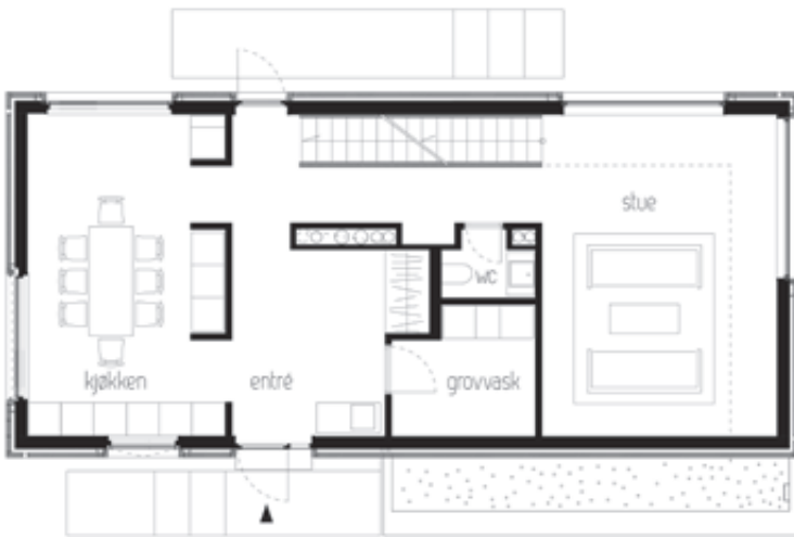
Plan 1. etasje