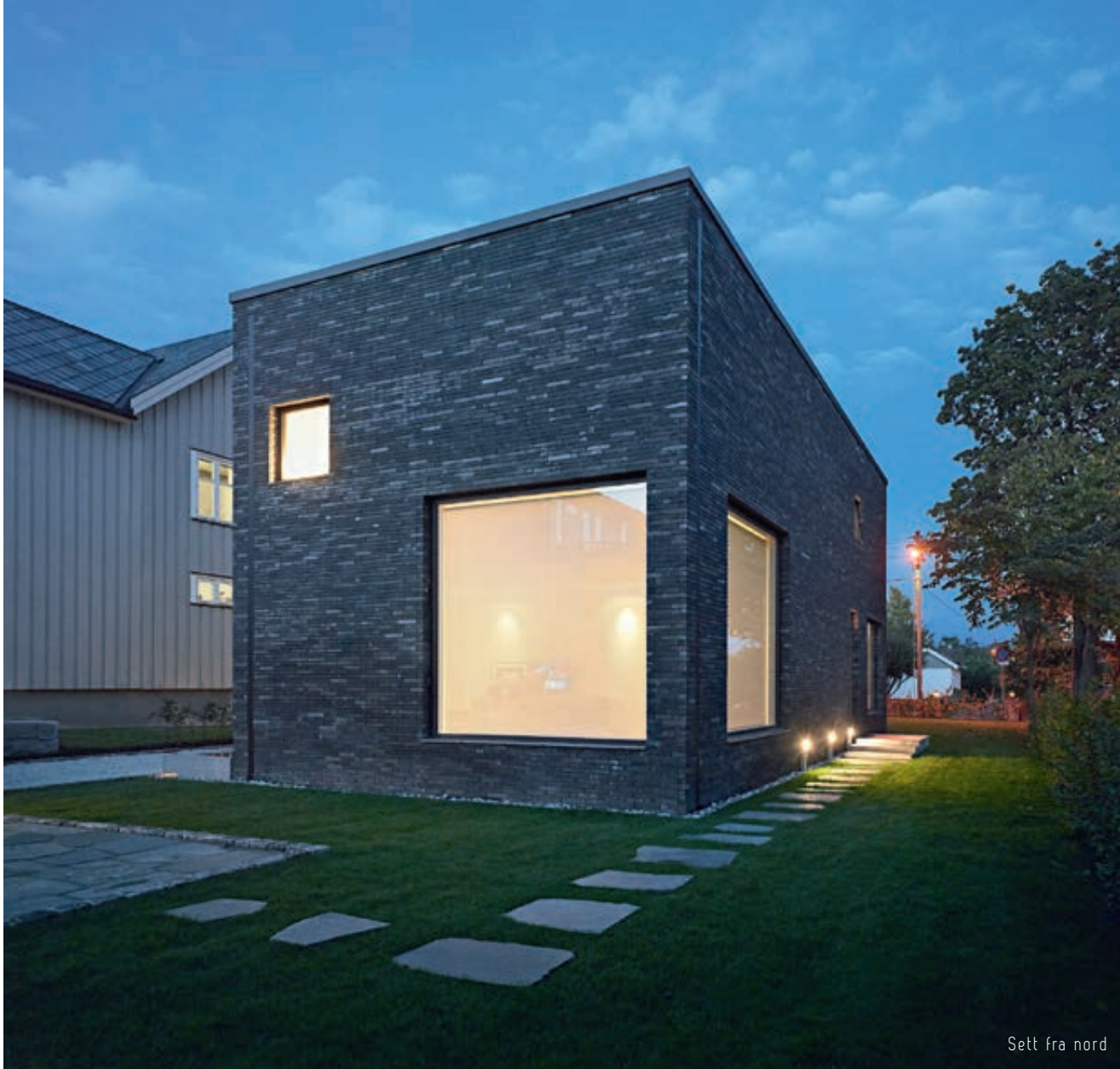
Sett fra nord