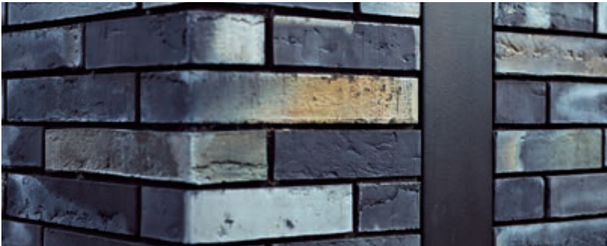
Murverket har 6 mm utkrassede fuger. Bevegelsesfuger er kombinert med taknedløp